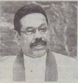
நேற்றுமுன்தினம் அலரி மாளிகையில் தைப்பொங்கல் விழா இடம்பெற்றது. இவ் விழாவில் கலந்துகொண்டதன் பின்னர்

மாற்றங்களுடனேயே நாடாளுமன்றம் வரும் என்கிறார் ஜனாதிபதி