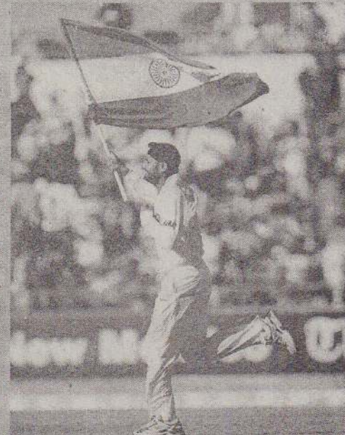
93 ஓட்டங்களும், 2ஆவது இன்னிங்ஸில் இக்கட்டான நிலையில் லக்ஸ்மன் சேர்த்த 79 ஓட்டங்களும் இந்தியாவின் ஓட்ட எண்ணிக்கை உயர்வுக்கு முக்கிய பங்காற்றின. மீண்டும் அதே போன்ற ஒரு நிகழ்வை நம் கண்முன் நிறுத்தியிருக்கிறார்கள். ஆனால், ஒரேயொரு வித்தியாசம்தான். அன்று கங்குலி தலைமையிலான இந்திய அணி இச்சிறப்பை பெற்றது. இன்று கும்பே தலைமையிலான அணிக்கு அந்தப் பெருமை கிடைத்துள்ளது. அவ்வளவுதான்!

இப்போது ஹர்பஜன்சிங் இல்லாவிட்டாலும் முதல் இன்னிங்ஸில் டிராவிட் விளாசிய