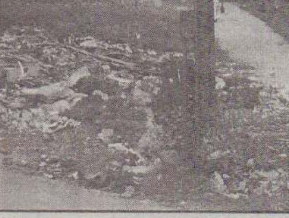
இப்பகுதியால் பாடசாலை மாணவர்கள் உட்பட பெரும் எண்ணிக்கையானோர் போக்குவரத்துச் செய்து வருகின்றனர். இவ்வாறு கொட்டப்பட்டுள்ள கழிவுகளால் அப்பகுதியில் பெரும் தூர்நாறும் வீசுவதாகவும் இதனால் போக்குவரத்துச் செய்ய முடியாத நிலைமை ஏற்பட்டுள்ளதாகவும் மக்கள் விசனம் தெரிவிக்கின்றனர்.

இந்த வகையில் யாழ். இந்து மகளிர் கல்லூரிக்கு அண்மையில் புகையிரத நிலைய வீதியில் இவ்வாறு குப்பைகள் மற்றும் கழிவுகள் பெருமளவில் கொட்டப்பட்டுள்ளன.