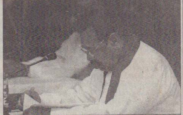
கையளிக்கப்பட்ட யோசனையை ஜனாதிபதி ஊன்றிப் படிக்கும் போது....

வெளிவிசார அமைச்சு அலுவலகத்தில் இன்று நண்பகல் 12 மணிக்கு இடம்பெறும் இச்சந்திப்பில் அமைச்சர் ரோஹித போகலலாகம, (10ஆம் பக்கம் பார்க்க)