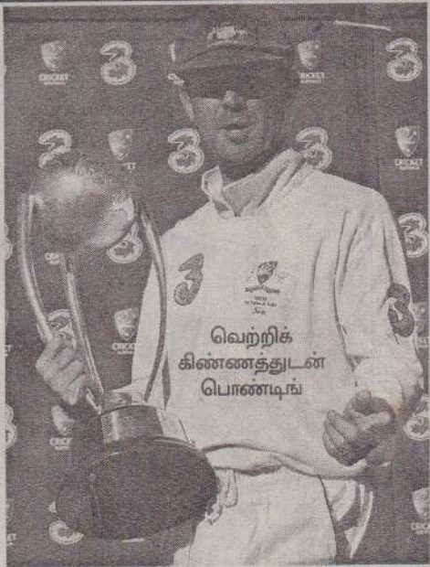
வெற்றிக் கிண்ணத்துடன் பொண்டிங்

அடிவெய்ட் போட்டியின் நேற்றைய 5ஆம் நாள் அட்டத்தில் 2ஆவது இன்னிங்ஸைத் தொடர்ந்து ஆடிய இந்திய அணி 7 விக்கெட்டுகள் இழப்புக்கு 269 ஓட்டங்களைக் குவித்து 'டிக்கேயர்' செய்தது. இதன்மூலம் ஆஸியின்