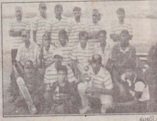
சம்பியன் சின்னத்தை சவீகரித்துக் கொண்டசச்சின் விளையாட்டுக் கழக வீரர்களை படத்தில் காணலாம்.

வலி.வடக்கு, ஜன.29 மல்லாகம் கோட்டைக் காடு ஸ்ரீமுருகன் கழகத்தினால் அமரர் து.பிரதீஸின் 10ஆவது ஆண்டு நினைவையொட்டி நடத்தப்