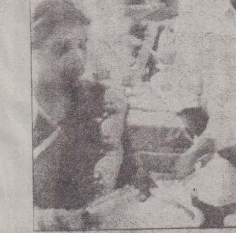
தென்மராட்சி அறவழிப் போரூட்டக் கழுவின்மும் களேய உலக பல்கலைக் கழக சேவையின்மும் இணைந்து நடத்திய தொழிற்பயிற்சிக் கண்காட்சி மலர் பத்திர யாழ்.அரச அதிபர் நாடா வெட்டித் திறந்து வைத்தபோது எடுக்கப்பட்ட படம். (131)