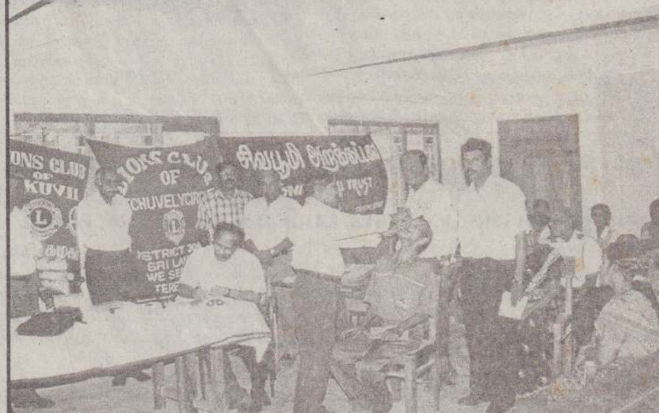
சிவபூமி அறக்கட்டளை நிறுவன அனுசரணையுடன் உரும்பிராய், திருநெல்வேலி வட்டம், அச்சுவேலி வட்டம், கொக்குவில் வயன்ஸ்கழகங்கள் இணைந்து உரும்பிராய் சைவத்தமிழ் வித்தியாலயத்தில் நடத்திய இலவசக் கல்வித் திட்டத்தை முடிவு செய்து எடுக்கப்பட்ட படம். (203)