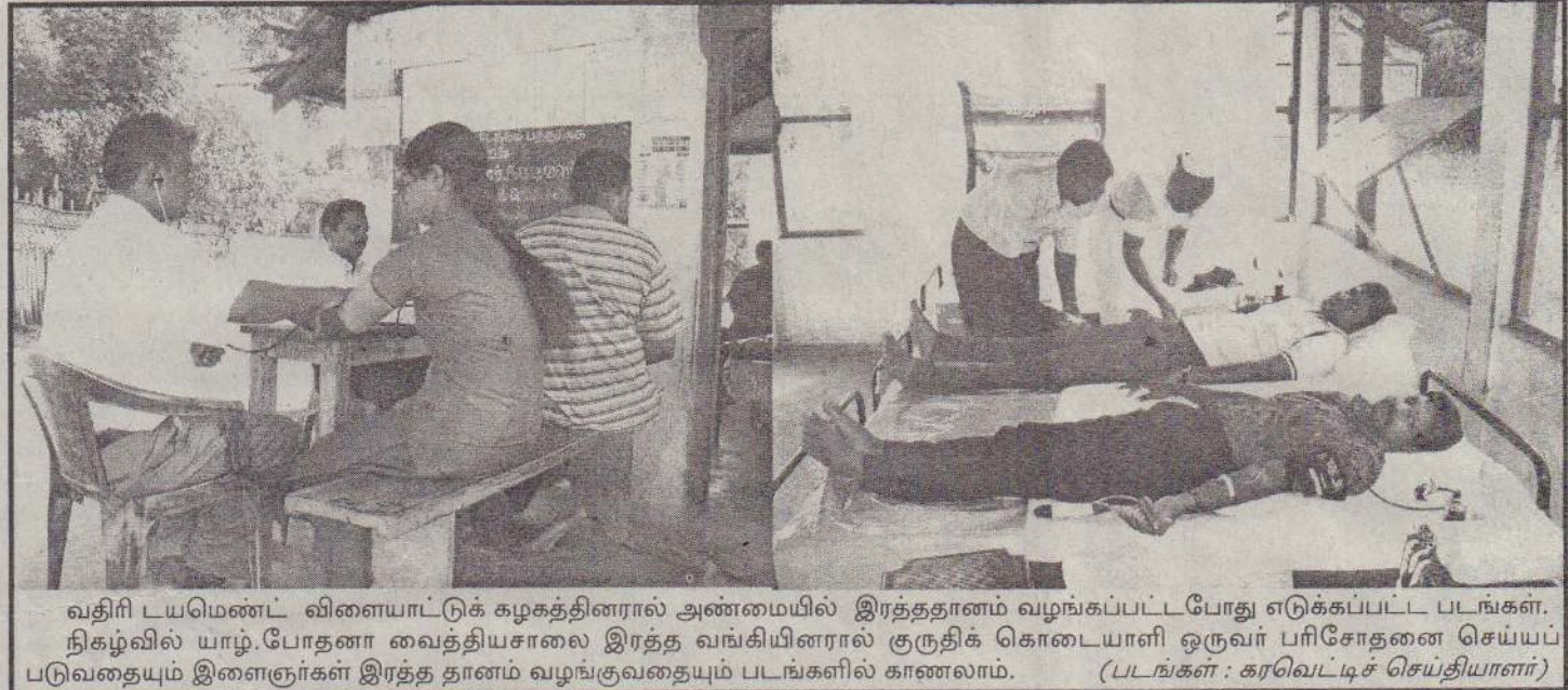
வதிரி டயமெண்ட் விளையாட்டுக் கழகத்தினரால் அண்மையில் இரத்ததானம் வழங்கப்பட்டபோது எடுக்கப்பட்ட படங்கள். நிகழ்வில் யாழ்.போதனா வைத்தியசாலை இரத்த வங்கியினரால் குருதிக்கொடையாளி ஒருவர் பரிசோதனை செய்யப்படுவதையும் இளைஞர்கள் இரத்த தானம் வழங்குவதையும் படங்களில் காணலாம்.