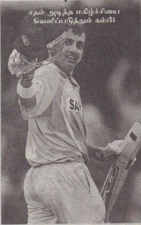
சதம் அடித்த மகிழ்ச்சியை வெளிப்படுத்தும் கம்பீர்

இலங்கை, இந்தியா அணிகளிடையிலான நேற்றைய போட்டியும் கைவிடப்பட்டது