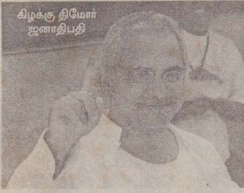
கிழக்கு திமோர் ஜனாதிபதி டிலி, பெப்.12

ரேலிய மருத்துவமனையொன்றில் அனுமதிக்கப்பட்டுள்ளார். இது துப்பாக்கிப் பிரயோக சம்பவத்தை 'அரசுக்கு எதிரான பிசுபிசுத்துவிட்ட புரட்சிச் சதி' என கிழக்குத் திமோர் அதிகாரிகள் குறிப்பிட்டுள்ளார்கள். கிழக்குத் திமோர் தலைநகரான டிலியின் புறநகர்ப் பகுதியிலுள்ள தம் வாசஸ்தல வளவில் ஜனாதிபதி சுடப்பட்டார். வயிற்றில் ஏற்பட்ட காயத்துடன் முதலில் திமோரிலுள்ள ஆஸ்திரேலிய இராணுவ மருத்துவ மனையில் சேர்க்கப்பட்ட அவரின் நிலைமை பின்னர் மோசமடைந்தது. இதையடுத்து அவர் ஆஸ்திரேலிய நகரான டார்வினிலுள்ள மருத்துவமனைக்கு 'கோமாம்' நிலையில் கொண்டு செல்லப்பட்டார் என அதிகாரிகள் குறிப்பிட்டுள்ளார்கள். துப்பாக்கிப் பிரயோகத்தின்போது ஜனாதிபதியின் பாதுகாவலர்கள் பதில் தாக்குதல்களை