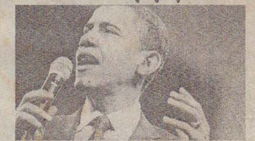
மாநிலத்தில் நடைபெற்ற வாக்கெடுப்பில் ஓபாமா பெரு வெற்றியைப் பெற்றார். இதனையடுத்து ஹிலாரி போட்டியில் பின்தங்கியுள்ளார். இந்த வாக்கெடுப்பில் ஓபாமாவுக்கு 59 சதவீத வாக்குகளும், ஹிலாரிக்கு 40 சதவீத வாக்குகளும் கிடைக்கப்பெற்றன. மைனே மாநிலத்தில் ஓபாமாவுக்கு 15 பிரதிநிதிகளும், ஹிலாரிக்கு 9 பிரதிநிதிகளும் கிடைத்துள்ளனர்.

நியூயோர்க், பெப். 12 அமெரிக்க ஜனாதிபதித் தேர்தல் களத்தில் ஜனநாயகக் கட்சி சார்பில் போட்டியிடுவதற்கான தகுதியைப் பெறுவதற்காக நடைபெற்று வரும் வேட்பாளர் தேர்தலில் பாரக் ஓபாமாவின் வெற்றிநடை தொடர்கிறது. நேற்றுமுன்தினம் மைனே மாநிலத்தில் நடந்த தேர்தலில் ஹிலாரி கிளிண்டரை 19 சதவீத மேல் திக வாக்குகளால் ஓபாமா வெற்றிகொண்டார். அமெரிக்க ஜனாதிபதித் தேர்தலை முன்னிட்டு ஜனநாயகக் கட்சி மற்றும் குடியரசுக் கட்சி வேட்பாளர் வாழ்வுப் பெறுவதற்கான தேர்தல் நடைபெற்று வருகிறது. ஜனநாயகக் கட்சியில் ஹிலாரி கிளிண்டர் மற்றும் பாரக் ஓபாமா இடையே கடும் போட்டி நிலவி வருகிறது. கடந்த சனிக்கிழமை நடைபெற்ற தேர்தலில் வாஷிங்டன் உள்ளிட்ட 3 மாநிலங்களில் ஓபாமா வெற்றிபெற்றார். இந்நிலையில் நேற்றுமுன்தினம் மைனே