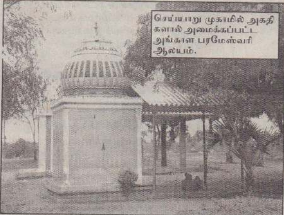
செய்யாறு முகாமில் அகதிகளால் அமைக்கப்பட்ட அங்குள் பரமேஸ்வரி ஆலயம்.

இலங்கையில் இடம்பெறும் போரையடுத்து தற்சமயம் முகாம்களில் கொடுப்புகள் உண்டு. அடிக்கடி சோதனைகள் இடம்பெறும். முகாம்களுக்கு வெளியார் செல்வதில் கட்டுப்பாடுகள் உண்டு. யார் வந்தார்கள், என்ன கதைக்கிறார்கள் என்பதையெல்லாம் நோட்டமிட்டு அதிகாரிகளுக்குக் கூறும் ஆள்கள் இருப்பதால் பெரும்பாலானவர்கள் தமது முகாம்கள் குறித்து வெளியாருடன் கதைப்பதையும் புகைப்படம் எடுப்பதையும் கூடிய அளவு