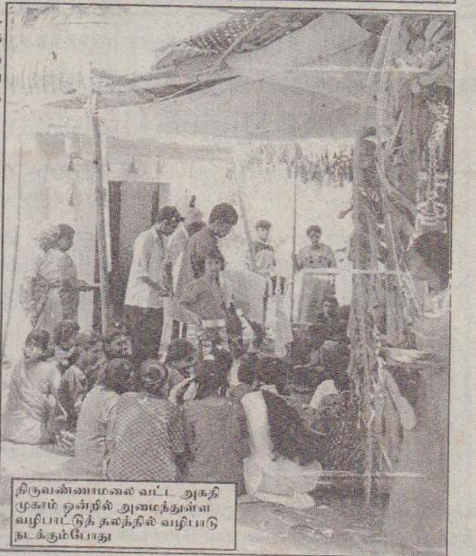
திருவண்ணாமலை வட்ட அகதி முகாம் ஒன்றில் அமைந்துள்ள வழிபாட்டுத் தலத்தில் வழிபாடு நடக்கும்போது

மருத்துவ வசதிகளும் போதியதாக இல்லை. குடி தண்ணீர் மருத்துவம், சுகாதாரம், கல்வி போன்றவற்றைக் கவனிப்பதில் அரசு சார்பற்ற நிறுவனங்கள் பிரசாரம் செய்யும் அளவுக்கு அவர்களின் உதவிகள் கிடைப்பதில்லை என்பதும் அகதிகளின் குறை பாடாகும். அகதிகளின் நலன்களைக் கவனிப்பதற்கென அரசு சார்பற்ற தொண்டு நிறுவனங்கள் ADDRA OFERR,IRSS போன்றவை இயங்கி வருவதாகவும் இவை கல்வி, சுகாதாரம் போன்ற செயற்பாடுகளைக் கவனிப்பதாகவும் எனினும் இந்த அமைப்புகள் தம்மைப் பிரபலப்படுத்தும் அளவுக்கு அமைவாக அகதிகளுக்கு உதவுவதில்லை எனவும் மருத்துவச் செலவு கல்விக்கென கணிசமான பண உதவிகளை வழங்குவதாகச் சொன்னாலும் மிகவும் சொற்ப அளவு கொடுப்பனவுகளையே வழங்கும் போதுள்ளதாகவும் குறித்து