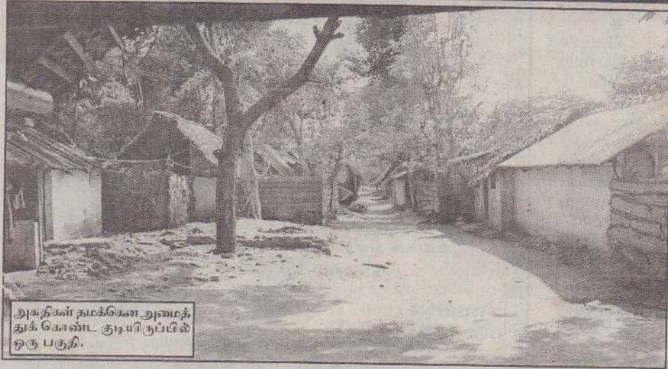
அகதிகள் தமக்கள் அமைத்துக் கொண்ட குடியிருப்பில் இரு பகுதி.

தமிழகத்துக்கு அகதிகளாகச் சென்றுள்ள நம்மக்களில் பலரும் இங்குள்ள முகாம்களில் உள்ள அகதிகளை போன்று கிடைக்கும் நிவாரணத்துடன் காலத்தை ஓட்டாது தமது சுய முயற்சியால் முன்னேறத் துடிப்பவர்களாக காணப்படுகிறார்கள். அரசின் உதவி கணிசமான அளவில் கிடைத்தாலும் காலை 6 மணி முதல் மாலை 6 மணி வரை வெளியிடங்களுக்குச் சென்று தொழில் செய்யக்கூடியதாக அரசு வழங்கியுள்ள சலுகைகளை இலங்கை