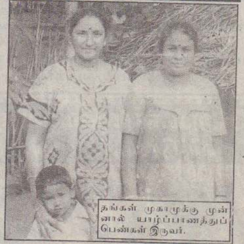
தங்கள் முகாமுக்கு முன்னாக யாற்ப்பணத்துப் பெண்கள் இருவர்.

கல்வி தொழில் அத்தியாவசிய உணவுப் பாவனைப் பொருள்கள் விடயத்தில் அகதி முகாம்களில் தங்கியுள்ளவர்களுக்கு கஷ்டங்கள் இல்லையெனினும் சுகாதாரம், குடிதண்ணீர் வசதிகளில் பிரச்சினைகள் இருக்கத்தான் செய்கின்றன.