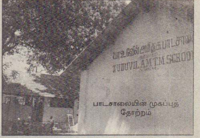
பாடசாலையின் முகப்புத் தோற்றம்

உலக உணவுத்திட்டம் செயற்படுத்தப்பட்டு வருகின்றது. பிள்ளைகள் உணவை உண்பதற்கான பீங்கான்கள் பாடசாலையில் இல்லை. இதனால் புத்தகப் பையில்