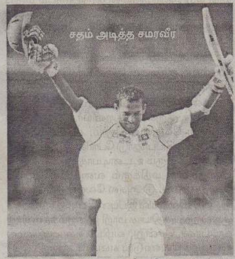
சதம் அடித்த சமரவீரர்

போர்ட் ஓவ் ஸ்பெயின், ஏப்ரல் 07 இலங்கை அணியுடனான இரண்டாவது டெஸ்ட் போட்டியில் மேற்கிந்தியத் தீவுகளின் வெற்றி இலக்காக 253 ஓட்டங்கள் நிர்ணயிக்கப்பட்டுள்ளது. வெற்றியில் கக்கை நோக்கி நேற்றிரவு மேற்கிந்தியத் தீவுகள் அணி துடுப்பெடுத்தாடவிருந்தது. மேற்கிந்தியத் தீவுகளுக்குச் சற்றுப்பயணம் செய்துள்ள இலங்கை அணி, இரண்டு போட்டிகள் கொண்ட டெஸ்ட் தொடரில் விளையாடுகின்றது. தொடரில் முதல் போட்டியில் இலங்கை அணி 121 ஓட்டங்களால் வெற்றிபெற்றிருந்தது. கடைசி மற்றும் இரண்டாவது டெஸ்ட் போட்டி போர்ட் ஓவ் ஸ்பெயினில் நடைபெற்றுவருகின்றது. இந்தப் போட்டியின் முதல் இன்னிங்ஸில் இலங்கை அணி 278 ஓட்டங்களையும், மேற்கிந்தியத் தீவுகள் அணி 294 ஓட்டங்களை யும் பெற்றிருந்தன. நேற்றுமுன்தினம் நடைபெற்ற மூன்றாம் நாள் ஆட்டத்தில் 16 ஓட்டங்கள் பின்தங்கிய நிலையில் இலங்கை அணி இரண்டாம் இன்னிங்ஸை ஆடியது. ஆரம்பத்திலேயே ரெய்லரின் வேகம் மிரட்ட வர்ணபுர ஓட்ட