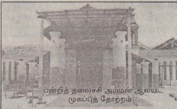
பன்றித் தலைச்சி அம்மன் ஆலய முகப்புத் தோற்றம்

அதிகாலை முதல் பிற்பகல் வரையில் கத்தரிக்காய் சேர்த்த பொங்கல் உண்டாகும், வடை என்பன அவித்து உண்டாகும் தித்தல் அவற்றை ஆலய முகப்பில் அடியார்களுக்கு நிவேதித்து ஆலய சூழலில் உள்ள அடியார்களுக்கு வழங்கி அம்பாளின்