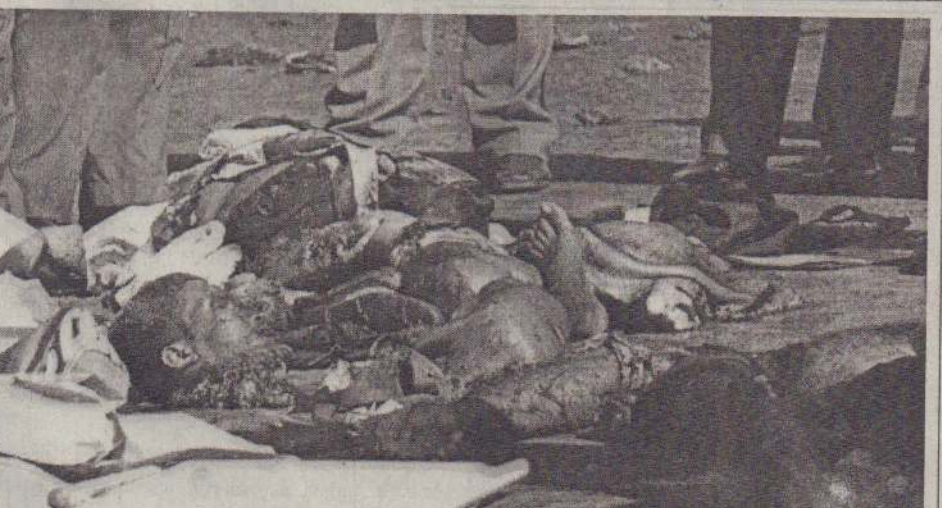
குண்டுவெடிப்பில் கொலையுண்டவர்களின் சடலங்களின் எச்சங்கள் குவியலாக காணப்படுகின்றன.

துள்ள ஜனாதிபதி மஹிந்த ராஜபக்ஷ மக்களைப் பொறுமை காக்கும்படி வேண்டுகோள் விடுத்துள்ளார். இப்படுகொலை பயங்கரவாதத்தைத் தோற்கடிக்கும் அரசினது (12 ஆம் பக்கம் பார்க்க)