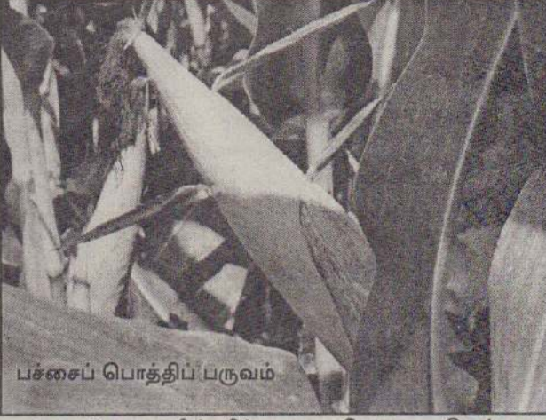
பச்சைப் பொத்திப் பருவம்

அண்மையில் நடந்த மட்டுவில் அம்மன் ஆலயத் திருவிழாவின் போது அந்த ஆலயச் சூழலில் அவித்த சோளப் பொத்தி