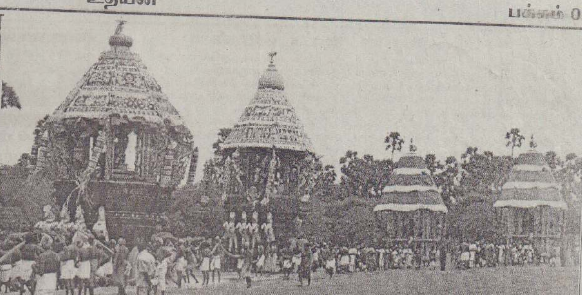
காரைநகர் ஈழத்துச் சிதம்பரத்தில் கடந்த பங்குனி உத்தர திவத்தன்று நடைபெற்ற தேர்த்திருவிழாவின் போது எடுக்கப்பட்ட படங்கள். பஞ்சமூர்த்திகள் தேருக்கு எழுந்தருளுவதை முதலாவது படத்திலும் தேர்கள் பவனி வருவதை அடுத்ததுள்ள படத்திலும் காணலாம். (250)