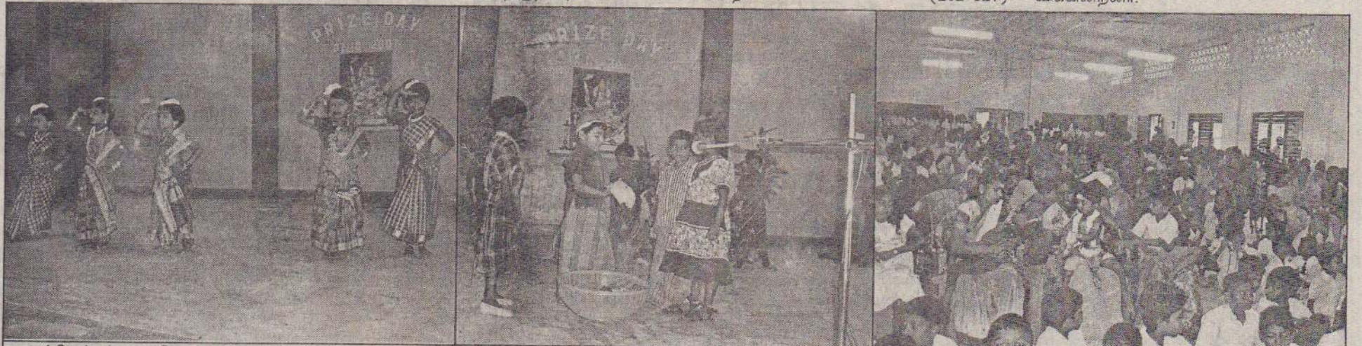
வல்வெட்டித்துறை கொத்தணி முன்பள்ளிகளின் கலைத்திறன் காணவிழா கடந்த 9ஆம் திகதி தொண்டைமானாறு வீரகத்திப்பிள்ளை மகா வித்தியாலயத்தில் நடைபெற்றது. நிகழ்வில் முன்பள்ளி மாணவர்களின் கலை நிகழ்வுகளான கிராமிய நடனம், தொப்பி விழாபாரி நாடகம் ஆகியவற்றை முதலிரு படங்களிலும் காணலாம். நிகழ்வில் கலந்து கொண்ட முன்பள்ளி ஆசிரியர்களையும் மாணவர்களையும் மூன்றாவது படத்தில் காணலாம்.

மாணவர்கள் தமது கல்வியை தமிழ் மொழியிலே கற்றுக் கொள்ள வேண்டும். தாய்மொழியில் கற்கும் போது அதிக விளக்கமும் உரிய கற்றல் பேறும் ஏற்பட முடியும். எனினும் ஏனைய மொழிகளைக் கற்றல் வேண்டும். இன்றைய உலகில் பல்வேறு தொடர்புகள் அறிவியல் தேட்டங்களுக்கு வெளிநாட்டு மொழி அறிவு அவசியமாகும். இதனால் எமது மாணவர் தமிழ் மொழியையும், ஆங்கிலம் போன்ற பிற மொழியையும் கற்க வேண்டும் - என்றார். (202-127)