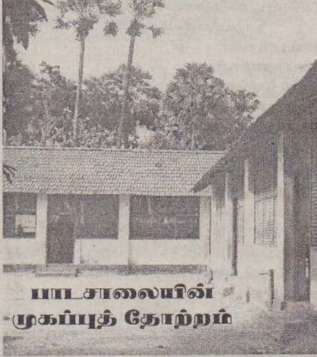
பாடசாலையின் முகப்புத் தோற்றம்

அளவெட்டி வடக்கு அமெரிக்கன் மிஷன் பாடசாலை 1834 ஆம் ஆண்டு ஆரம்பிக்கப்பட்ட பாடசாலையாகும். பாடசாலை ஆரம்பிக்கப்பட்ட காலத்தில் 57 ஆண்பிள்ளைகளும் 56 பெண்பிள்ளைகளும் கல்வி கற்றதை பாடசாலையின் ஏடுகளின் மூலம் அறியக்கூடியதாக இருக்கிறது.