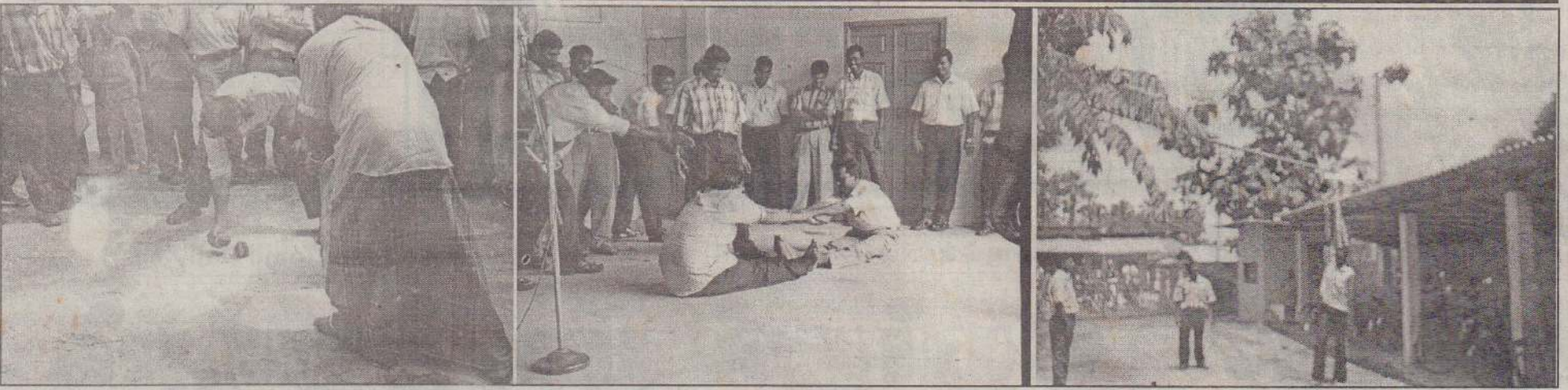
தெல்லிப்பழைப் பிரதேச செயலர் பகுதியில் ஏற்பாடு செய்யப்பட்ட வசந்த விழாவில் பாரம்பரிய விளையாட்டுப் போட்டிகள் இடம்பெற்றன. போர்த்தேங்காய் உடைத்தல் வலுப்போட்டி மற்றும் தயிர் முட்டி உடைத்தல் ஆகியன இடம்பெற்றபோது எடுக்கப்பட்ட படங்கள்.