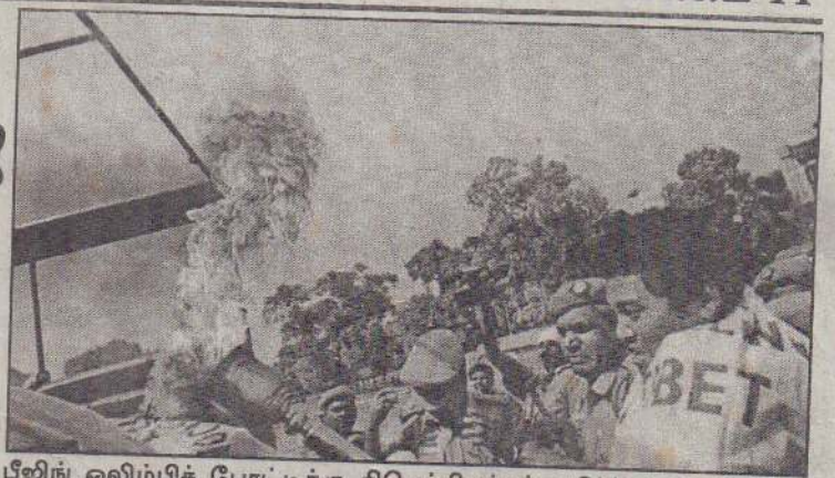
பீஜிங் ஒலிம்பிக் போட்டிக்கு திபெத்தியர்கள் எதிர்ப்புத் தெரிவித்து வருகின்றனர். டில்லியில் போலியான ஒலிம்பிக் ஜோதியை ஏந்தி அவர்கள் ஆர்ப்பாட்டம் நடத்துவதையும், பொலிஸார் தடுக்க முற்படுவதையும் படத்தில் காணலாம்.

இந்த சம்பவத்துக்கு பிறகு ஒலிம்பிக் ஒட்டம் நடக்கும் பாதையில் அதிகமான பொலிஸார் பாதுகாப்புப் பணியில் ஈடுபடுத்தப்பட்டுள்ளனர் எனத் தெரிவிக்கப்படுகிறது.