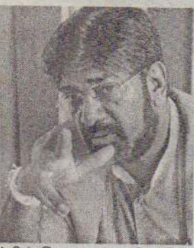
ஒப்பீட்டு நோக்கில் இதனைப் பாரிய பின்னடைவாகவோ அல்லது தோல்வியாகவோ காட்ட முனைந்தால் அதனை நான் ஏற்றுக்கொள்ள மாட்டேன். (12ஆம் பக்கம் பார்க்க)

கொழும்பு, ஏப்ரல் 25 முகமாலை, கிளாலி, கண்டல் பகுதிகளில் நேற்றுமுன்தினம் புதன்கிழமை இராணுவத்தினருக்கும் விடுதலைப் புலிகளுக்கும்மிடையில் நடைபெற்ற பெரும் சமரில், படைத் தரப்புக்கு இழப்புகள் ஏற்பட்டபோதிலும் படை நடவடிக்கைகள் தொடரும். வழமையாக நடைபெறுவது போன்று, இராணுவம் தனது படையினரின் செயற்பாடுகளை மதிப்பீடு செய்யும். தேவைப்பட்டால் அவர்களுக்குத் தண்டனை கூட வழங்கப்படலாம். - இவ்வாறு தெரிவித்திருக்கிறார் பாதுகாப்பு விவகாரங்களுக்கான பேச்சாளரும் அமைச்சருமான கெஹலிய ரம்புக்கவெல. தேசிய ஊடக மத்திய நிலையத்தில் நேற்று நடைபெற்ற செய்தியாளர் மாநாட்டிலேயே அமைச்சர் இவ்வாறு கூறினார். அவர் நேற்றைய செய்தியாளர் சந்திப்பில் மேலும் கூறியவை வருமாறு:-