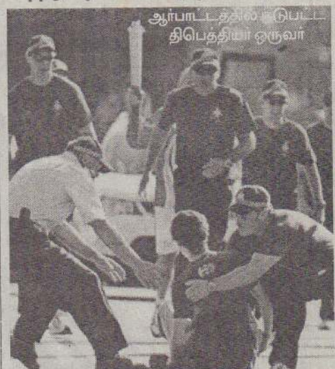
ஆர்பாட்டத்தில் ஓட்டம் திபெத்தியர் ஒருவர்

கான்பெரா, ஏப்.25 ஆஸ்திரேலியாவில் ஒலிம்பிக் ஜோதி தொடர் ஓட்டம் நேற்றுக் காலை அமைதியான முறையில் நடைபெற்றது. எனினும் ஒலிம்பிக் ஜோதிக்கு எதிராக ஆர்ப்பாட்டத்தில் ஈடுபட்ட திபெத்தியர்களை ஆஸ்திரேலியப் பொலிஸார் கைது செய்தனர்.