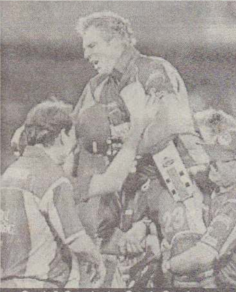
வெற்றி தேடித்தந்த ஷேன் வோர்னை பாராட்டும் சக வீரர்கள்

இதனால் கடைசி ஓவரில் 17 ஓட்டங்கள் எடுக்க வேண்டிய கட்டாயத்துக்கு ராஜஸ்தான் ரோயல்ஸ் தள்ளப்பட்டுள்ளது. இறுதியில் அந்த ஓவரை வீழ்த்திய ராஜஸ்தான் அணித்தலைவர் வோர்ன் வரிசையாக ஒரு