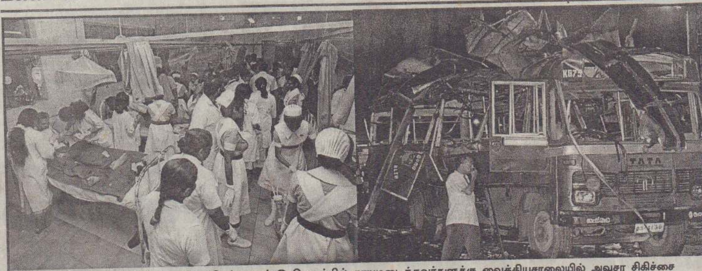
பிலியந்தளாவையில் நேற்று இடம்பெற்ற குண்டு வெடிப்பில் காயமடைந்தவர்களுக்கு வைத்தியசாலையில் அவசர சிகிச்சை வழங்கப்படுவதையும் சேதமடைந்த பஸ்ஸையும் படங்களில் காணலாம்