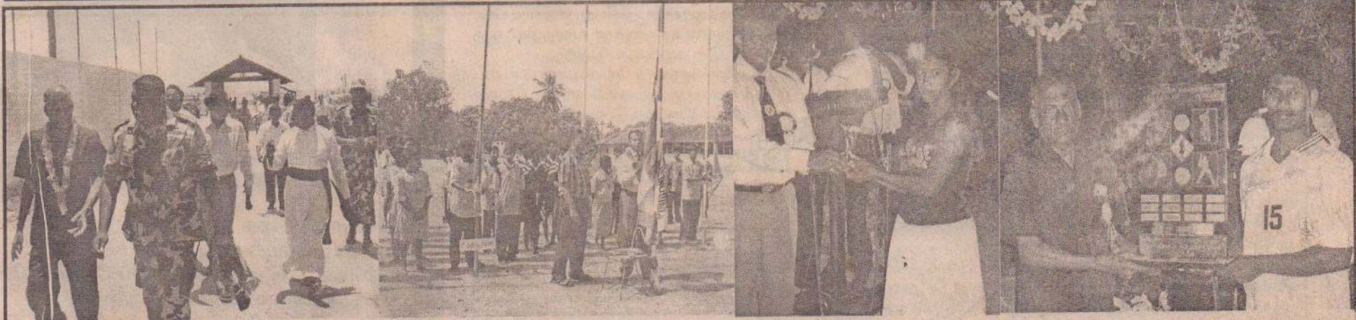
நெடுந்தீவு உதவி அரசாங்க அதிபர் பிரிவில் பதிவு செய்யப்பட்ட விளையாட்டுக் கழகங்களுக்கிடையிலான மெய்வன்மைப்போட்டிகளின் போது எடுக்கப்பட்ட படங்கள். நிகழ்வின் விருந்தினராக யாழ்.அரச அதிபர் கே.சுணேஷ், நெடுந்தீவுத் துறைமுகத்தில் கடற்படை அதிகாரிகளால் வரவேற்று அழைத்துச் செல்வதை முதலாவது படத்தில் காணலாம். நெடுந்தீவு உதவி அரசாங்க அதிபர் என். திருவிங்கநாதன் கொடியேற்றி போட்டிகளைத் தொடர்க்கிவையும் அதை இரண்டாவது படத்திலும் நெடுந்தீவு உதவி அரசாங்க அதிபர், யாழ். அரச அதிபர் ஆகியோர் போட்டியில் வெற்றிபெற்றவர்களுக்கு பரிசீலனை வழங்குவதை மூன்றாம் நான்காம் படங்களிலும் காணலாம்.

'உதயன்' ஊடக அனுசரணையுடன் போட்டிகள் இடம்பெறவுள்ளன. எதிர்வரும் 19 ஆம் 20 ஆம் திகதிகளில் காலை 8.30 மணிக்கு யாழ்.இந்துக் கல்லூரி குமாரசுவாமி மண்டபத்தில் போட்டிகள் நடைபெறவுள்ளன. மாவட்ட மட்டத்தில் இடம்பெறவுள்ள இப்போட்டியில் அனைத்துக் கழகங்களும் பங்குபற்றி போட்டியிட முடியுமென்று கூறப்பட்டுள்ளது. (203)