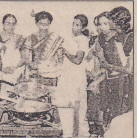
மரவள்ளிக்கிழங்கில் இருந்து நஞ்சற்ற முறையில் உற்பத்தி செய்யப்படும் உணவுப் பண்டங்கள் ஆய்வுசெய்தில் செய்யப்படுகின்றன

கள் மூலம் தயாரித்தும் காட்டப்பட்டன. இறுதிநாள் பயிற்சியின்போது உற்பத்தி செய்யப்பட்ட பொருள்கள் பொதி செய்யும் முறை பற்றியும் அவற்றிற்கு சுட்டுத் துண்டு இடும்போது பின்பற்ற வேண்டிய ஒழுங்கு விதிகள் பற்றியும் விரிவுரை மூலம் விளக்கம் அளிக்கப்பட்டது. அதன்பின் உணவு உற்பத்தியின்போது தவறான கையாள்கையால் ஏற்படும் பாதுகாமான விளைவுகள், அவற்றை தவிர்ந்து சுகாதாரத்துடன் எவ்வாறு உணவு உற்பத்தி மேற்கொள்ளப்பட வேண்டும் என்பதை விளக்கும் படக்காட்சி காட்டப்பட்டது. இறுதியில் மா.கி.அ. சங்கங்கள் பயிற்சியில் கற்றவற்றைக் கொண்டு தாம் செய்யவிருக்கும் உற்பத்தி