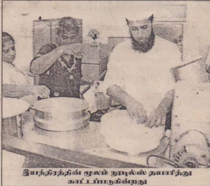
இயந்திரத்தின் மூலம் நூட்டில்ஸ் தயாரித்து காட்டப்படுகின்றது

திட்டமிடுவதற்கு தலைப்புகள் ஒவ்வொரு குழுவாலும் சமர்ப்பிக்கப்பட்டு திட்டமிடல் மேற்கொள்ளப்பட்டது. நான்காம் நாள் பயிற்சியின்போது குழுத் தைகளின் உணவுகளில் காணப்பட வேண்டிய முக்கிய போசணைப் பொருள்கள், குழுத்தைகளுக்கான சத்துமா, ஜீவாகாரம் தயாரிப்பு முறை என்பன விரிவுரை மூலமும் செயல்முறை மூலமும் விளக்கமளிக்கப்பட்டன. உடனடி இடியப்பமா தயாரிப்பு, அதற்கான இயந்திரங்களைக் கையாள்தல் பற்றிய விரிவுரையும் அன்று இடம்பெற்றது. இயந்திரங்களை உபயோகித்து எக்ஸ்த்ரூசன் சமைத்தல் முறையில் நூட்டில்ஸ், பஸ்ரா, ரிப்பி ரிப், சினகஸ், குழுத்தை உணவுகள் தயாரிக்கும் முறை பற்றிய விரிவுரை அளிக்கப்பட்டதோடு நூட்டில்ஸ், திரிபோசா என்பன இயந்திரங்