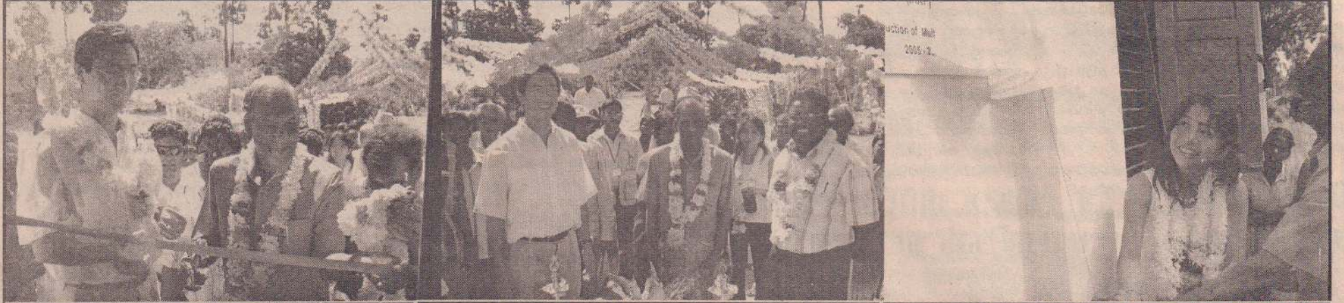
வேலனை சேட்டிப்புலம் பகுதியில் நிர்மாணிக்கப்பட்ட வீடுகளை அரசு அதிபரும் யு.என்.டி.பி. பிரதிநிதியும் திறந்து வைக்கும்போது....