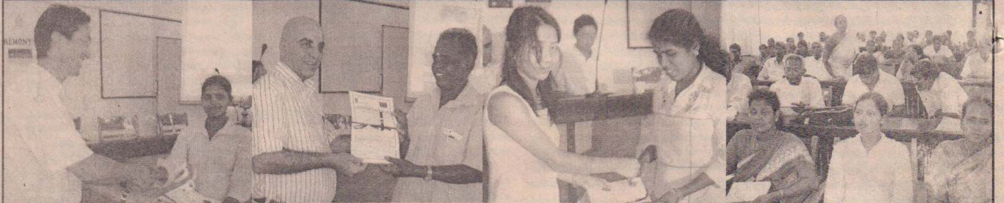
யாழ். செயலகத்தில் நடைபெற்ற நிகழ்வில் என்.டி.பி பிரதிநிதி திட்டத்திற்கான சான்றிதழைக் கையளிக்கின்றார்....