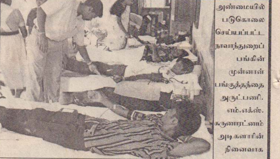
இரத்ததான நிகழ்வு நடத்தப்பட்டது. அந்நிகழ்வில் எடுக்கப்பட்ட படம். (202)