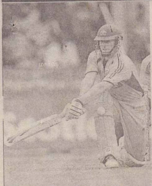
கிங்ஸ்ரவுண், ஜூன் 26

புதுமுக வீரரான ஷோன் மார்ஷ் சிறப்பாக ஆடி 81 ஓட்டங்களைப் பெற்றுக்கொடுக்க, மேற்கிந்தியத் தீவுகளுக்கு எதிரான முதலாவது ஒரு நாள் போட்டியில் ஆஸ்திரேலிய அணி 84 ஓட்டங்கள் வித்தியாசத்தில் வெற்றியைப் பதிவு செய்தது.