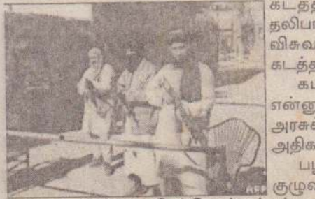
முண்டது. இதில் 12 பேர் கொல்லப்பட்டனர்.

அதிகாரிகள் சடலங்களைக் கண்டு, அடையாளங்களை உத்தரவாதப் படுத்தினார்கள். இராணுவம் பதில் நடவடிக்கைகளை எடுக்கக் கூடும் என்ற அச்சத்தில் தற்போது, போராளிகள் நகரங்களை வெளியேற்றிவிட்டார்கள் என்றும் அவர் குறிப்பிட்டார்.