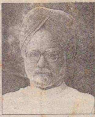
காப்பு நடவடிக்கைகளுக்காகக் கொழும்புக்கு அழைக்கப்பட வேண்டிய இந்தியப் (12 ஆம் பக்கம் பார்க்க)

கொழும்பு, ஜூன் 26 'சார்க்' உச்சிமாநாட்டில் பங்குபற்றுவதற்காக அடுத்த மாத இறுதியில் கொழும்புக்கு இந்தியப் பிரதமர் மன்மோகன்சிங் வருகை தரும்போது அவருக்கான பாதுகாப்பையும், அவர் பங்குபற்றும் நிகழ்வுகளுக்கான பாதுகாப்பையும் நேரடியாக இந்தியப் படைகளே கொழும்பில் பிரசன்ன மாசி வழங்கும் எனத் தெரிகின்றது.