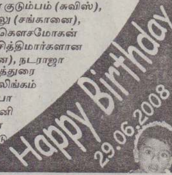
பிளாக் வீதி சங்கானை.