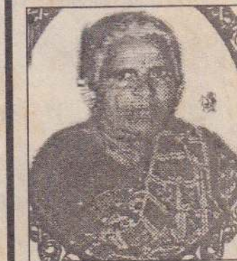
செட்டிவளவு, தலைநகரம் (5-55557)