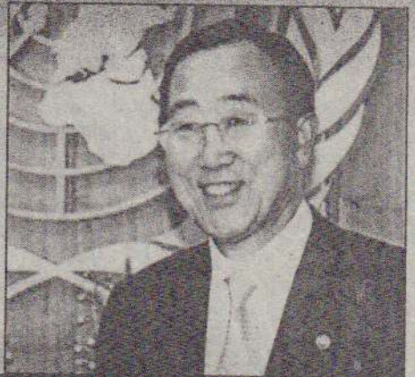
சொல்பவர் செயலாளர் நாயகம் யான்கி - மூன்

18 நாடுகளின் ஐ.நா.அமைதி காப்பாளர் பேச்சுகளில் தான் ஈடுபட்டு வருகின்