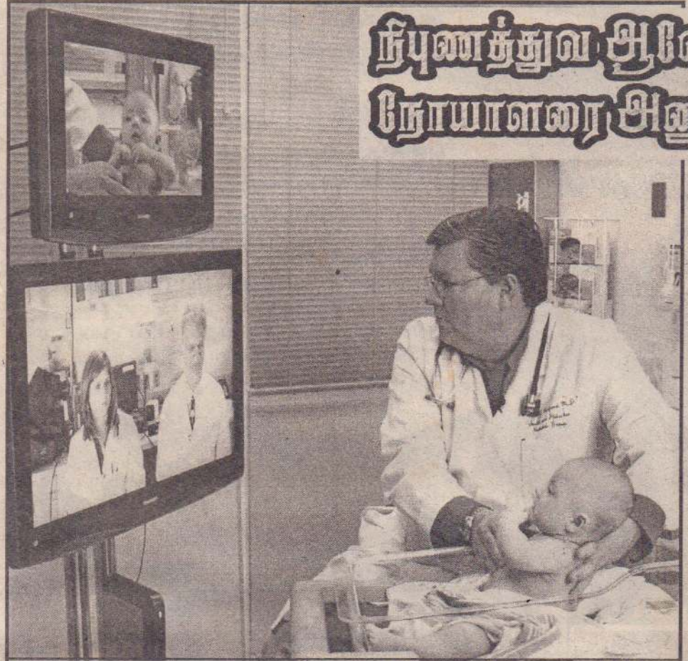
வைத்திய நிபுணர் ஒருவர் குழந்தை ஒன்றுக்கு 'ரெலிமெடிசின்' முறை மூலம் சிகிச்சைக்குரிய ஆலோசனையைப் பெறுகிறார். தொலைக்காட்சித் திரையில் குழந்தையைத் தொலைவில் உள்ள இரண்டு வைத்திய நிபுணர்களுக்குக் காண்பிக்கும் அதேவேளை, மற்றொரு தொலைக் காட்சித் திரைமூலம் அவர்களிடம் இருந்து சிகிச்சைக்குரிய நிபுணத்துவ ஆலோசனையைக் கேட்கிறார்.

போதனைக்கும் இந்தச் சேவையில் வழிவகைகள் செய்யப்பட்டிருக்கின்றன. வைத்திய கருத்துப் பரிமாற்றங்களுக்கான தளம் இது ஒரு கருத்துப்பரிமாறல்களுக்கான தளமேயன்றி ஒரு சிகிச்சை முறையல்ல. உதாரணமாக ஒருவருக்கு மூளையில் ஓர் கட்டி ஏற்பட்டிருப்பின் அவருக்கு உடனடியாகச் சத்திரசிகிச்சை தேவையா? அதன் போது ஏற்படக்கூடிய பாதிப்பு வீதம் என்ன? சத்திரசிகிச்சை பிற்போடப்பட்டால் ஏற்படக்கூடிய தாக்கங்கள் போன்றவை சம்பந்தமான கருத்துக்களை நாம் இதன் மூலம்