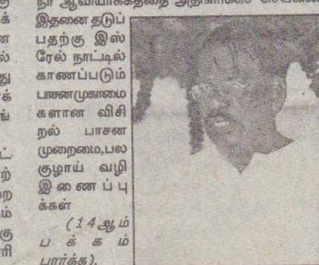
(14 ஆம் பக்கம் பார்க்க).

* யாழ்ப்பாணப் பகுதிகளில் நீரிறைப்பு, இயந்திரமயப்படுத்தப்பட்ட பின்னர் பணிகளுக்கு மித மிஞ்சிய நீர் பாய்ச்சப்படுவதாகக் கருதப்படுகின்றது. உவர்தீராதல் பிரச்சினைக்கு இதுவும் ஒரு காரணமாகும். உண்மையில் இன்ன பயிருக்கு இன்ன பிரதேசத்தில் இன்ன காலத்திற்கு இவ்வளவு நீர் தேவை என்பதை விவசாயிகளுக்கு நல்ல முறையில் அறிவுறுத்தல் வேண்டும். மேலும் இங்கு காணப்படும் பாசன முறையை நீர் ஆவியாக்கத்தை அதிகரிக்கச் செய்கின்றது.