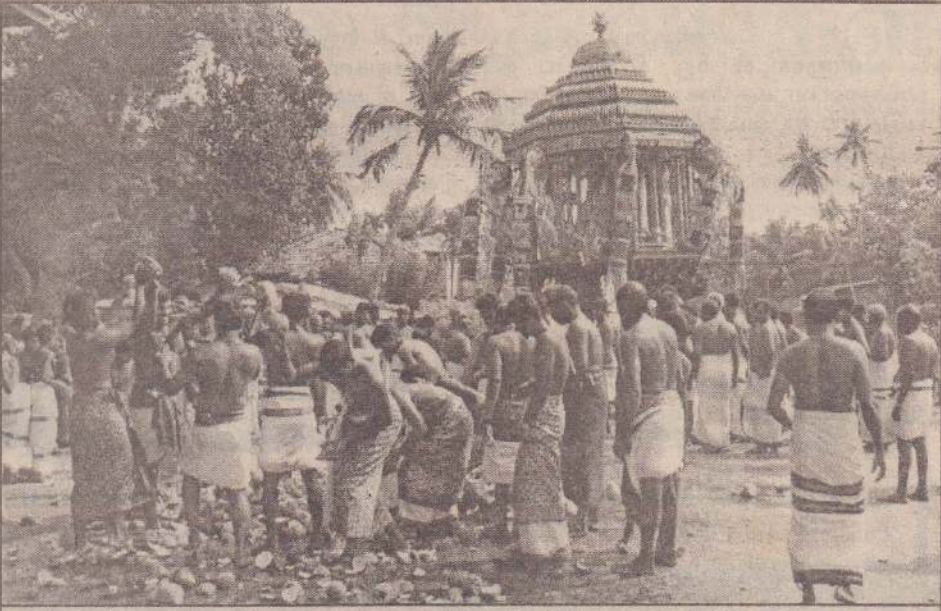
கோண்டாவில் மேற்கு உப்புமடம்சந்தி பிள்ளையார் கோயில் வருடாந்தத் தேர்த்திருவிழாவின் போது எடுக்கப்பட்ட படம். அடியார்கள் தேங்காய் உடைத்து நேர்த்தியை நிறைவேற்றுவதையும் வடம் இழுத்துவரப்படும் தேரையும் படத்தில் காணலாம். (86)