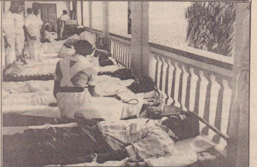
யாழ்.புனித பத்திரிசியார் கல்லூரி இன்றாகட்ட கழகத்தின் ஏற்பாட்டில் அண்மையில் கல்லூரியில் இரத்ததான நிகழ்வு நடத்தப்பட்டது. மாணவர்களும் ஆசிரியர்களும் இரத்ததானம் செய்வதைப் படத்தில் காணலாம்.