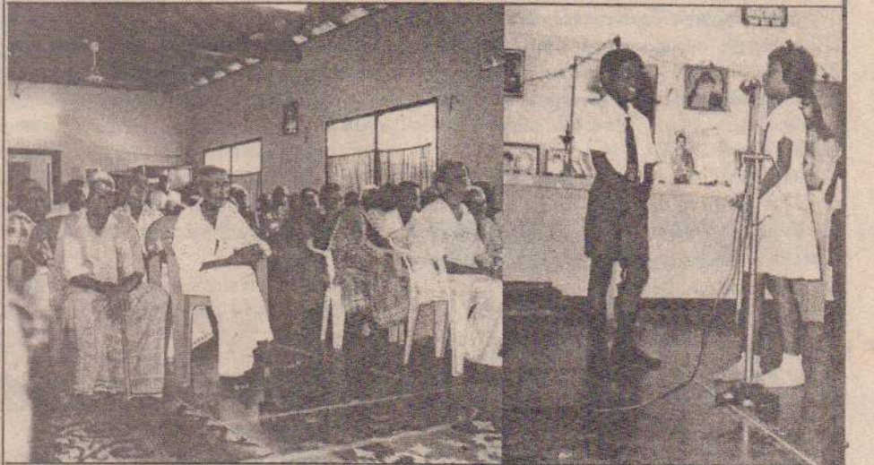
மட்டுவில் கமலாசனி வித்தியாலய மாணவர்களின் கலை நிகழ்ச்சிகள் அண்மையில் கைதடி முதியோர் இல்லத்தில் இடம்பெற்றன. ஆரம்பப் பிரிவு மாணவர்களின் கலைநிகழ்வுகளை முதியோர்கள் ரசிப்பதைப் படங்களில் காணலாம்.