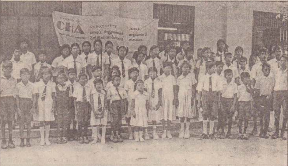
யாழ்.கல்வி வலயத்திற்குட்பட்ட பாடசாலைகளில் கல்வி கற்கும் மாணவர்களில் பார்வைக் குறைபாடுள்ள 50 மாணவர்களுக்கு அண்மையில் மூக்குக் கண்ணாடிகள் வழங்கப்பட்டன. மனித நேய கூட்டமைப்பினரின் அனுசரணையுடன் வழங்கப்பட்ட கண்ணாடிகளைப் பெற்றுக் கொண்ட மாணவர்களைப் படத்தில் காணலாம். (302)