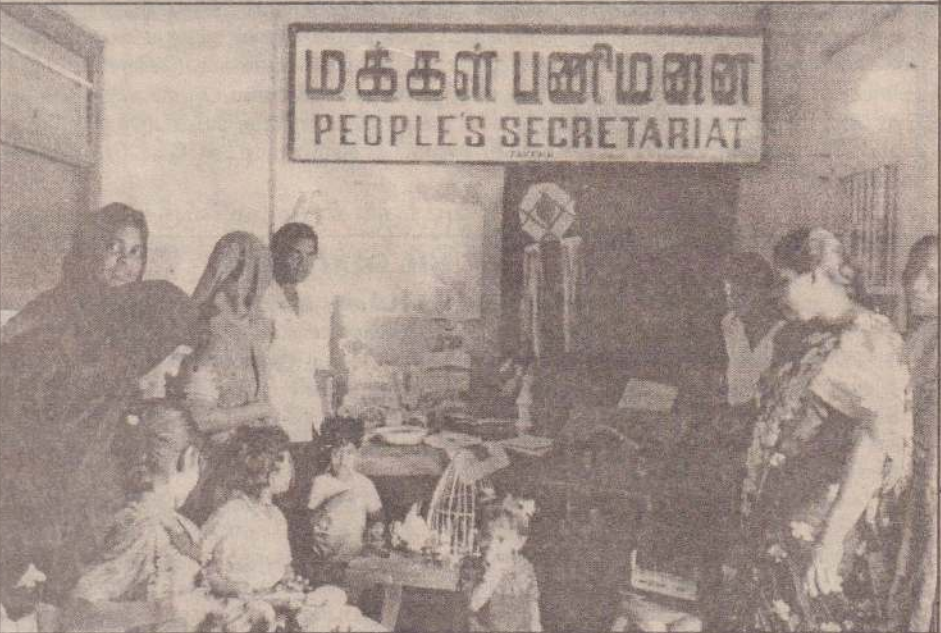
சோனகதெரு வடக்கு (யாழ்ப்பாணம்) கிராம சேவையாளர் பிரிவிலுள்ள "இக்ரஃ" முன்பள்ளிப் பிள்ளைகளின் ஆக்கத்திறன் கண்காட்சி "மக்கள் பணிமனை"யின் அனுசரணையுடன் இந்த அலுவலகத்தில் அண்மையில் நடைபெற்றது. கண்காட்சியில் எடுக்கப்பட்ட படம் இது.