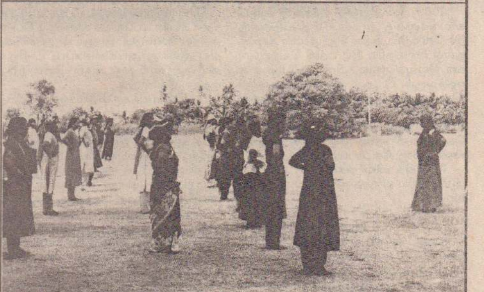
வடமராட்சி வலயக் கல்வி அலுவலகம், வடமராட்சி முன்பள்ளி ஆசிரியர்களுக்கு நடத்திய காலை உடற் பயிற்சியில் முன்பள்ளி ஆசிரியர்கள் ஈடுபட்டிருப்பதைப் படத்தில் காணலாம். (218)