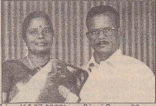
இன்று (13.07.2008) ஞாயிற்றுக்கிழமை 60ஆவது பிறந்தநாளையும், 30ஆவது திருமண ஆண்டு நிறைவையும் கொண்டாடும்