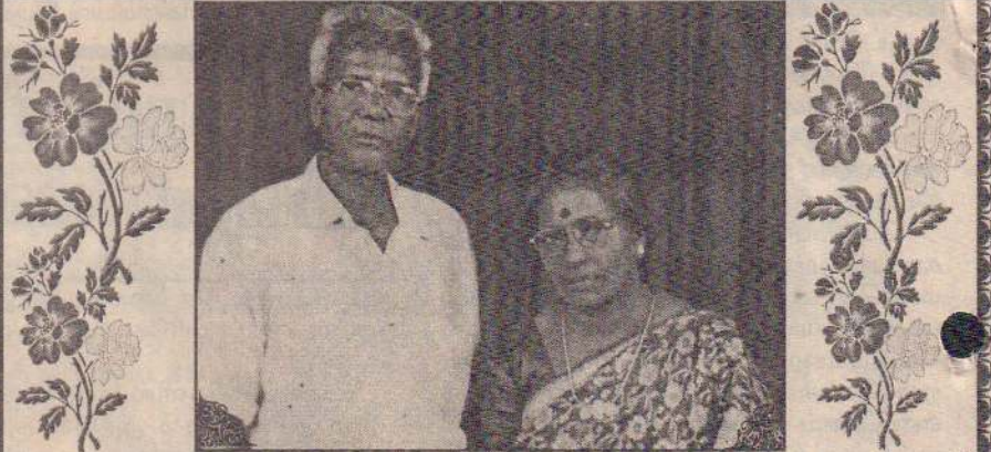
மட்டுவில் தெற்கு, வளர்மதி வீதி, சாவகச்சேரியைச் சேர்ந்த