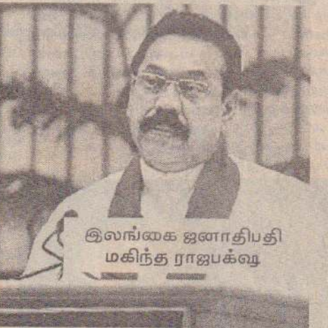
இலங்கை ஜனாதிபதி மகிந்த ராஜபக்ஷ

இந்த 'கண்டுபிடிப்பை', விடுதலைப் புலிகளுடன் செய்துகொண்ட யுத்த நிறுத்த ஒப்பந்தத்திலிருந்து சிறிலங்கா அரசு வெளியேறும்போது ஏன் கூறவில்லை? இந்த முரண்பட்ட வெளியுறவுப்போக்குத்தான் இன்று இந்தியாவை சூழ எல்லா நாடுகளையும் அதற்கு எதிரிகளாக்கி வைத்திருக்கிறது. பாகிஸ்தான், வங்காளதேசம்