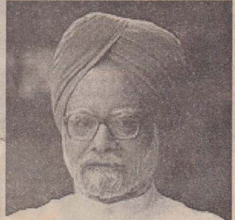
இந்தியப் பிரதமர் மன்மோகன்சிங்

ஈழ விடுதலைப் போராட்டத்தை தனது அரசியல், இராணுவ, பிராந்திய நலன்களின் முன்வைத்து கபடி விளையாடும் இந்தியாவின் தொடர்ச்சியான ஆட்டத்தின் பிந்தைய நிலவரம் தான் கடந்த மாதம் மூன்றாவது வாரத்தில் கொழும்பு வந்து சென்ற அந்நாட்டு உயர் மட்டக்குழுவின்