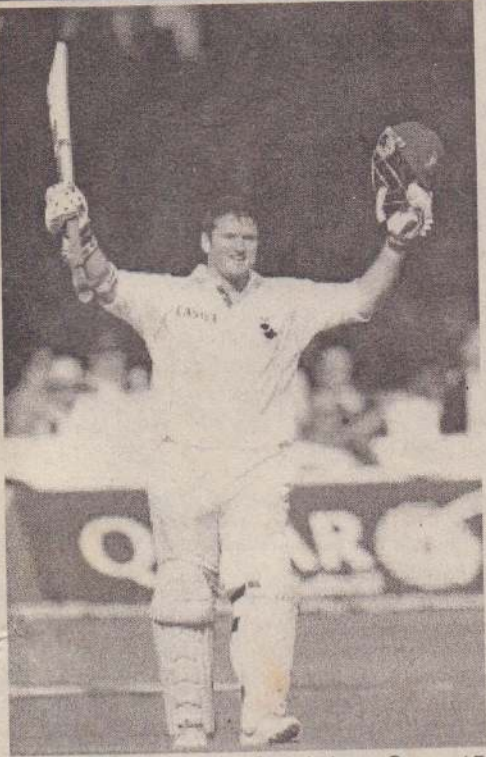
லோட்ஸ், ஜூலை 15

லோட்ஸ் டெஸ்ட் போட்டியில் 'பலோ-ஓன்' பெற்ற தென்னாபிரிக்க அணி இரண்டாம் இன்னிங்ஸில் உறுதியான தொடக்கத்தைப் பெற்றுள்ளது. நேற்றுமுன்தினம் நிறைவுபெற்ற நான்காம் நாள் ஆட்டத்தில் தென்னாபிரிக்கா அணி தனது இரண்டாம் இன்னிங்ஸில் ஒரு விக் கெட் இழப்புக்கு 242 ஓட்டங்களைப் பெற்றிருந்தது.