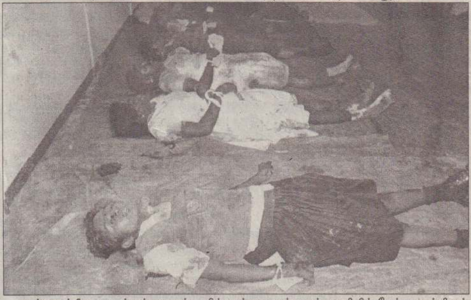
முல்லைத்தீவு மாவட்டம் துணைக்காயில் உள்ள ஐயங்குளம் பகுதியில் நேற்று முன்தினம் இராணுவத்தின் ஆழ ஊடுருவும் அணியினர் நடத்திய கிளைமோர் தாக்குதலில் கொல்லப்பட்ட பாடசாலைச் சிறியிகளில் சிலர்.

யாழ்ப்பாணம், நவ.29 யாழ்.மாவட்ட கூடைப்பந்தாட்ட சம்மேளனத்தினால் நடத்தப்படும் கூடைப்பந்தாட்டப் போட்டியில் இன்று வியாழக்கிழமை நடைபெறவுள்ள ஆண் அணிகளுக்கான ஆட்டங்களின் விவரம் வருமாறு: *கோப்பாய் வி.க. எதிர் பற்றிசியன் வி.க. *ஜொலிஸ்ரார் வி.க. எதிர் சென்றலைட்ஸ் சொக்ஸ் வி.க. (50)