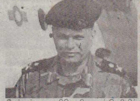
மேற்கண்ட உறுதிமொழிகளைத் தெரிவித்தார். யாழ். அரசு அதிபர் கே.கணேஷ், யாழ். மாவட்ட நீதிபதி இ.த.விக்கிரமராஜா, யாழ். ஆயர் அதிவண தோமஸ் செளந்தரநாயகம், மக்கள் குழுவின் பிரதிநிதி எஸ். பரமநாதன், செஞ்சிலுவைச் சாவதேசக் குழுவின் பிரதி (12 ஆம் பக்கம் பார்க்க)

யாழ்ப்பாணம், டிசெம்பர் 24 குடாநாட்டில் - பலாலி, பருத்தித்துறை, தென்மராட்சி ஆகிய பிரதான பாதைகளில் - படையினரின் தொடரணிகள் ஒழுங்கு முறையின்றிச் செல்வதால் மக்களுக்கு உண்டாகும் பாதிப்புகள் அடுத்த மாதத்தில் நீக்கப்படும் என்று வாக்குறுதி அளிக்கப்பட்டுள்ளது. வெளிமாவட்டப் பயணத்துக்குப் பாதுகாப்பு அனுமதி பெறுவதில் உள்ள தாமதங்களையும் கஷ்டங்களையும் நீக்குவதற்கும் ஏற்பாடு செய்யப்படும். பலாலியில் நேற்று நடைபெற்ற சந்திப்பு ஒன்றின்போது, யாழ். கட்டளைத் தளபதி மேஜர் ஜெனரல் ஜி.ஏ.சந்திரசிரி இந்த வாக்குறுதிகளை அளித்தார். பலாலி படைத் தலைமையகத்தில் நேற்று நடைபெற்ற சந்திப்பில் கலந்து கொண்ட மக்கள் பிரதிநிதிகள் மற்றும் அரசாங்க உயர் அதிகாரிகள் குடாநாட்டில் மக்கள் எதிர்நோக்கும் பல்வேறுபட்ட பிரச்சினைகளை தளபதிக்கு எடுத்துக் கூறி அவற்றைத் தீர்க்க வேண்டும் என்று கேட்டுக்கொண்டனர்; அப்போது அவர்