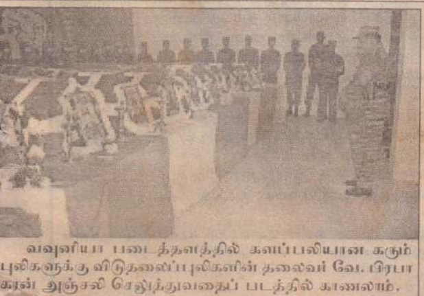
வவுனியா படைத்தளத்தில் களப்பலியான கரும் புலிகளுக்கு விடுதலைப் புலிகளின் தலைவர் வே. பிரபாகரன் அஞ்சல் செலுத்துவதைப் படத்தில் காணலாம்.

கொழும்பு, செப். 13 திருகோணமலை, மூதூர் கிழக்கே உள்ள கந்தல் காட்டுப்பகுதியில் நேற்று மாலை ஒருதொகை மோட்டார் ஷெல்களை விமானப்படைபினர் மீட்டிருக்கின்றனர் என்று பாதுகாப்பு வட்டாரங்கள் தெரிவித்திருக்கின்றன. 82 மில்லி மீற்றர் அளவுடைய 185 மோட்டார் ஷெல்களையே விமானப்படைபினர் மீட்டனர் என்றும் தெரிவிக்கப்பட்டது. (12ஆம் பக்கம் பார்க்க)