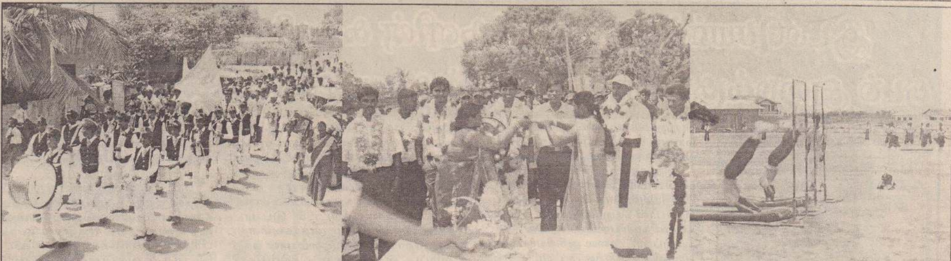
தேசிய மட்ட உடற்பயிற்சிப் போட்டியில் முதலிடம் பெற்ற ஊர்காவற்றுறை புனித அந்தோனியார் கல்லூரி உடற்பயிற்சி அணியை வரவேற்கும் நிகழ்வு கடந்த திங்கட்கிழமை ஊர்காவற்றுறையில் இடம்பெற்றது. வீரர்கள் 'பான்ட்' வாத்தியம் சகிதம் அழைத்து வரப்படுவதை முதற் படத்திலும், கல்லூரி அறிவிர் விளையாட்டுப் பொறுப்பாளியார், அணித்தலைவர், பயிற்றுவிப்பாளர் ஆகியோர் மாலையிட்டு வரவேற்கப்படுவதை இரண்டாவது படத்திலும், வீரர்கள் காட்சி போட்டியில் ஈடுபடுவதை மூன்றாவது படத்திலும் காணலாம். (50-32)