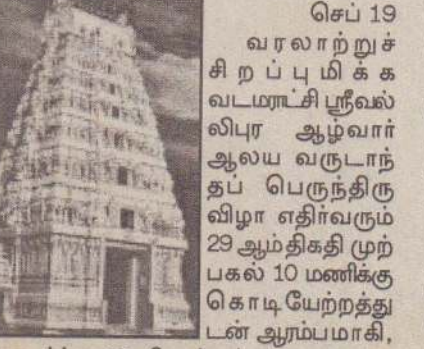
தொடர்ந்து 17 தினங்கள் வரை நடைபெறவுள்ளது.

பெருந்திருவிழாவின் சிறப்புத் திருவிழாக்களான குருக்கட்டு விநாயகர் தரிசனம் எதிர்வரும் 6 ஆம் திகதி திங்கட்கிழமையும், வெண்ணெய்த் திருவிழா 7 ஆம் திகதி செவ்வாய்க்கிழமையும், துகில் திருவிழா 8 ஆம் திகதி புதன் கிழமையும், பாம்புத் திருவிழா 9 ஆம் திகதி வியாழக்கிழமையும், ஹம்சன் போர்த்திருவிழா 10 ஆம் திகதி வெள்ளிக்கிழமையும், வேட்டைத் திருவிழா 11 ஆம் திகதி சனிக்கிழமையும், சப்பரத்திருவிழா 12 ஆம் திகதி ஞாயிற்றுக்கிழமையும் இடம்பெறும்.