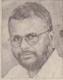
அதிபர் சங்கம், சங்காணைக் கல்விக் கோட்டம், வலிகாமம்.