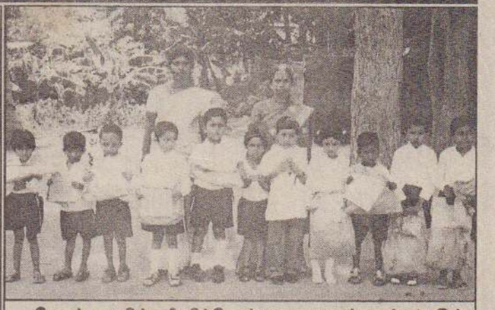
கோண்டாவில் புரீ விக்னேஸ்வரா ஞானக்குழந்தை இல்லத்தின் பாலர் விளையாட்டு விழாவின் போது பங்குகொண்ட குழந்தைகளும் ஆசிரியைகளும்.