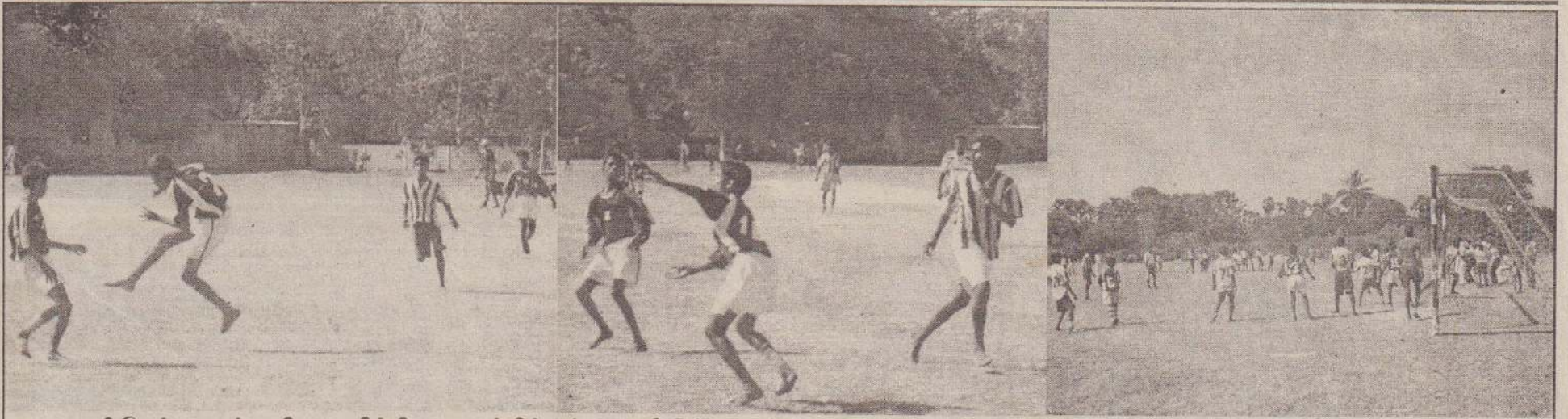
அராலி தெற்கு சரஸ்வதி மகாவித்தியாலயத்திற்கும் அராலி இந்துக்கல்லூரிக்கும் இடையேயான 16 வயதுப் பிரிவினருக்கான இறுதிப்போட்டியில் இரு அணிகளும் மோதிக்கொள்ளும் முக்கிய காட்சிகளைப் படங்களில் காணலாம்.