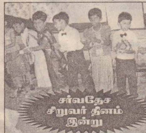
சர்வதேச சிறுவர் தினம் இன்று

களும் ஒரு தினத்தில் மட்டும் கொண்டாடப்படுவதன் மூலம் நாம் குறிப்பிட்ட இலக்கை அடைவோமா? என்பது சிந்தனைக்குரிய ஒரு விடயமாகும். ஆனால் இத்தினத்தில் நாம் சிறுவர் தொடர்பாகச் சிந்தித்து சிறுவர்களுக்காக ஓர் உறுதி மொழியை எடுத்துக் கொள்வதற்கும் இக்