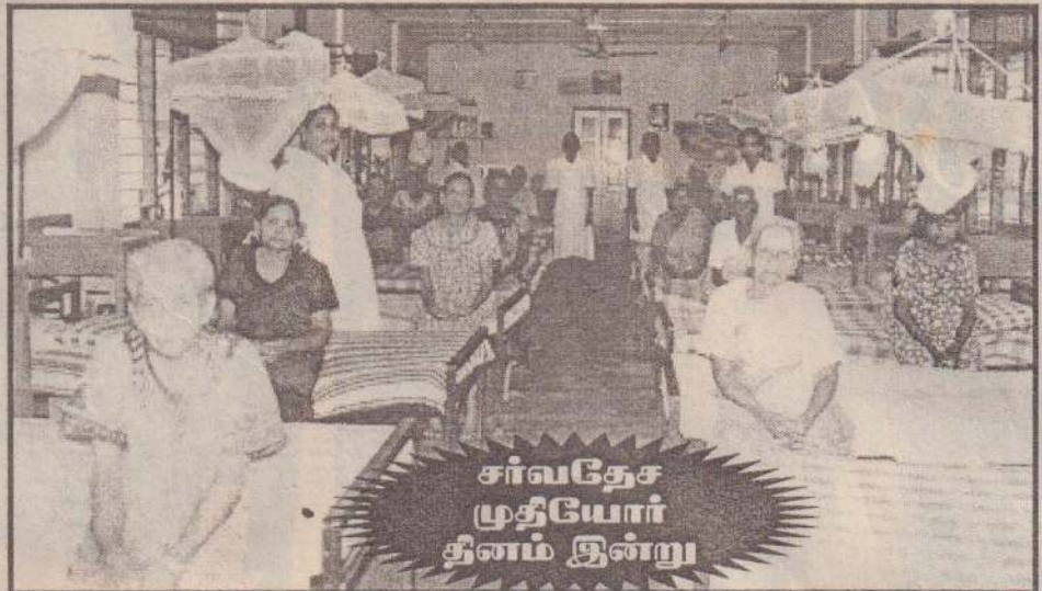
சர்வதேச முதியோர் தினம் இன்று

யாதுகாப்பது எமது கடமை வருடங்கள் 60 உருண்டோடியதும் முதுமை எங்களை ஆட்கொள்கின்றது. அப்போது நாம் முதியவர்கள் என்ற நாமத்தைப் பெறுகின்றோம். இன்று எமது சமுதாயத்திலே இளம் சமுதாயத்தை விட முதியவர்களே எண்ணிக்கையிலே கூடுத