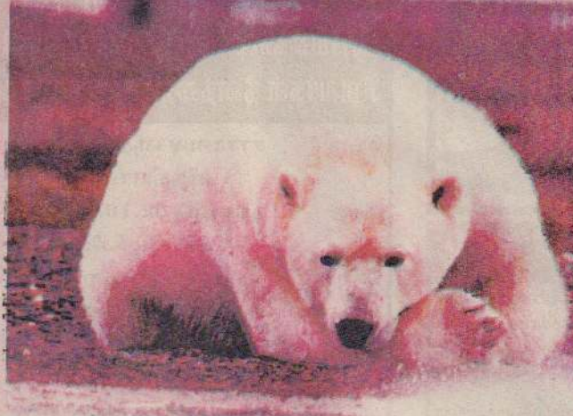
பெரும் திமிங்கிலமோ, அல்லது பெரிய மிருகங்களோ உண்ணக் கிடைக்கும் பொழுது 20-30 கரடிகள் போல ஒரே இடத்தில் பார்க்கலாம். இவை ஏறத்தாழ 20-25 ஆண்டுகள் வாழும்.

கரடிகள் நல்ல மோப்பத் திறனும் கேட்கும் திறனும் கொண்டவை; உடலில் அதிக முடிகளைக் கொண்டுள்ளன. மேலும் இவை இரண்டு காலிகளினால் நிற்க வல்லவை.