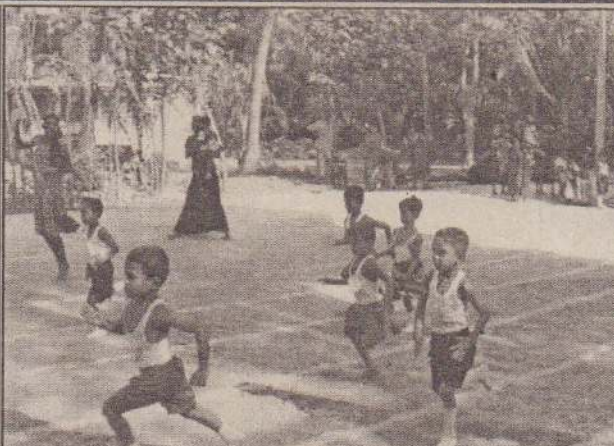
சங்குமேலம் குடும்பப் பாடசாலை முன்பள்ளி விழாக்களின் பதிவுகள்...