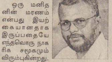
ஒரு மனிதனின் மரணம் என்பது இயற்கையானதாக இருப்பதையே எந்தவொரு நாகரிக சமூகமும் விரும்புகின்றது.

யாழ்ப்பாணம், ஓக்.1 யாழ். பல்கலைக்கழக முகாமைத்துவ மாணவர் ஒன்றியத்தினர் நாளை மறுதினம் பி.ப.3 மணிக்கு இறுதி வருட முகாமைத்துவ மாணவர்களுக்கான குழுப்படம் எடுக்கும் நிகழ்வினை ஏற்பாடு செய்துள்ளனர். நிகழ்வில் சகல மாணவர்களையும் தவறாது கலந்து கொள்ளுமாறு முகாமைத்துவ மாணவர் ஒன்றியச் செயலாளர் கேட்டுள்ளார்.