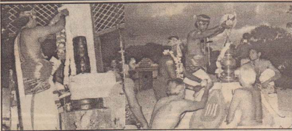
சுழிபுரம் சம்பநாதேஸ்வர ஆலயத்தில் இந்தியாவில் இருந்து கொண்டுவரப்பட்ட பஞ்சமுக சிவலிங்கப் பெருமான் பிரதிஷ்டை செய்யப்பட்டுள்ளது. சிவலிங்கப் பெருமானுக்கு அபிஷேகம் இடம்பெறுவதையும் மூலஸ்தான கல் சத்திற்கு அபிஷேகம் செய்யப்படுவதையும் படங்களில் காணலாம்.