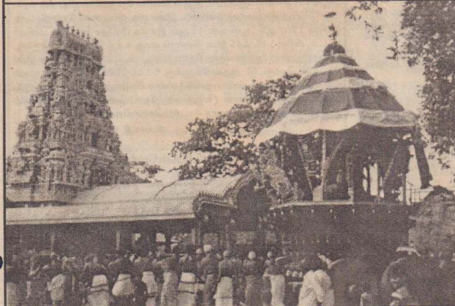
உடும்பிராய் கருணாகரப் பிள்ளையார் கோயில் வருடாந்த தேர்த்திருவிழா கடந்த 14ஆம் திகதி இடம்பெற்றது. கருணாகரப்பிள்ளையார் தேரில் வீதி உலாவரும் காட்சி.