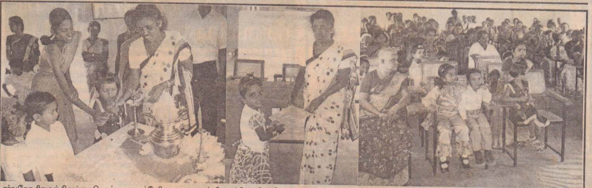
சர்வதேச சிறுவர் தினத்தையொட்டி சாவகச்சேரி நகரசபையால் சிறுவர்தின விழா நேற்று வியாழக்கிழமை நகரசபை கேட்போர்கூடத்தில் நடத்தப்பட்டது. முன்பள்ளி மாணவிக் கலந்துகொண்டோரில் ஒரு பகுதியினரை மூன்றாவது படத்திலும் காணலாம்.