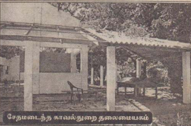
சேதமடைந்த காவல்துறை தலைமையகம்

யாழ்ப்பாணம், ஒக். 4 வடமராட்சி கல்வி வலய அலுவலகம் நேற்று முற்பகல் படைபிரிவுகள் சுற்றிவளைக்கப்பட்டு சல்லடை போட்டுத் தேடுதல் நடத்தப்பட்டது. (12ஆம் பக்கம் பார்க்க)