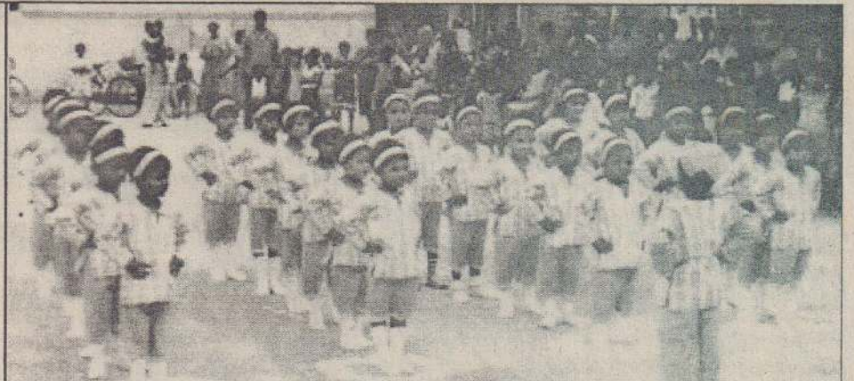
குருநகர் சனசமூக நிலைய முன்பள்ளிச் சிறுவர்களின் விளையாட்டுப் போட்டி குருநகர் கலை அரங்கு முன்றலில் நடைபெற்றது. இந் நிகழ்வில் இடம்பெற்ற உடற்பயிற்சி விளையாட்டை படத்தில் காணலாம்.