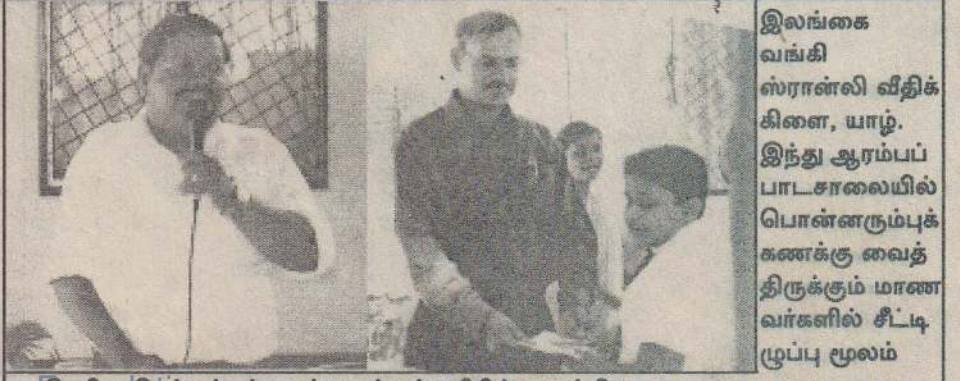
இலங்கை வங்கி ஸ்ரான்லி வீதிக் கிளை, யாழ்ப்ப. இந்து ஆரம்பப் பாடசாலையில் பொன்னரும்புக் கணக்கு வைத்திருக்கும் மாணவர்களில் சீட்டி. மூப்பு மூலம்