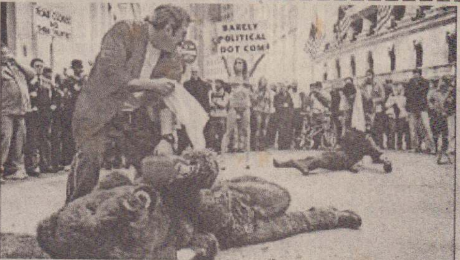
நியூயோக் பங்குச்சந்தைக்கு வெளியே கடி, காளை பெய்மைகளை வைத்து இப்போதைய நிதி நெருக்கடி நிலையை ஒரு குழு கண்டம் செய்தது. கடிமீன் ரிழவில் பங்குச்சந்தை இருப்பதற்குக் காரணம் என்றும் களை எஸ்ஸல் இலாம். இந்தநிலையில் அமெரிக்க பங்குச் சந்தை ரிசேவ் வங்கித் தலைவர் பென் பேரன்சோ, நிதி நெருக்கடியைச் சமாளித்து பொருளாதாரத்தை மீளவைக்க வேண்டும் என்று அமெரிக்காவுக்கு உதவ வேண்டும் என்று கேட்டுக்கொண்டார்.