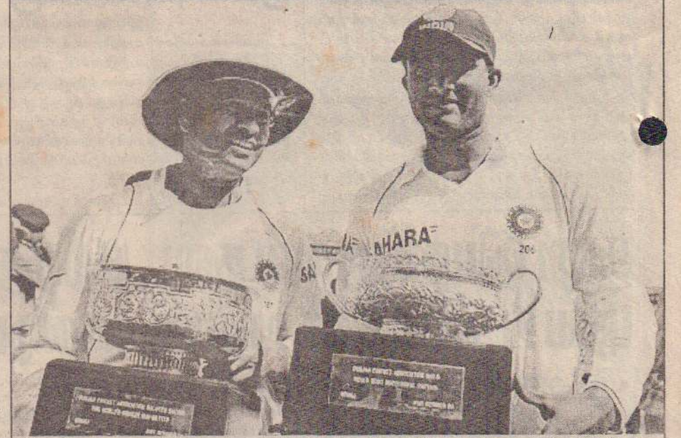
சமீபத்தில் மொஹாலியில் நடந்த டெஸ்ட் போட்டியில் சச்சின் டெண்டுல்கர் டெஸ்ட் போட்டிகளில் அதிக ஓட்டங்கள் குவித்தவர் என்ற சாதனையைப் படைத்தமைக்காகவும், கங்குலி இந்த டெஸ்ட் தொடருடன் ஓய்வு பெறுகின்றமைக்காகவும் இருவரையும் பாராட்டி பஞ்சாப் கிரிக்கெட் சபை விருது வழங்கியது. இருவரும் தமக்கான விருதுகளுடன் காணப்படுகின்றனர்.

எனது வாழ்நாளில் மிக மோசமான தோல்வி இது. டெஸ்ட் தொடரில் 0-1 என பின்தங்கியிருந்தது எங்களுக்குப் பழக்கமில்லை. இதுபோன்ற தோல்வியையும் சந்தித்தது இல்லை. இது குறித்து ஒவ்வொருவரும் சிந்தனை செய்வோம்- என்றார் பொண்டிங்.