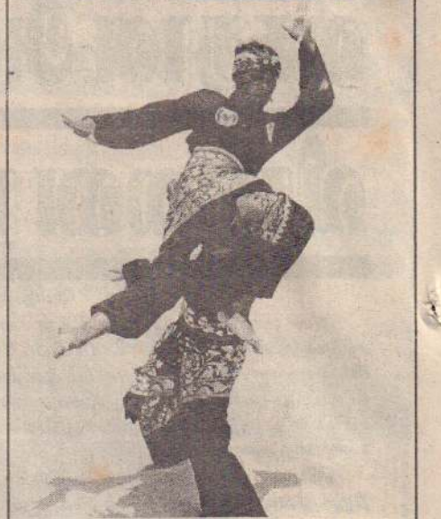
இந்தோனேசியாவின் பாலி கடற்கரையில், நடைபெற்று வரும் 'ஆசிய பீச் கராதே' போட்டியில் இந்தோனேசிய வீரர்கள் இருவர் மோதிக்கொள்ளும் காட்சி.

எங்கள் அணி மீது எனக்கு முழு நம்பிக்கை இருக்கிறது. சரிவில் இருந்து மீண்டு வரும் திறமை எங்களது வீரர்களிடம் உண்டு - என்றார்.