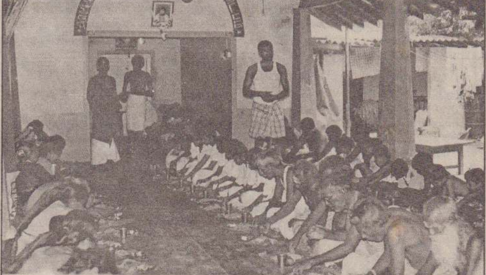
தொண்டைமானாறு சந்திரியான் ஆச்சிரமத்தில் இடம்பெற்ற மடில்வாகனம் சுவாமிகளின் குரு பூசை நிகழ்வின் பின்னர் அன்னதாது வழங்கப்பட்ட பக்தர்கள் உணவருந்துவதைப் படித்தல் காணலாம்.