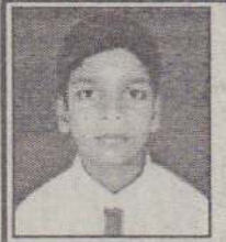
"சர்வத்தி வாசன்" மாசியப்பிட்டி, சண்டிலிப்பாய்

2008ஆம் ஆண்டு தரம் 5 புலமைப்பரிசில் பரீட்சையில் 114 புள்ளிகளைப் பெற்று சித்தியடைந்த யா/நல்லூர் ஆணந்தா வித்தியாசாலை மாணவன்