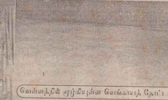
வெள்ளத்தில் மூழ்கியுள்ள வெங்காயத் தோட்டம்