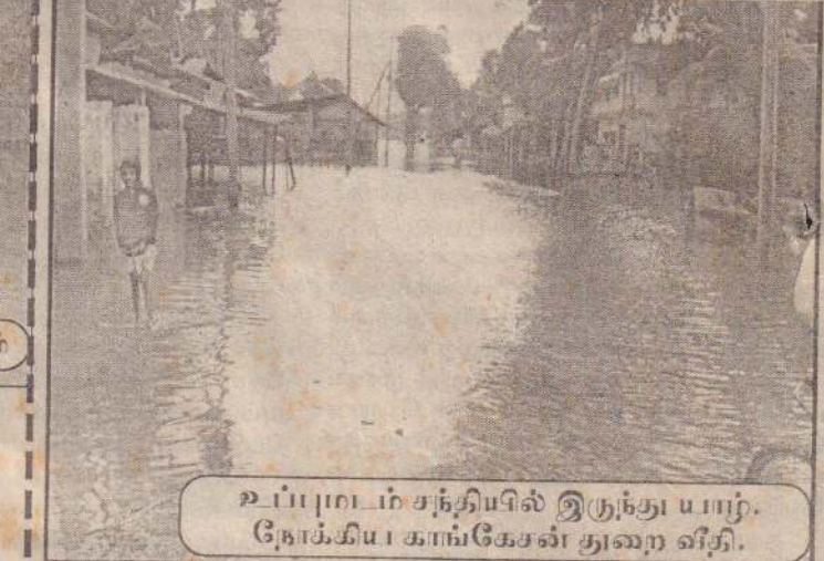
உப்புமடம் சந்தியில் இருந்து யாழ். நோக்கிய காங்கேசன் துறை வீதி.