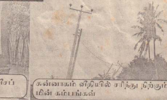
சுன்னாகம் வீதியில் சரிந்து நிற்கும் மின் கம்பங்கள்