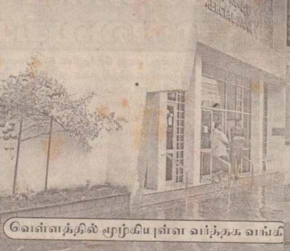
வெள்ளத்தில் மூழ்கியுள்ள வந்தக வங்கி