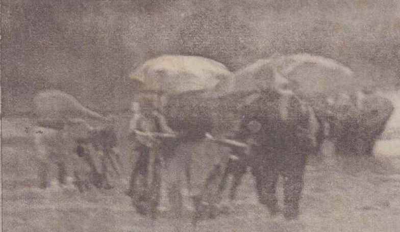
வெள்ளத்தில் இடம் பெயரும் மக்கள்....