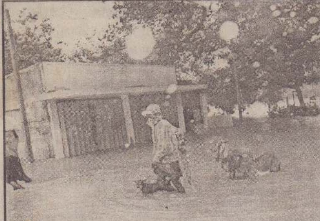
திருநெல்வேலி சிவன் விதியில் வெள்ளத்தில் வளர்ப்புப் பிராணியுடன்....