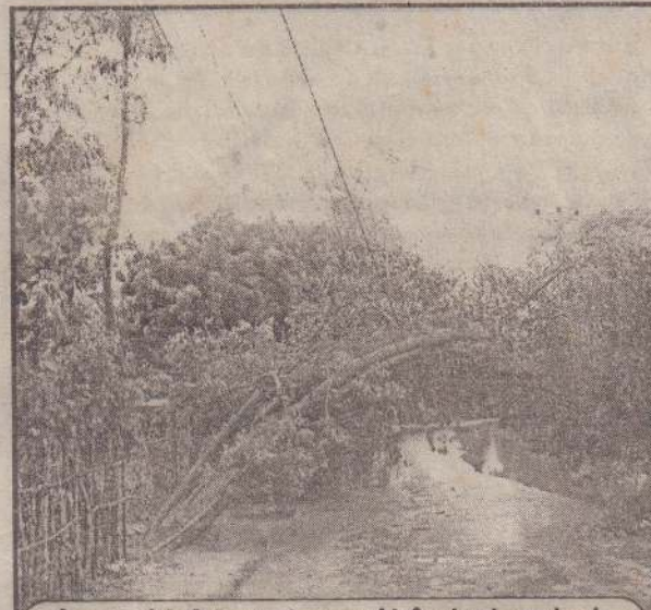
நீர்வால் விதியின் குறுக்காக சரிந்திருக்கும் மரங்கள்...