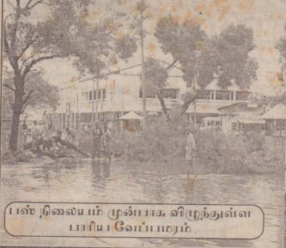
பஸ் நிலையம் முன்பாக விழுந்துள்ள பாயிபு போம்பொம்