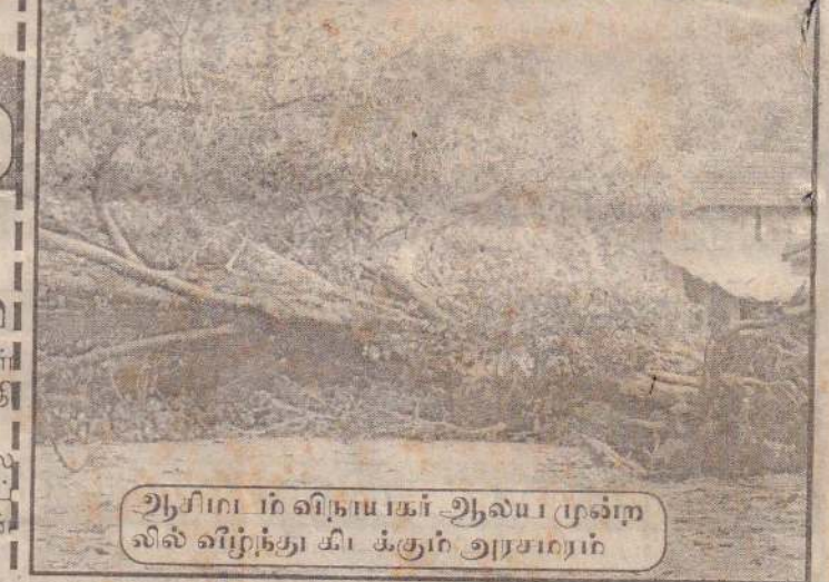
ஆசிரியர் விநாயகர் ஆலய முன்புலில் வீழ்ந்து கிடக்கும் அரசாங்கம்