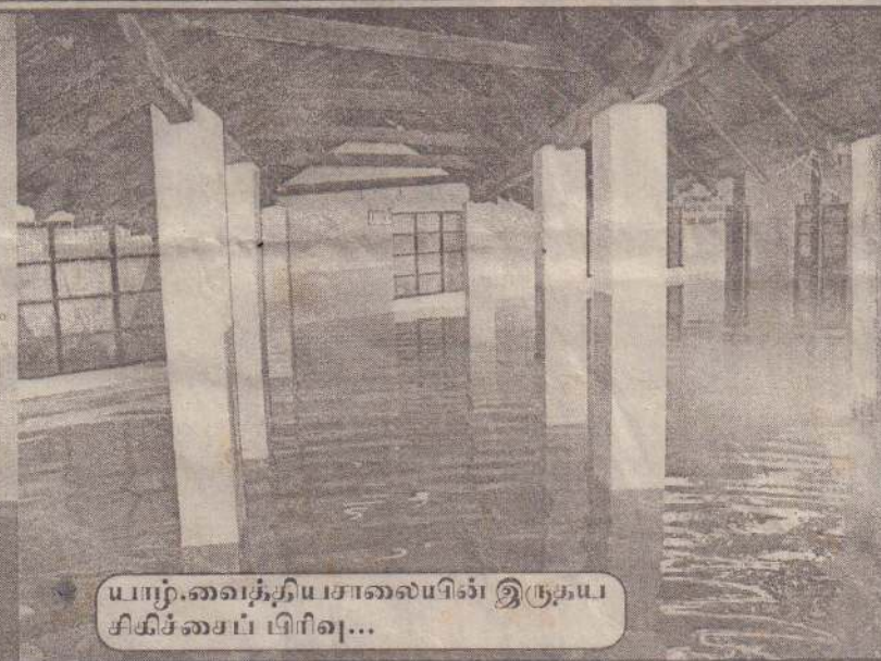
யாழ்.வைத்தியசாலையில் இருதய சிகிச்சைப் பிரிவு...