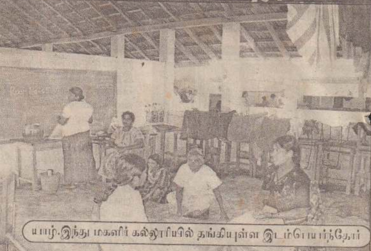
யாழ்.இந்து மகளிர் கல்லூரியில் தங்கியுள்ள இடம்பெயர்ந்தோர்