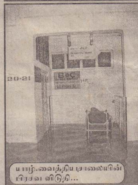
யாழ்.வைத்தியசாலையில் பிரசவ விடுதி...