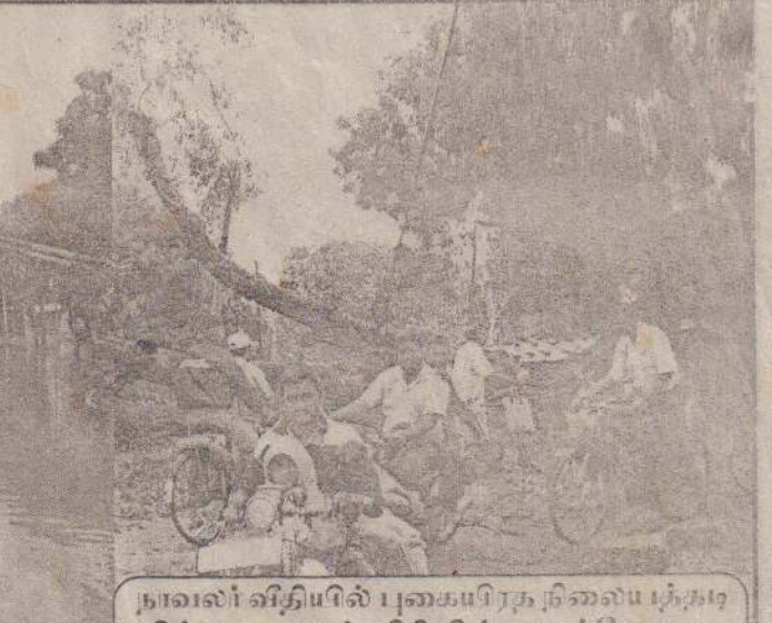
நாவல் விதியில் புகைபிடித நிலையத்தரையில் அரசு மரம் விதியின் குறுக்கே...