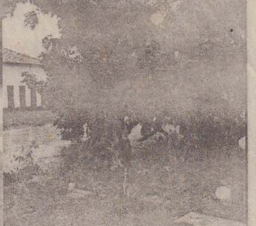
வேரோடு விரந்திருக்கும் பாரியமரம்