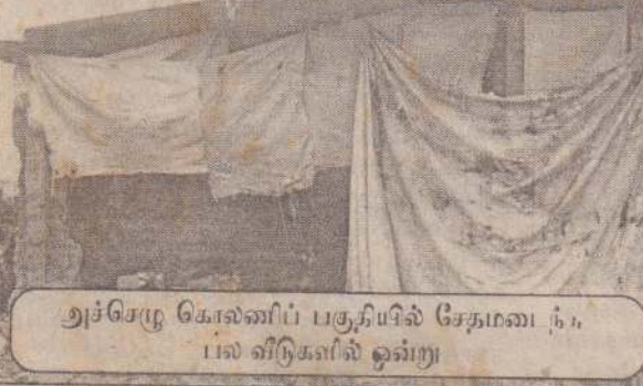
அச்சேறு கொலனிப் பகுதியில் சேதமடைந்த பல் வீடுகளில் ஒன்று