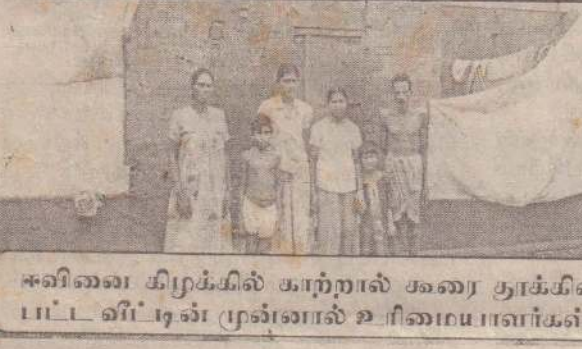
சுவினை கிழக்கில் காற்றால் சுவரை தாக்கி வீசப்பட்ட வீட்டின் முன்பால் உரிமைபாளர்கள்