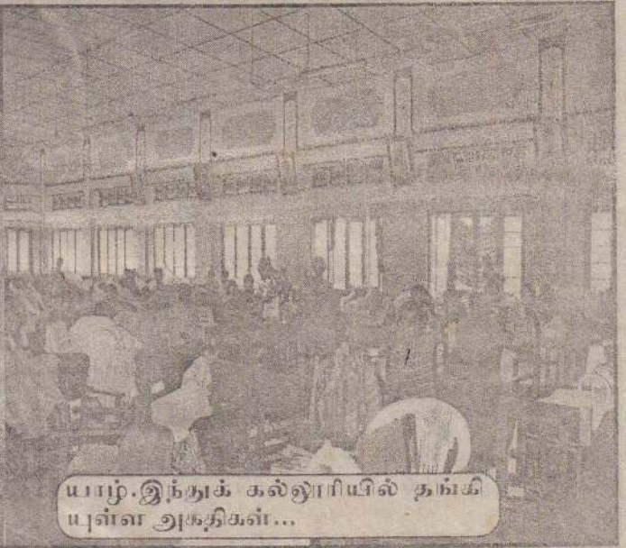
யாழ்.இந்துக் கல்லூரியில் தங்கியுள்ள அகதிகள்...