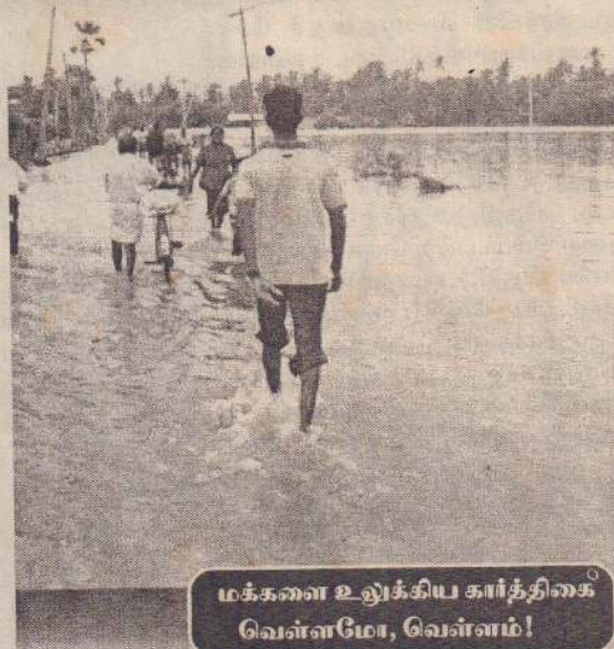
மக்களை உலுக்கிய கார்த்திகை வெள்ளமோ, வெள்ளம்!

ஆயத்தம். உங்கள் பாடு எப்படி?” “இங்கு ஏற்கனவே வந்துவிட்டது. எல்லாரும் வெளியேறிக் கொண்டிருக்க