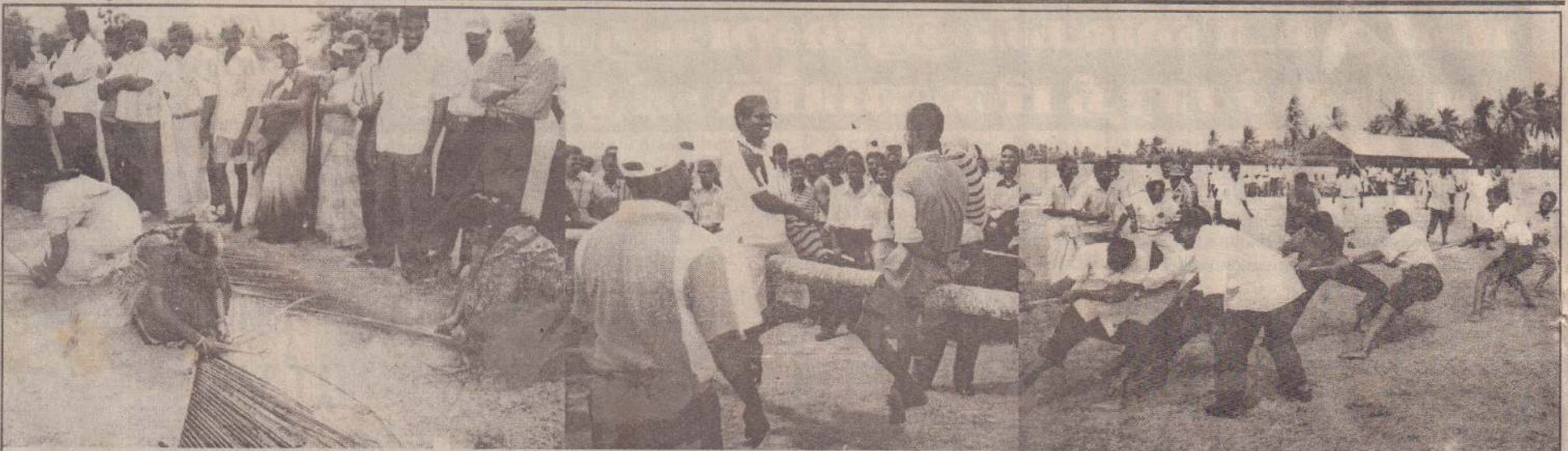
வலி.கிழக்கு உள்ளூராட்சிவார இறுதிநாள் நிகழ்வை முன்னிட்டு பல்வேறு போட்டிகள் நடத்தப்பட்டன.