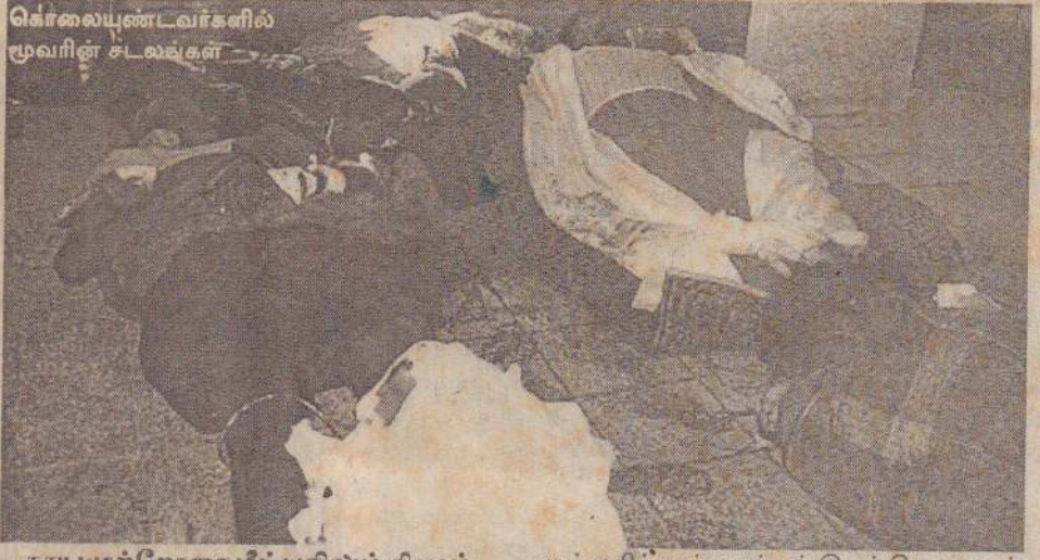
கொலையுண்டவர்களில் மூவரின் சடலங்கள் காயமுற்றோரை மீட்பதிலும் சிரமம் இப்பகுதியை நோக்கிக் கடுமையான ஆட்கள் தாக்குதல்கள் இடம் பெறுவதன் (16 ஆம் பக்கம் பார்க்க)

அமைந்துள்ள பொதுமக்கள் குடியிருப்புகள் மீதே இத்தாக்குதல்கள் நடத்தப்பட்டன. இதன்போது 5 பேர் அந்த இடத்திலேயே உடல் சிதறிப் பலியாகினர். காயமடைந்தவர்கள் தருமபுரம் மருத்துவமனையில் சேர்க்கப்பட்டுள்ளனர்.