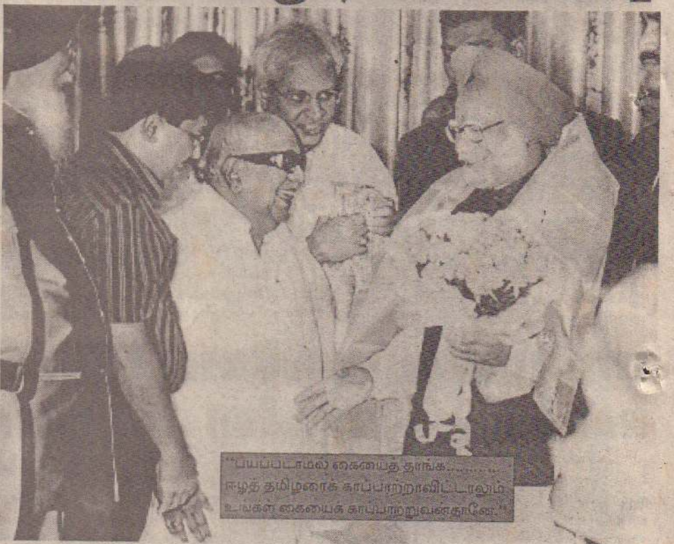
பயப்படாமல் கையைத் தாங்கி சமூக தமிழகக் காப்பாற்றாவிட்டாலும் உயர்கள் கையைக் காப்பாற்றுவதைக் கேள்.