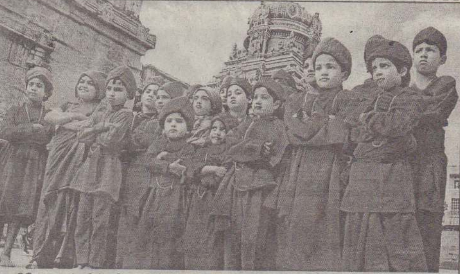
விவேகானந்தரின் பிறந்த தினமான நேற்று தேசிய இளையோர் தினமாகக் கடைப்பிடிக்கப்பட்டது. இதையொட்டி மதுரை பாரதி யுவ கேந்திரா சார்பில் மதனகோபால் சுவாமி கோயிலில் நேற்றுமுன்தினம் நடந்த நிகழ்ச்சியில் விவேகானந்தர் போல் வேடமணிந்து ஏராளமான சிறுவர்கள் பங்கேற்றபோது.....

இராமநாதபுரம் மாவட்டம், பரமக்குடி நகர்க்குழு சார்பில், இந்தியக் கம்யூனிஸ்ட் கட்சியின் புதிய அலுவலகத்தைத் திறந்துவைத்து பேசியபோதே அவர் இதனைக் கூறினார். மேலும் அவர் கூறியவை வருமாறு - மக்களின் ஆதரவின்றி ஓர் இயக்கம் 30 ஆண்டுகளாகத் தொடர்ந்து போராட்டம் நடத்த முடியாது. ஆகவே, புலிகளைத் தீவிரவாதிகள் என ஒதுக்கிவிட முடியாது.