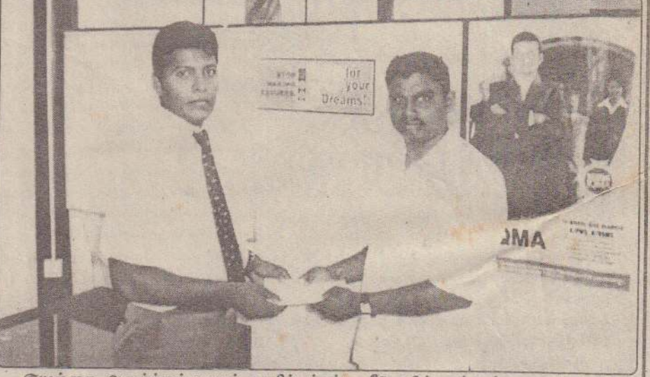
சூயற்கை அனர்த்தங்களால் பாதிக்கப்பட்ட வீடுகளில் ஒன்றுக்கான இழப்பீட்டுத் தொகையை ஜனசக்தி காப்புறுதிக்கம்பனி வழங்கியபோது எடுக்கப்பட்ட படம்.