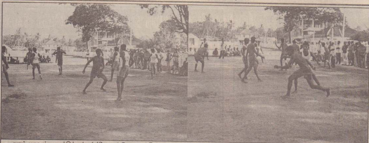
யாழ்.மாவட்ட தாச்சிச் சங்கம் 'சோஆ' நிறுவனத்தின் ஆதரவுடன் நடத்திய தாச்சிச் சுற்றுப்போட்டியில் மானிப்பாய் வெஸ்ரோம் விளையாட்டுக் கழகம் சம்பியனாகத் தெரிவுசெய்யப்பட்டது. இறுதிப் போட்டியில் மானிப்பாய் வெஸ்ரோம் வி.கவும், மயிலிட்டி ஒற்றுமை வி.கவும் மோதிக் கொள்ளும் காட்சிகளைப் படங்களில் காணலாம்.