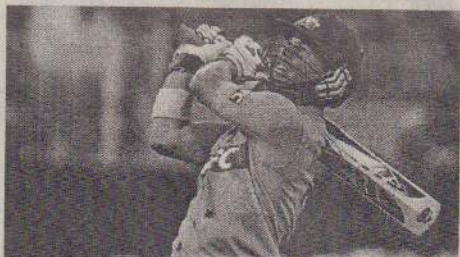
டேவிட் வார்னரின் அதிரடியான ஆட்டம்