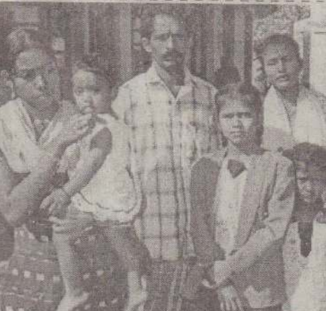
தமிழகத்திலிருந்து இலங்கைக்குத் தப்பிச் செல்ல முயன்ற ஏழு ஈழ அகதிகளை கடந்த சனிக்கிழமை பொலிஸார் கைது செய்தனர். அவர்களைப் பட்டத்தில் காணலாம்.

நேற்றுமுன்தினம் கோவையில் செய்தியாளர்களிடம் பேட்டியளித்தபோதே அவர் இதைக் கூறினார். மேலும் அவர் கூறியவை வருமாறு - இலங்கையின் இறையாண்மை மிக முக்கியம். அதே நேரத்தில், அங்குள்ள தமிழர்களின் நலன் பாதுகாக்கப்பட வேண்டும். அங்கு போரை நிறுத்தி விட்டு பேச்சு மூலம் தீர்வு காண வேண்டும் எனத் தொடர்ந்து வலியுறுத்துகிறோம். போரை நிறுத்த இந்திய அரசு உரிய நடவடிக்கை எடுக்க வேண்டும்.