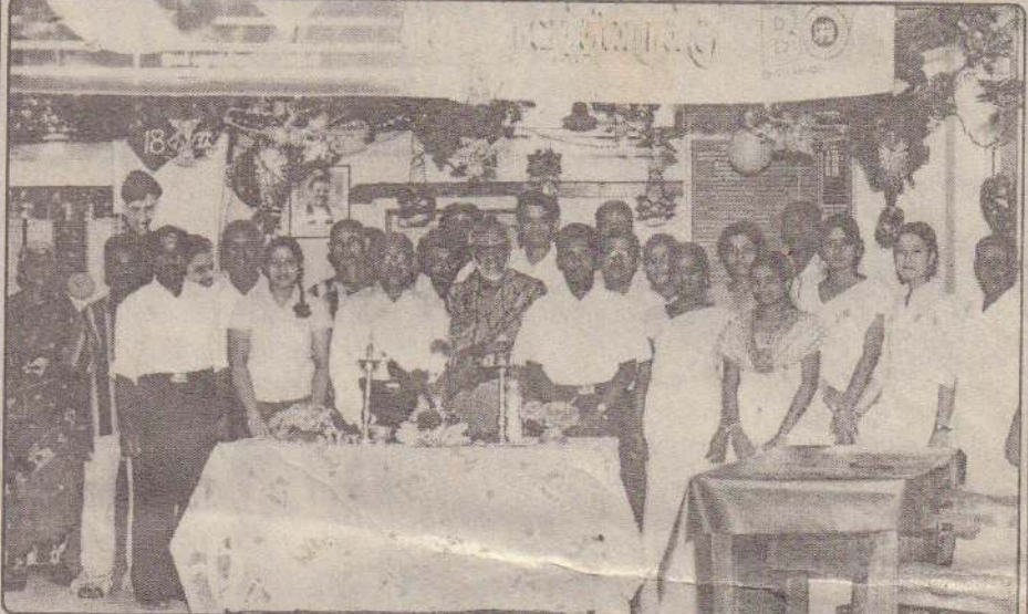
இலங்கை வங்கி, காங்கேசன்துறை கிளையில் புதுவருட தினத்தன்று கடமைகளை ஆரம்பிக்கும் நிகழ்வில் எடுக்கப்பட்ட படங்கள்.