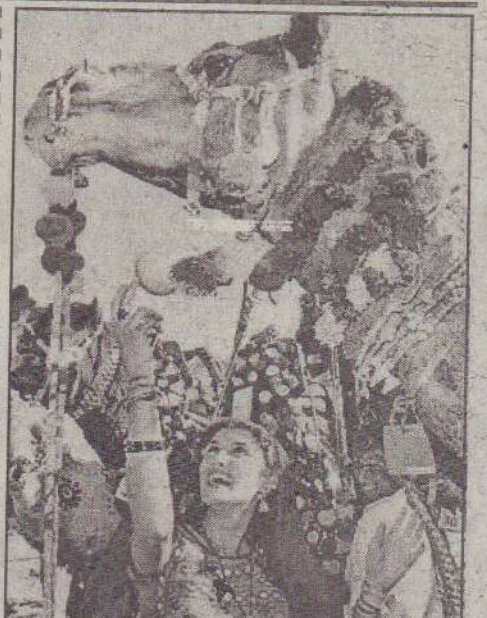
ராஜஸ்தானில் 16வது சர்வதேச ஓட்டகத் திருவிழா நடக்கிறது. அலங்கரிக்கப்பட்ட ஓட்டகத்தைப் பார்த்து வெளிநாட்டு சுற்றுலாப் பெண் தொட்டு விளையாடி மகிழ்கிறார்...