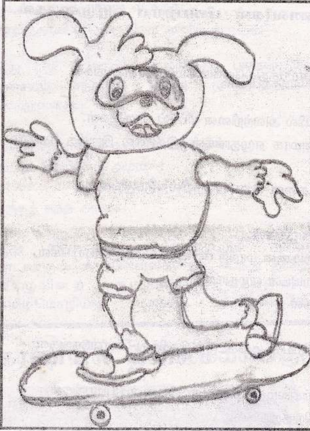
வ.சாயிருக்ஷன், தரம் - 6, யா/கோப்பாய் தமிழ் நாவல் வித்.