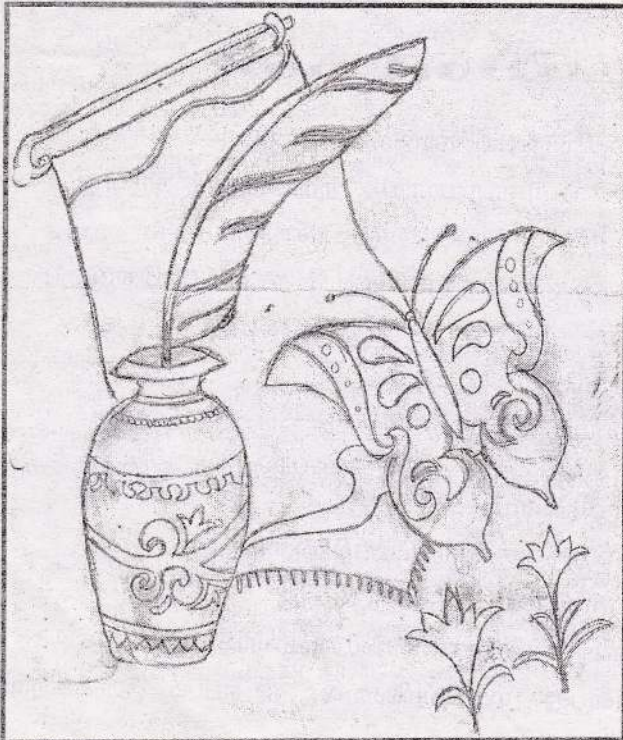
ம.லிமியா, தரம் - 11, யா/நடேஸ்வராக் கல்லூரி