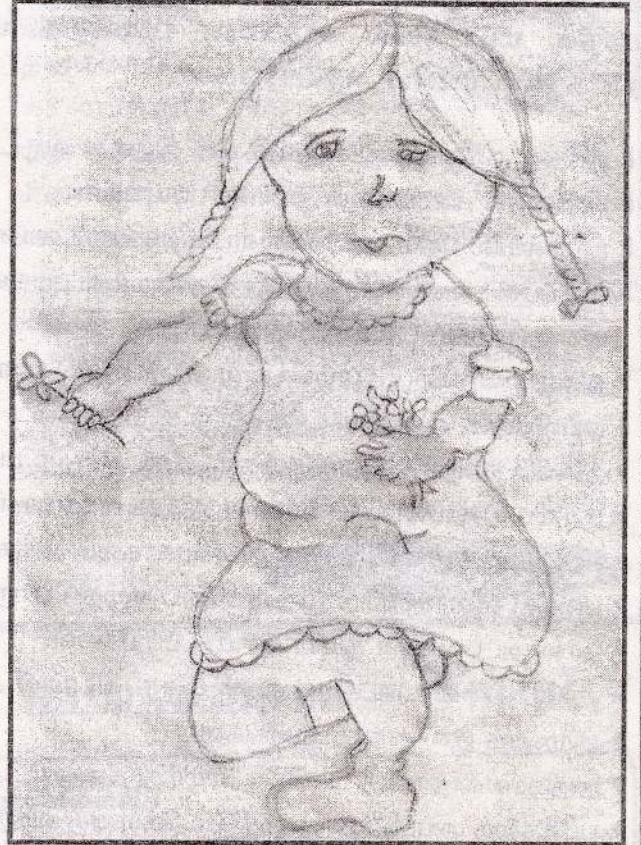
சே.புஸ்பதபன், தரம் - 8, யா/நடேஸ்வராக் கல்லூரி