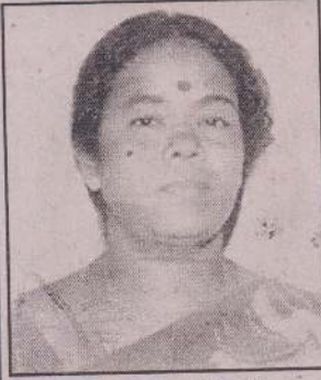
06, சந்தையாதி கோயில் வீதி, பாண்டியன் தாழ்வா, யாழ்ப்பாணம்.