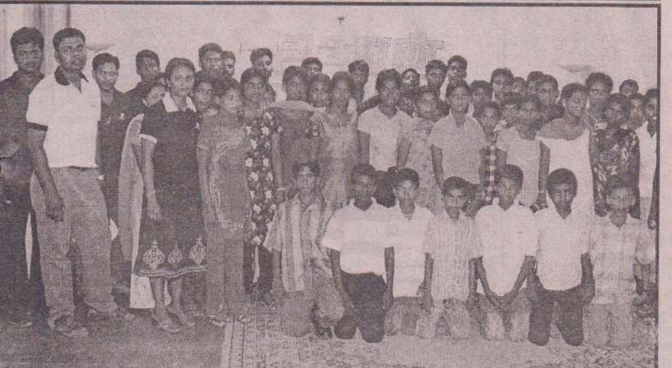
சாவகச்சேரி வை.எம்.சி.ஏ.உறுப்பினர்கள் நேற்று முன்தினம் கல்விச் சுற்றுலா ஒன்றை மேற்கொண்டிருந்தனர். உதயன் அலுவலகத்திற்கும் வருகை தந்தனர். அதன்போது எடுக்கப்பட்ட படம்.