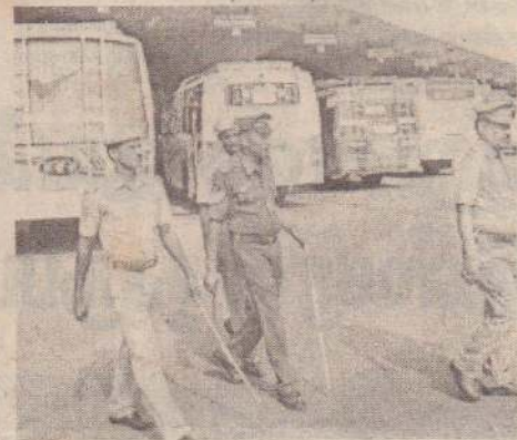
பட்டன. 20 பஸ்களின் கண்ணாடிகள் உடைக்கப்பட்டன. கடலூர் மாவட்டத்தில் 20 பஸ்கள் சேதப்படுத்தப்பட்டன. இதையொட்டி, இரு மாவட்டங்களிலும் இதுவரை 40 பேர் கைது செய்யப்பட்டு உள்ளனர்.

விழுப்புரம் மாவட்டத்தில் கடந்த 2 நாட்களாக 5 பஸ்கள் தீவைத்து எரிக்கப்