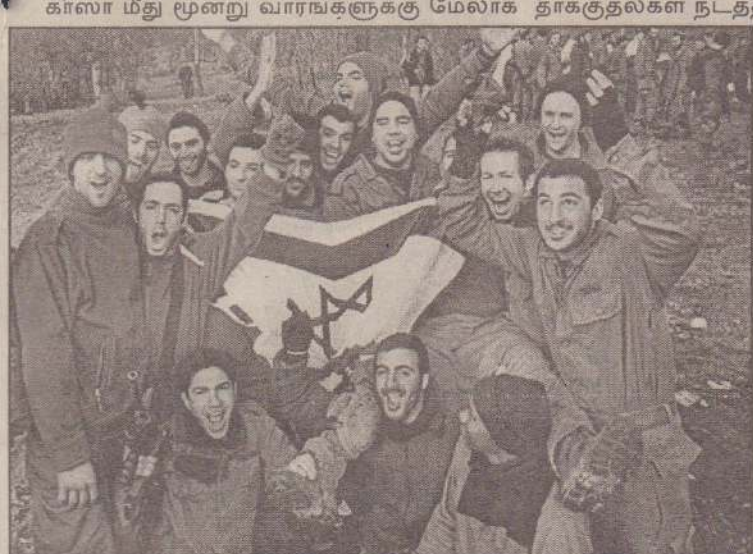
பலஸ்தீனத்தின் மீதான தாக்குதலை தாங்களாகவே நிறுத்திக்கொண்டு ஞாயிற்றுக்கிழமை காலை காஸாவிலிருந்து தங்கள் நாட்டுக்குத் திரும்பிய இஸ்ரேல் இராணுவ வீரர்கள் வெற்றிச் சின்னங்களைக் காட்டி மகிழ்ச்சி தெரி விக்கின்றனர். ஆனால், ஹமாஸ் இயக்கத்தவர் இதன் பின்னரும் ரொக் கெட்டுகளை இஸ்ரேல் மீது செலுத்தி தாக்குதல் நடத்தினர். எனவே, இந்தப் போர்நிறுத்தம் நீடிக்குமா என்ற சந்தேகம் ஏற்பட்டுள்ளது.

காஸாவுக்குள் நிலைகொண்டுள்ள இஸ்ரேலியத் துருப்புகள் உடனடியாக வாயஸ் பெற ளாட்டா என சனிக்கிழமை அறிவித்த தல் விடுத்த இஸ்ரேலியப் பிரதமர் ஈசுட் ஒல்மேர்ட், திடீரென தமது நிலைப் பாட்டை ஞாயிற்றுக்கிழமை மாற்றிக் கொண்டார்.