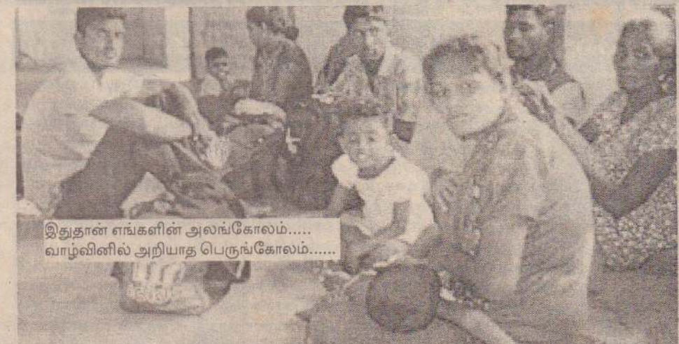
இதுதான் எங்களின் அலங்கோலம்..... வாழ்வினில் அறியாத பெருங்கோலம்.....

மண்டபம், ஜன. 20 இலங்கையிலிருந்து இந்தியாவுக்கு புகு மூலம் தப்ப முயன்று பிடிபட்ட தமிழர்களை இராணுவத்தினர், மன்னார் பகுதி முகாமில் அடைத்துவைத்து சித்திரவதை செய்கின்றனர். இனிமேல் இலங்கையில் அமைதி திரும்பும் என்ற நம்பிக்கை எங்களுக்கில்லை - என்று மண்டபம் வந்த அகதிகள் கூறினர் என தமிழக நாளை செய்தி வெளியிட்டுள்ளது.