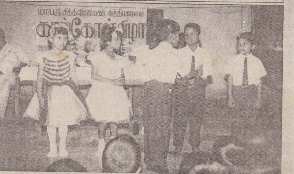
பருத்தித்தறை சித்திவிநாயகர் வித்தியாலயத்தில் நடைபெற்ற கால்கோள் விழாவில் மாணவர்களின் கலைநிகழ்வு இடம்பெற்றபோது எடுக்கப்பட்ட படம்.