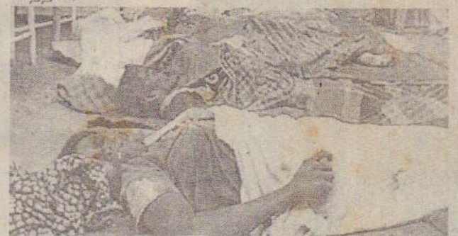
அதில் மேலும் தெரிவிக்கப்பட்டிருப்பவை வருமாறு:- சுதந்திரபுரம் 100 வீட்டுத்திட்டப் (16 ஆம் பக்கம் பார்க்க)

படுகொலை செய்யப்பட்டுள்ளதுடன் 178 பேர் காயமடைந்துள்ளனர் என இணையத்தளத் தகவல்கள் தெரிவித்தன.