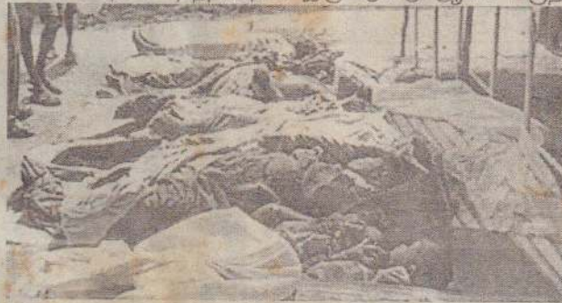
களை நோக்கி நேற்று வியாழக்கிழமை நடத்தப்பட்ட ஷெல் மற்றும் பிரங்கித் தாக்குதல்களில் 44 பொதுமக்கள்

மக்கள் பாதுகாப்பு வலயப் பகுதிகளான உடையார்கட்டு, மாணிக்கபுரம், சுதந்திரபுரம், இருட்டுமடு ஆகிய பகுதி