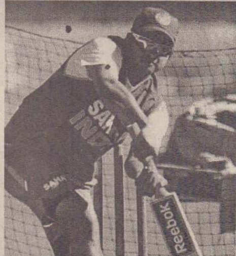
மேற்படி இலக்கை எட்டி, இரண்டாவது இன்னிங்ஸ் துடுப்பாட்டத்தைத் தொடர்ந்து மேற்கொள்ள வேண்டிய கட்டாயத்திற்கு

புக்கு 654 என்ற விஸ்ப்ரூப ஓட்ட எண்ணிக்கையைச் சமாளிக்கும் விதத்தில் நேற்று பாசிஸ்தான் துடுப்பெடுத்தாடியது. நேற்று முன்தினம் மாலையில் ஒரு விக்ரெட் இழப்புக்கு 44 ஓட்டங்கள் என்ற நிலையில் இருந்த பாசிஸ்தான் அணி நேற்று மூன்றாம் நாள் ஆட்டம் முழுவதும் பொறுமையுடனும் நிதானத்துடனும் துடுப்பெடுத்தாடி நேற்றைய ஆட்ட முடிவின் போது 3 விக்ரெட்டுக்கள் இழப்புக்கு 296 ஓட்டங்கள் என்ற நிலைமையை அடைந்தது. பாசிஸ்தான் அணி தனது முதல் இன்னிங்ஸ் ஓட்ட எண்ணிக்கையை 445 என்ற அளவுக்கு உயர்த்துமானால் - அதற்கு இன்னமும் தேவைப்படும் 149 ஓட்டங்களை இன்றைய ஆட்டத்தில் பெறுமானால் - இந்த டெஸ்ட் பெரும்பாலும் வெற்றி - தோல்வியின்றி முடிவடையது உறுதி என விமர்சகர்கள் சுட்டிக் காட்டுகின்றனர்.