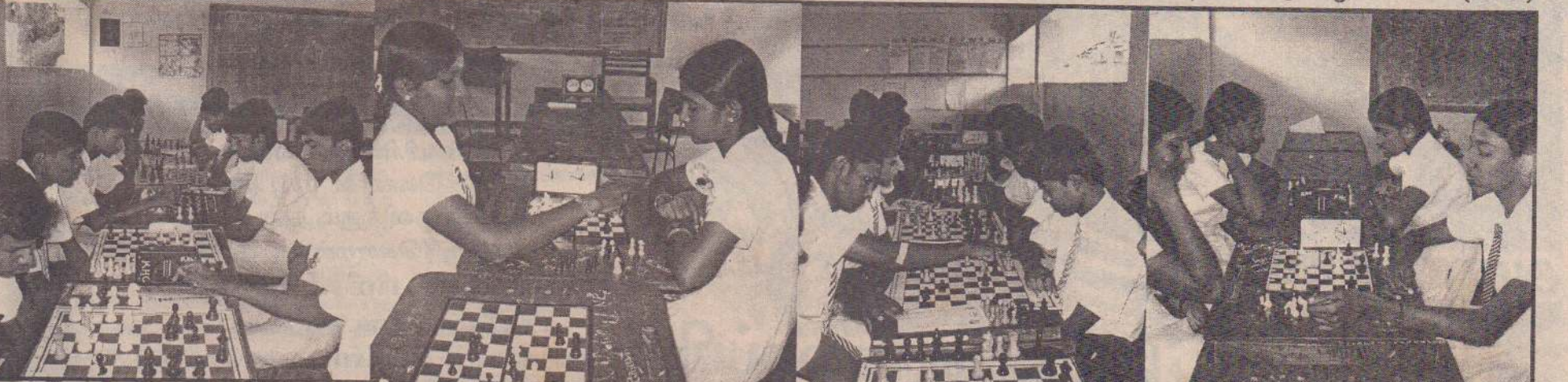
யாழ்ப்பாணம் கல்வி வலய மட்டப் பாடசாலைகளுக்கிடையிலான சதுரங்கச் சுற்றுப்போட்டி 2009 யாழ்.இந்து மகளிர் கல்லூரியில் நேற்று திங்கட்கிழமை நடைபெற்றது. கொக்குவில் இந்துக்கல்லூரி, யாழ்.இந்துக்கல்லூரி, யாழ்.இந்துக்கல்லூரி, யாழ்.இந்துக்கல்லூரி, யாழ்.இந்துக்கல்லூரி, சென்.ஜோன்ஸ் கல்லூரி, சுண்டுக்குளி மகளிர், வேம்படி மகளிர் கல்லூரி ஆகியவற்றைச் சேர்ந்த 19 வயதுக்கு குறைவான ஆண்களின் கழகங்களுக்கு இப்போட்டிகள் நடத்தப்பட்டன. போட்டிகள் நடைபெறும் போது பிடிக்கப்பட்ட படங்கள் இவை.

வட்டுக்கோட்டை ஒல்ட்கோல்ட் விளையாட்டுக் கழகத்திற்கும், யாழ் ஸ்ரார் விளையாட்டுக் கழகத்திற்கும் இடையே இடம் பெற்ற போட்டி மிகவும் விறுவிறப்பாக அமைந்தது. இரு அணிகளும் தலா ஒரு கோலைப் பெற்று ஆட்டம் சம நிலையில் முடிவடைந்தது. இதனால் வெற்றி தோல்வியைத் தீர்மானிப்பதற்காக மேலதிகமாக இரு அணிகளுக்கும் தலா ஐந்து நிமிடங்கள் வழங்கப்பட்டன. இதன்போது ஒல்ட்கோல்ட் விளையாட்டுக் கழகம் மேலும் ஒரு கோலைப் பெற்று 02:01 கோல்கள் என்ற கணக்கில் யாழ் ஸ்ரார் விளையாட்டுக் கழகத்தை வெற்றி கொண்டது. மற்றொரு அரையிறுதி ஆட்டத்தில் தெல்லிப்பழை கிறாஸ் கொப்பேர்ஸ் விளையாட்டுக் கழகமும் யாழ்ப்பாணப் பல்கலைக்கழக அணியும் மோதிக்கொண்டன. கிறாஸ் கொப்பேர்ஸ் விளையாட்டுக் கழகத்தை பல்கலைக்கழக அணி 1:3 கோல்கள் என்ற அடிப்படையில் தோற்கடித்து, இறுதிப் போட்டிக்குத் தகுதி பெற்றது. (86)