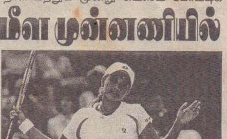
இறுதிப் போட்டியில் பிரான்ஸின் வர்ஜினி ரலானோ உடன் மோதிய அவர் 6:4, 6:2 என்ற நேர் செற்களில் மிக எளிதாக வென்று சம்பியன் பட்டத்தை தட்டிச் சென்றார். ஒற்றையர் பிரிவில் இது அவரது 40ஆவது பட்டம். இந்த வெற்றியுடன், மகளிர் ஒற்றையர் பிரிவு தரவரிசையில் 6 ஆண்டு இடைவெளிக்குப் பிறகு முதல் 5 வீராங்கனைகளில் இடம் பிடித்துள்ளார். 2002ஆம் ஆண்டு பெப்ரவரி 25இல் முதல் இடத்துக்கு முன்னேறினாலும், மணிக்கட்டுக் காயம் காரணமாக இவருக்கு பின்னடைவு ஏற்பட்டது. கடந்த ஆண்டு நடந்த பெய்ஜிங் ஓலிம்பிக் போட்டியில் 2ஆவது முறையாக அவர் தங்கப் பதக்கம் வென்றமை குறிப்பிடத்தக்கது.

கிறிஸ்ட்சர்ச், பெப்.24 "நியூஸிலாந்து ஆடுகளங்கள் பற்றி கவலைப்படத் தேவை இல்லை. இங்குள்ள சூழ்நிலைக்கு ஏற்பச் சிறப்பாக செயல்பட இந்திய அணியினர் தயாராக இருக்கின்றனர்," என பயிற்சியாளர் கிறிஸ்டன் தெரிவித்துள்ளார். நியூஸிலாந்து சென்றுள்ள இந்திய அணி இரண்டு ருவன்ரி 20, ஐந்து ஒரு நாள் மற்றும் மூன்று டெஸ்ட் போட்டிகளில் பங்கேற்கிறது. முதல் ருவன்ரி 20 போட்டி நாளை நடக்கிறது. இத்தொடர் குறித்து இந்திய அணியின் பயிற்சியாளர் கிறிஸ்டன் கூறியவை வருமாறு:-