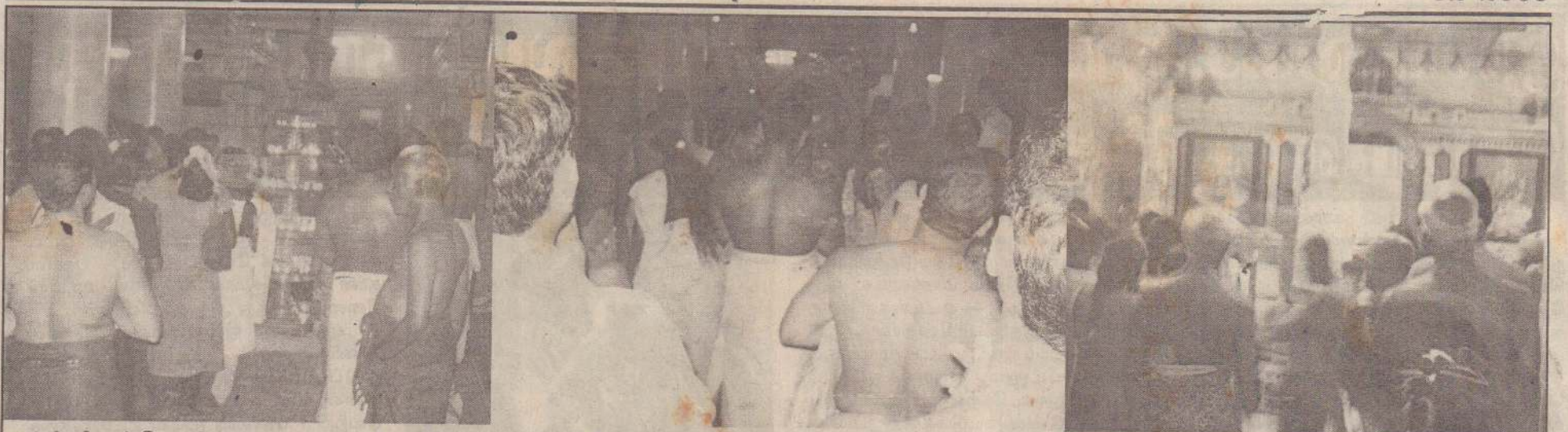
யாழ்.சிவன்கோயிலும் யாழ்.நாச்சிமார் கோயிலிலும் இடம்பெற்ற சிவராத்திரி நிகழ்வின் போது எடுக்கப்பட்ட படங்கள்.