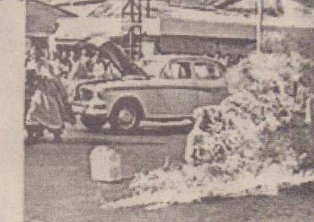
வியட்நாமில் தீக்குளித்த புத்தபிக்கு...