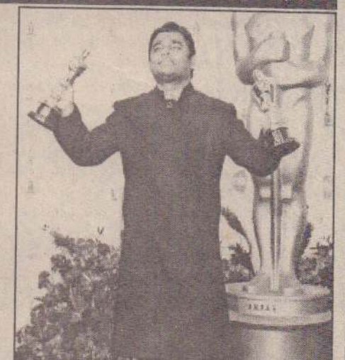
தாக இருந்த 'ஒஸ்கார்' விருதினை நனவாக்கிய ஏ.ஆர்.ரஹ்மானுக்கு இந்திய ஜனாதிபதி, பிரதமர், தமிழக முதலமைச்சர், இந்தியத் திரையுலகப் பிரமுகர்கள் எனப் பலரும் வாழ்த்துக்களைத் தெரிவித்துள்ளனர்.

மல்லாது தமிழ்மொழிக்கும் அவர் பெருமை சேர்த்துள்ளார். ஒஸ்கார் விருதினை வென்ற முதல் இந்தியர் என்ற பெருமையும், முதல் தமிழர் என்ற சிறப்பும் ஏ.ஆர்.ரஹ்மானுக்குக் கிடைத்துள்ளது. அத்தோடு ஒரே தடையில் இரண்டு ஒஸ்கார் விருதுகளை வென்றும் அவர் சாதனை படைத்துள்ளார். 'இசைஞானி' இளையராஜா, டி.ராஜேந்தர் ஆகியோரிடம் உதவியாளராகக் கடமையாற்றிய ஏ.ஆர்.ரஹ்மான் 1992ஆம் ஆண்டு மணி ரத்னம் இயக்கிய 'ரோஜா' படத்தில் இசையமைப்பாளராக அறிமுகமானார். தன்னுடைய முதற்படத்திலேயே - 19 வயதில் - சிறந்த இசையமைப்பாளருக்கான தேசிய விருதைப் பெற்று எல்லோரது கவனத்தையும் ஈர்த்தார். அதன்பின் தமிழ், ஹிந்தி, ஆங்கிலம் உள்ளிட்ட பல்வேறு மொழிப் படங்களில் இசையமைப்பாளராகப் பணியாற்றியுள்ளார். இதுவரை இந்தியா உள்ளிட்ட பல்வேறு