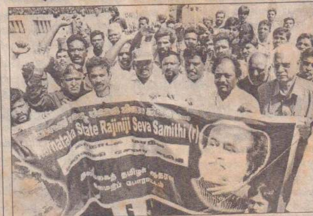
பெங்களூர், மார்ச் 9 இலங்கையில் போரை நிறுத்த வகை செய்து அங்கு தமிழர்களை காப்பாற்றக்

கோரி கர்நாடக மாநிலத்தின் தலைநகர் பெங்களூரில் ரஜினி சேவா சமித்தியின் சார்பில் நேற்று ஞாயிற்றுக்கிழமை பெங்களூரில் மகாத்மா காந்தி சாலையில் உள்ள மகாத்மா காந்தி சிலை அருகே ஈழத்தமிழருக்கு ஆதரவாக அமைதிப் போராட்டம் ஒன்று நடைபெற்றது.