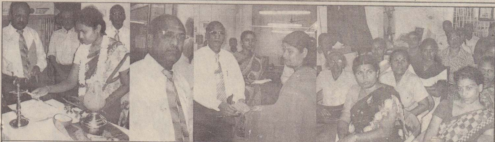
சர்வதேச மகளிர் தினத்தை முன்னிட்டு யாழ்ப்பாண பிரதான விதிக் கிளையில் இடம்பெற்ற வனிதா வாசனா மகளிருக்கான சீட்டிழப்புச் சான்றிதழ் வழங்கும் நிகழ்வு கடந்த திங்கட்கிழமை நடைபெற்றபோது எடுக்கப்பட்ட படங்கள்.

யாழ்ப்பாணம், மார்ச் 11 பெண் தாயாகவோ, பிள்ளையாகவோ, யுவதியாகவோ இருக்கும் ஒவ்வொரு நிலையிலும் துன்பங்களை எதிர்கொள் கிறாள். இந்தநிலை கலாசார ரீதியாக அன்று தொட்டு இன்று வரை தொடர்ந்து கொண்டே இருக்கிறது ஆணை விட பெண் ஐந்தாறு மடங்குசுமையைச் சுமக்கிறாள். சமூகத் தில் ஆண்களைப்போல் பெண்களுக்கும் சமத்துவ உரிமை இருக்க வேண்டும்.