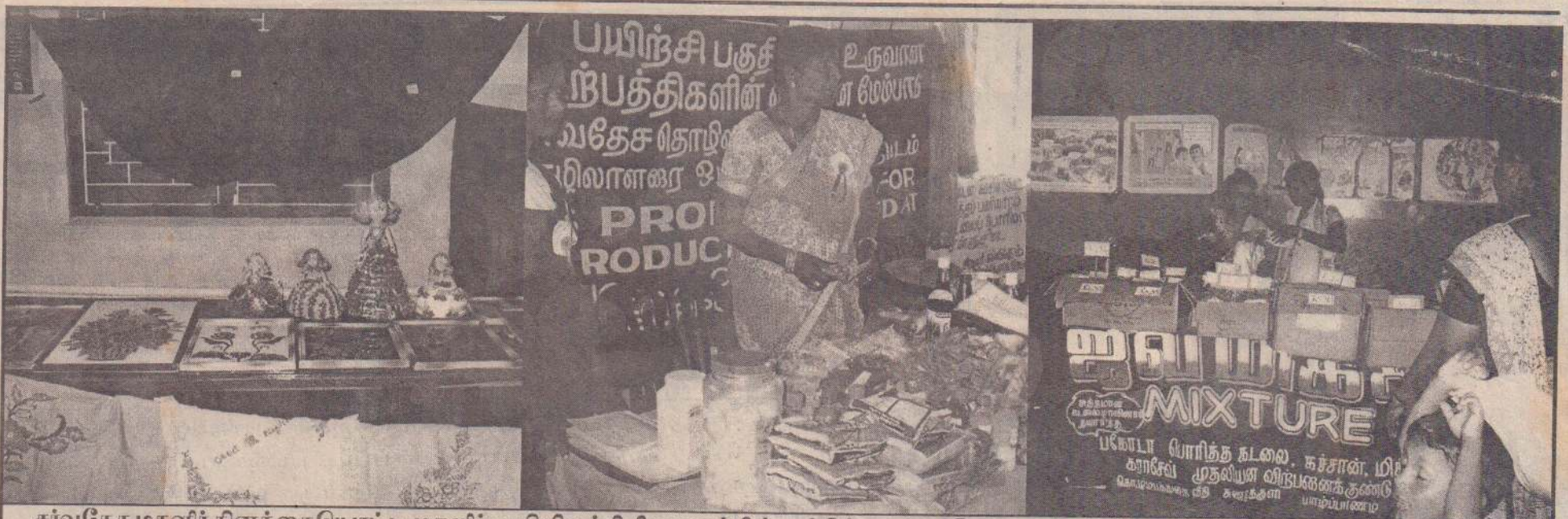
சர்வதேச மகளிர் தினத்தையொட்டி மகளிர் அபிவிருத்தி நிலையத்தின் சார்பில் யாழ்ப்பாணம், நோ.க.சங்கத்தில் காட்சிப்படுத்தப்பட்டிருந்த மகளிரின் தயாரிப்புக்கான பலதரப்பட்ட பொருள்களைப் படங்களில் காணலாம்.