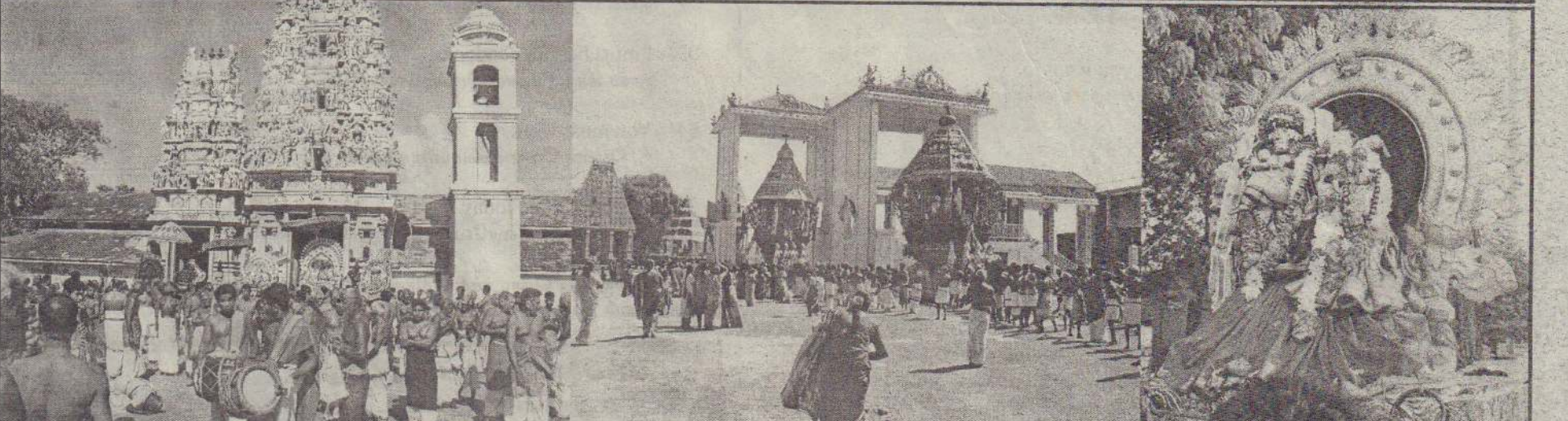
காரைநகர் ஈழத்துச் சிதம்பரத்தில் கடந்த செவ்வாய்க்கிழமை நடைபெற்ற தேர்திருவிழாவில் சோபன்கந்தர் தனது பரிவார மூர்த்திகளுடன் தேருக்கு எழுந்தருளுவதை முதலாவது படத்திலும், பஞ்சரதங்கள் பலவிட வருவதை இரண்டாம் படத்திலும் காணலாம். மறுநாள் புதன்கிழமை அதிகாலை நடைபெற்ற நடேசர் திருவிழாவில் சிவபெருமான் திருவிழா உலா வருவதை அடுத்துள்ள படத்தில் காணலாம்.

ஆனால், இவை எல்லாவற்றிலும் அதிகாரணமாக அமைவது நமது கன்மம் என்பது தான் நிச்சயம். அந்தக் கர்மா தான் பல விளைவுகளை உண்டாக்குகின்றது. மழை பெய்வது ஒரு நிகழ்வு. அதன் காரணமாகப் பூமி ஈரமாதல், ஈசல் வெளிவருதல், தவளை கத்துதல், புல் பூண்டு தளிர் தல், சில பொருள்கள் அழுகுதல், இப்படியாக பல விளைவுகள் ஏற்படுகின்றன. எனவே இப்படியாக பல விளைவுகள் ஏற்படுவதற்கு முக்கிய காரணம் மழையாகும். விஞ்ஞான ரீதியாகவோ அல்லது இயற்கையாகவோ ஒரு விளைவு (Effect) இருந்தால் அதற்கு ஒரு காரணம் (Cause) இருந்தே ஆக வேண்டும். நோய் மாத்திரமல்ல எமது வாழ்வில் பணத்தால், பதவியால், தேக பலத்தால், அறிவுச் சக்தியால் பல பிரச்சினைகள், கஷ்டங்கள் ஏற்படுகின்றன. எனவே துன்பம் என்பது விளைவு, கன்மம் என்பது காரணம்.