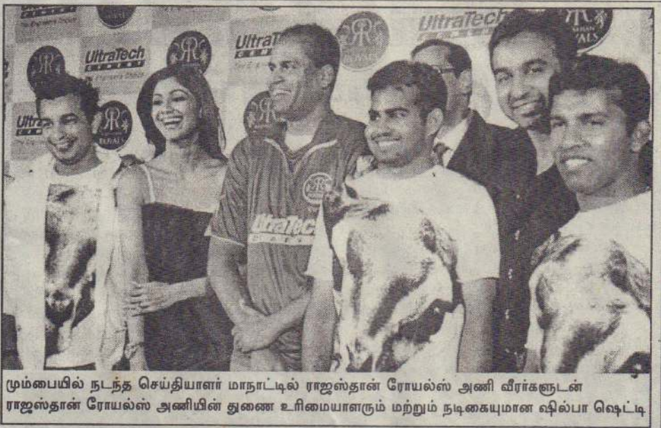
மும்பையில் நடந்த செய்தியாளர் மாநாட்டில் ராஜஸ்தான் ரோயல்ஸ் அணி வீரர்களுடன் ராஜஸ்தான் ரோயல்ஸ் அணியின் துணை உரிமையாளரும் மற்றும் நடிகையுமான ஷிப்பா லெட்டி