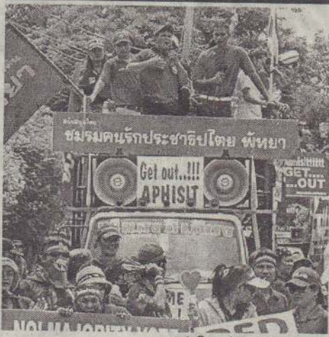
பாங்கொக், ஏப்ரல் 10

தாய்லாந்து பிரதமர் அஜித் வெஜாஜீவாவை பதவி விலகக் கோரி, 80 ஆயிரத்துக்கு மேற்பட்ட எதிர்ப்பாளர்கள், தலைநகரான பாங்