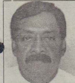
கொழும்பு, ஏப். 22 இன்னும் சில நாட்களில் போர் முடிந்துவிடும் என்கின்றீர்கள். இந்தப் போர் வெற்றி காரணமாக அரசியல் தீர்வு அவசியமில்லை. பேச்சு அவசியமில்லை. நாட்டில் நிரந்தர

சமாதானத்தை இயல்பாகவே ஏற்படுத்தி விடலாம் என நீங்கள் நினைப்பீர்களானால், இவ்விடயத்தில் இன்னும் 50 வருடங்கள் பின்னோக்கிச் செல்லுகின்றீர்கள் என்பதை இந்த சபையிலே கூறிவைக்க விரும்புகிறேன்.