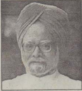
சென்னை எப். 22 விடுதலைப்புலிகளின் இயக்கம் ஒரு பயங்கரவாத அமைப்பு என்றும் அதன் தலைவர் வேலுப்பிள்ளை பிரபாகரன் ஒரு போர்குற்றவாளி என்றும் இந்தியப் பிரதமர் மன்மோகன் சிங் 'டைம்ஸ் நவ்' தொலைக்காட்சிக்கு தெரிவித்துள்ளார் என இந்திய இணையத்தளம் ஒன்று செய்தி வெளியிட்டுள்ளது.

தமிழக முதல்வர் கருணாநிதி விடுதலைப்புலிகள் இயக்கத் தலைவர் வேலுப்பிள்ளை பிரபாகரனை நண்பர் எனத் தெரிவித்த இரண்டு நாட்களின் பின்னர் பிரதமர் மன்மோகன் சிங், விடுதலைப்புலிகளின் இயக்கம் ஒரு பயங்கரவாத அமைப்பு என்றும் அதன் தலைவர் வேலுப்பிள்ளை பிரபாகரன் ஒரு போர்குற்றவாளி என்றும் அதில் எவ்வித மாற்றமும் ஏற்படவில்லை எனவும் தெரிவித்தார்.