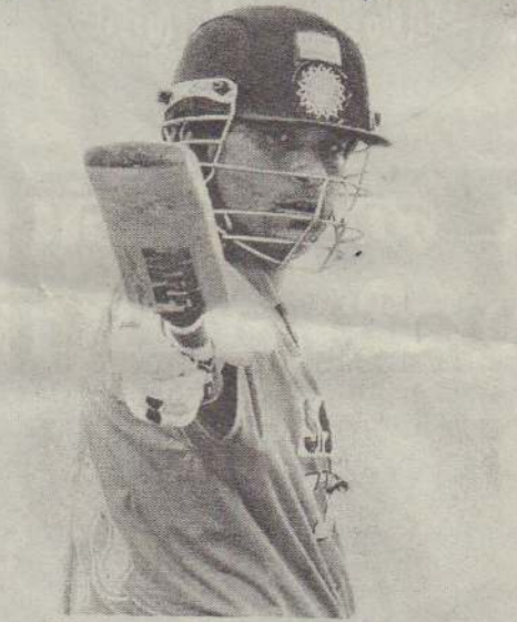
இங்கிலாந்தில் நடைபெறவுள்ள ருவென்ரி 20 உலகக் கோப்பைக்கான இந்திய அணிக்கு நான் தேவையில்லை என இந்திய அணியின் நட்சத்திரத்துடுப்பாட்ட வீரர் சச்சின் டெண்டுல்கர் கூறியுள்ளார்.

தென்னாபிரிக்காவில் நடந்து வரும் இந்தியன் பிரீமியர் லீக் ருவென்ரி 20 தொடரில் மும்பை இந்தியன்ஸ் அணியின் தலைவராகச் செயற்பட்டு வரும் சச்சின் நேற்று முன்தினம் செய்தியாளர்களுக்கு தெரிவித்தவை வருமாறு:- கடந்த 2007இல் நடந்த ருவென்ரி 20 உலகக் கோப்பை அணியில் இருந்து விலகியதற்கு அப்போது நான் முழு உடல்தகுதியுடன் இல்லாததே காரணம். எனவே