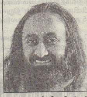
உலகலாளிய ரீதியில் 186 நாடுகளில் மிகப் பெரிய அளவில் சமூக, கலாசார ஆன்மீகத் தொண்டுகளில் ஈடுபட்டுவரும் வாழும் கலை அமைப்பின்

நீ உனக்குள் மிகவும் ஆழமானவன். நீ இந்த உடலில் இருந்தாலும் உன்னை (ஆன்மா) யாராலும் அளவிடமுடியாது. நீ எவ்வளவு ஆழமானவன். எவ்வளவு பழமையானவன் என்று யாராலும் அளவிட முடியாது. உனக்குள் இருக்கும் இந்த உன் உணர்வு நிலை வெறும் நீலமான ஆனந்தம் மட்டுமல்ல.