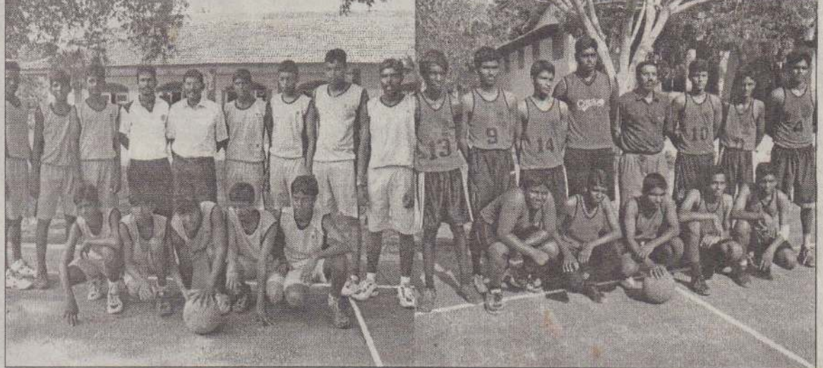
யாழ்.மாவட்டப் பாடசாலை அணிகளுக்கு இடையே நடைபெற்ற கூடைப்பந்தாட்டப் போட்டியில் சம்பியனாகிய யாழ்.மத்திய கல்லூரி வீரர்கள், அதிபர் பயிற்றுவிப்பாளருடன் காணப்படுவதையும், இரண்டாம் இடத்தைப் பெற்றுக் கொண்ட யாழ்.சென்.ஜோன்ஸ் கல்லூரி வீரர்கள் பொறுப்பாளியருடன் காணப்படுவதையும் படங்களில் காணலாம்.

வந்தன. பாடநெறிக்கான மாணவர் தெரிவின்போது இச் சான்றிதழ்களுக்கு அதிக புள்ளிகள் வழங்கப்படுகின்றன. இந்த ஆண்டும் பல மாணவர்கள் உடற்கல்விப் பாட நெறிக்கு விண்ணப்பித்துப் பிரதேச, மாவட்ட, மாகாண, தேசிய மட்ட விளையாட்டுச் சான்றிதழ்களுடன் நேர்முகப் பரீட்சைக்குச் சென்றனர்.