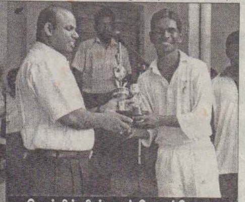
வெற்றிக் கிண்ணம் பெறும்போது

லைடஸ் விளையாட்டுக் கழகம் சம்பியனாகியது. கொக்குவில் இந்துக் கல்லூரி மைதானத்தில் இடம் பெற்ற இறுதிப் போட்டியில் யாழ்ப்பாணம் ஜொலிஸ்ரார் விளையாட்டுக் கழகமும், யாழ்ப்பாணம் சென்றலைடஸ் விளையாட்டுக் கழகமும் மோதிக்கொண்டன. நாணயச் சுழற்சியில் வெற்றிபெற்ற சென்றலைடஸ் விளையாட்டுக் கழகம் முதலில் துடுப்பெடுத்தாடியது. 33.1 ஓவரில் அனைத்து விக்கெட்டுக்களையும் இழந்து 244 ஓட்டங்களைப் பெற்றுக் கொண்டது. கே.செல்ரன் ஆறு பவுண்டரிகள் மூன்று சிக்கர்களுடன் 65 ஓட்டங்களையும்