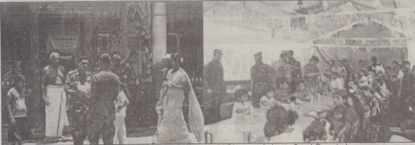
வெசாக் தினத்தை முன்னிட்டு கரவெட்டி சிவில் பாதுகாப்பு பிரிவினரும் உடுப்பிட்டி பாதுகாப்புப் படையினரும் இணைந்து மக்களுக்கு அன்னதானம் வழங்கியபோது எடுக்கப்பட்ட படங்கள். உடுப்பிட்டி பாதுகாப்புப் படைமுகாமுக்கு முன்பாக உள்ள பிள்ளையார் ஆலயத்தில் படையினர் அர்ச்சனை செய்வதையும் பருத்தித்துறைப் பாதுகாப்புப் படை பிரிவின் பொறுப்பதிகாரி கேணல் ஜெயசூரிய தலைமையில் அன்னதானம் இடம்பெறுவதையும் படங்களில் காணலாம்.