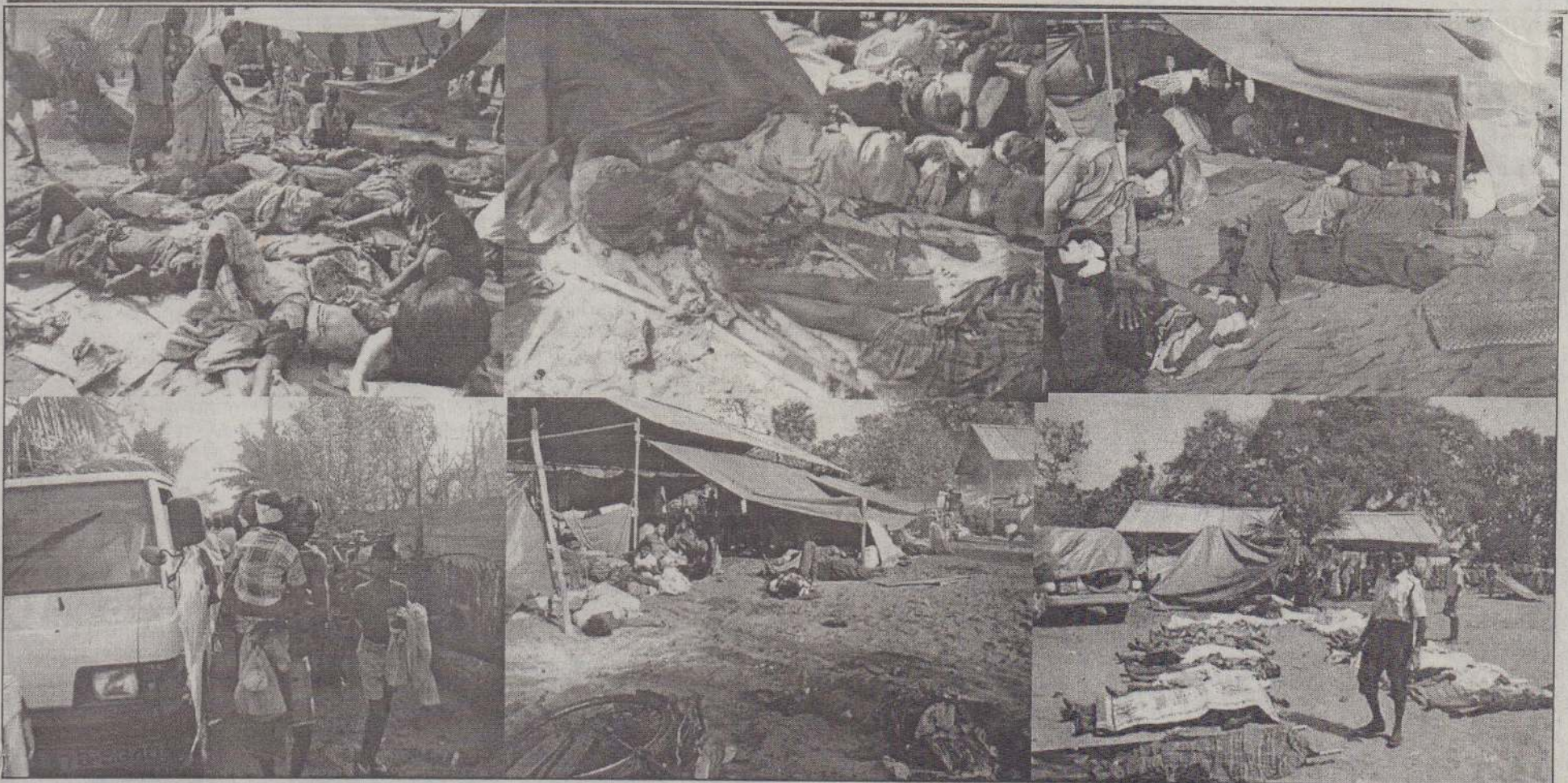
முள்ளிவாய்க்கால் வைத்தியசாலை மீது நேற்று மேற்கொள்ளப்பட்ட தாக்குதலில் கொல்லப்பட்டோர் மற்றும் காயமடைந்தோரைப் படங்களில் காணலாம்.