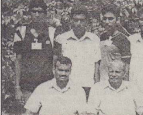
மூலிகைகளைப் பராமரிக்கும் உறுப்பினர்கள்

தாக இருந்தது. கேள்வி: மூலிகைகளையெல்லாம் பைக்கற்றுக்களில் வைத்துள்ளீர்கள். இவற்றினை எல்லாம் இணைத்து மூலிகைத் தோட்டம் ஒன்றை அமைக்கவேண்டும் என்று எண்ணம் தோன்றவில்லையா? ஈதில்: இந்த அரும்பெரும் மூலிகைகள் தான் எனது சொத்துக்கள். எனது சொந்தப் பிள்ளைகளைப் போல பராமரித்து வருகிறேன். இவற்றினை மூலிகைத்தோட்டம் ஆக்கவேண்டும் என்ற எண்ணம் எனக்குள் இருக்கிறது. ஆனால் நான் குடியிருப்பது கூட வாடகை வீடு எனக்கென்றொரு காணியில்லை. எமது மூலிகைப் பாதுகாப்பு சங்கத்திற்கு யாராவது சமூக நலன் விரும்பிகள் காணியினைத்தந்து உதவினால் இந்த மூலிகைகளைக் கொண்டு பாரியதொரு மூலிகைத் தோட்டம் என்னால் உருவாக்க முடியும்.