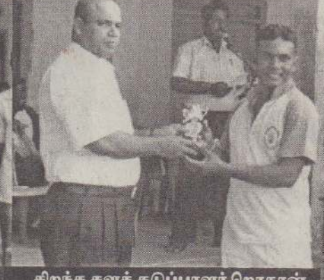
சிறந்த களத் தடுப்பாளர் ரொகான்