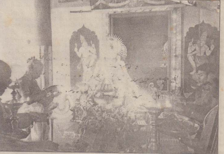
அளவெட்டி வடக்கு தவளகிரி முத்துமாரி அம்பாள் ஆலயத்தில் அண்மையில் இடம்பெற்ற இலட்சாச்சனையின் போது எடுக்கப்பட்ட படம்.