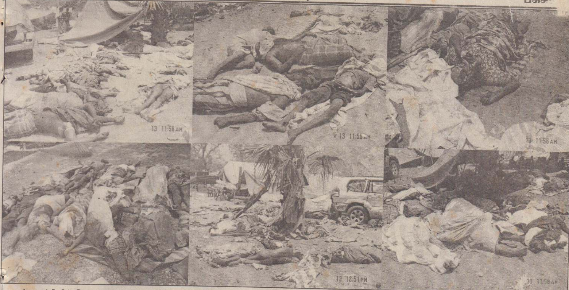
முல்லைத்தீவில் கோரத் தாண்டவமடமும் போரில் பிணக் குவியல்களாகிக் கிடக்கும் பாதுகாப்பு வலய மக்களில் ஒரு பகுதியினர்...