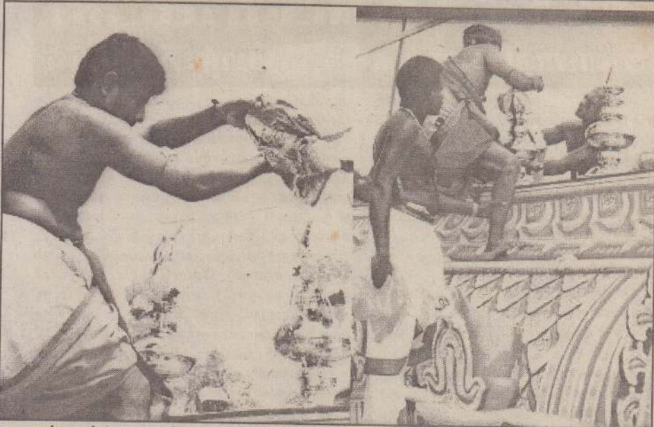
அல்வாய் சாமணந்தறை ஆலயப் பிள்ளையார் ஆலயத்தில் புனர் நிர்மாணம் செய்யப்பட்ட வசந்த மண்டப கலச சும்பாபிஷேகம் கடந்தமாதம் நடைபெற்ற போது எடுக்கப்பட்ட படங்கள்.