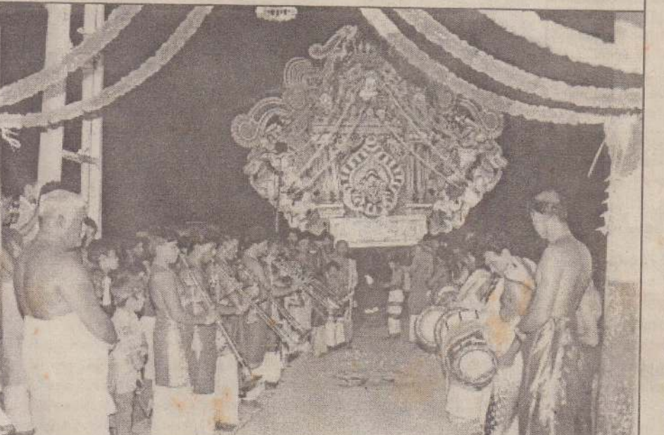
காரைநகர் மடத்துக்கரை முத்துமாரி அம்மன் ஆலயத்தில் நடைபெற்ற வருடாந்த அலங்கார உற்சவத்தில் அலங்கரிக்கப்பட்ட முத்துச்சுப்பறத்தலை அம்பாள் தேரின் உலா வருவதைப் படத்தில் காணலாம்.