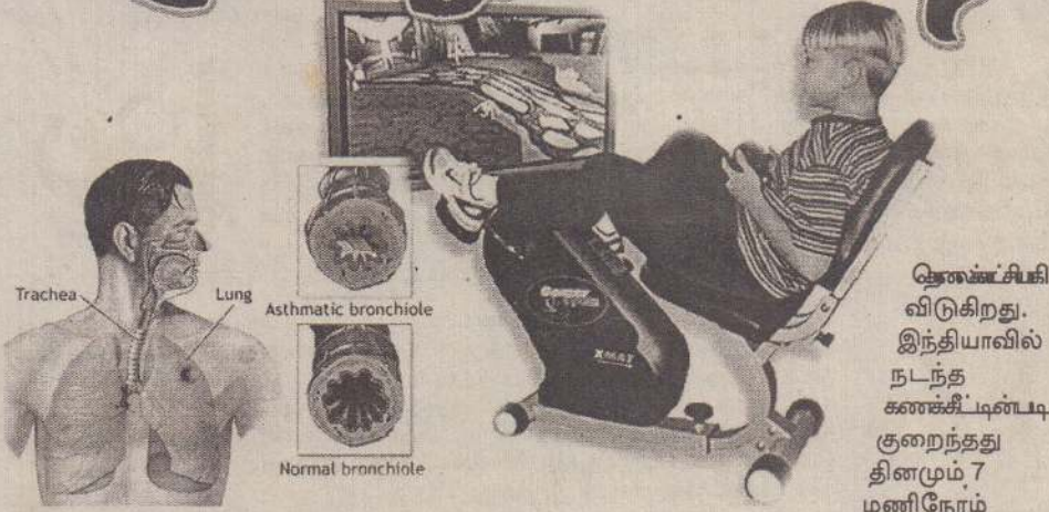
கண்காட்சியினை விடுகிறது. இந்தியாவில் நடந்த கண்காட்சியின்படி குறைந்தது தினமும் 7 மணிநேரம்

கேள்வி: சமீபத்தில் ஒரு பத்திரிகையின் மருத்துவப் பகுதியில் - தொலைக்காட்சி பார்க்கும் குழந்தைகளுக்கு ஆஸ்துமா (Asthma) நோய் ஏற்படும் சாத்தியம் அதிகம் என்று வாசித்தேன். இது உண்மையா? குழந்தைகள் தொலைக்காட்சி நிகழ்ச்சிகளை மிகவும் ரசித்துப் பார்க்கின்றார்கள். பாதிப்பு ஏற்படாமல் தொலைக்காட்சி பார்க்கப்பதற்கு வழி உண்டா?