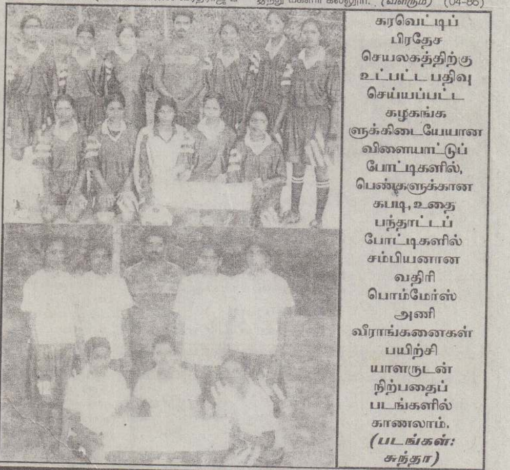
கரவேட்டிப் பிரதேச செயலகத்திற்கு உட்பட்ட பதிவு செய்யப்பட்ட கழகங்களுக்கிடையேயான விளையாட்டுப் போட்டிகளில், பெண்களுக்கான கபடி, உதை பந்தாட்டப் போட்டிகளில் சம்பியனான வதிரி பொம்மேர்ஸ் அணி வீராங்கனைகள் பயிற்சியாளருடன் நிற்பதைப் படங்களில் காணலாம்.

4x400 மீற்றர் அஞ்சலோட்டம் இளவாலை கன்னியர் மடம் பாடசாலை, கொக்குவில் இந்துக்கல்லூரி, வடமராட்சி இந்து மகளிர் கல்லூரி. (வளரும்) (04-86)