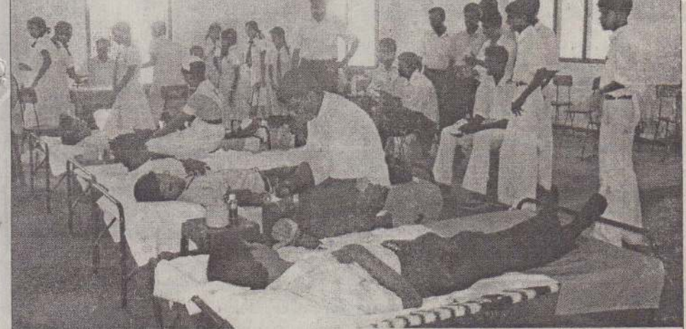
காரைநகர் கலாநிதி ஆ.தியாகராசா மத்திய மகாவித்தியாலயத்தின் குருதிக்கொடையாளர் கழகத்தினால் ஒழுங்கு செய்யப்பட்ட இரத்ததான முகாம் மேற்படி கல்லூரியில் நடைபெற்ற போது எடுக்கப்பட்ட படம். இரத்ததானம் வழங்கிய ஆசிரியர்கள், மாணவர்களைப் படத்தில் காணலாம்.

சங்கங்களுக்குப் பொருள்கள் வழங்கப்படாமையே காரணம் யாழ்ப்பாணம், மே 18 கடந்த ஏப்ரல், மே மாதங்களுக்கான சமுர்த்தி நிவாரணங்கள் சில பலநோக்குக் கூட்டுறவுச் சங்கங்களுக்கு இதுவரை வழங்கப்படாமையால் சமுர்த்திப் பயனாளிகள் பாதிக்கப்பட்டுள்ளனர். இந்த நிவாரணத்தை உடனடியாக வழங்குமாறு பிரதேச செயலகங்கள் அறிவித்தும் கூட கூட்டுறவுச் சங்கங்கள் சில இதுவரை அவற்றை விநியோகிக்கவில்லை என்று சங்க வட்டாரங்கள் தெரிவித்தன. பல நோக்குக் கூட்டுறவுச் சங்கங்கள் யாழ். செயலகத்திற்கு வழங்க வேண்டிய அரசு உண்களைச் செலுத்தினால் மட்டுமே இந்த நிவாரணத்திற்குப் பொருள் வழங்கப்படும் என செயலகம் நிபந்தனை விதித்துள்ளது.