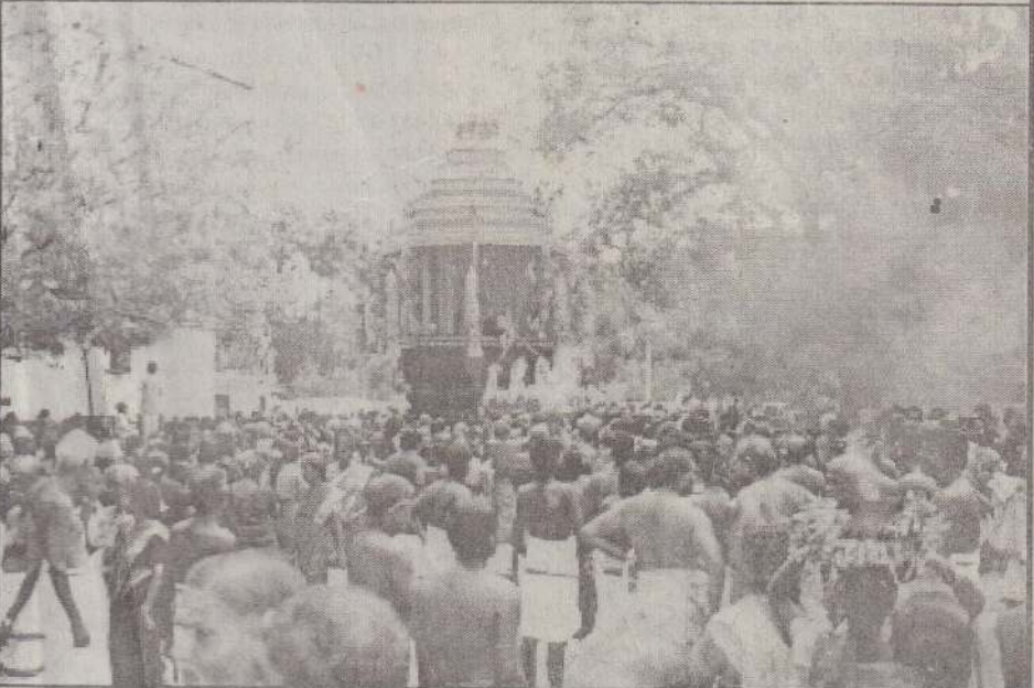
காரைநகர் மணற்காடு முத்துமாரி அம்மன் ஆலயத்தில் நடைபெற்ற தேர்த்திருவிழாவின்போது எடுக்கப்பட்ட படம். அர்ப்பனர் பக்தர்கள் புடைசூழ தேரில் திருவிதி உலாவிக்கொண்ட போது எடுக்கப்பட்ட படம். (208)