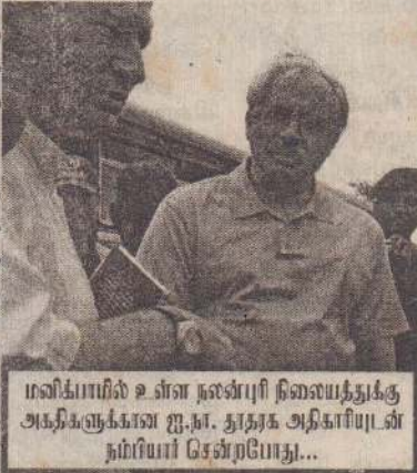
மனிதர்களின் உள்நடவழி நிலையத்துக்கு அங்குள்ள ஐ.நா. ஆதரவு அதிகாரிகள் நம்பியார் சென்றபோது...

கொழும்பு, மே 22 இலங்கை வந்துள்ள ஐக்கிய நாடுகள் சபையின் செயலாளர் நாயகம் பான் கீ மூனின் சிறப்புப் பிரதிநிதி விஜய் நம்பியார் நேற்று வவுனியாவில் உள்ள இடம்பெயர்ந்த மக்களுக்கு கான முகாம்களுக்கு நேரில் சென்று பார்வையிட்டார். அத்துடன், இறுதிமாதல்கள் இடம்பெற்ற முள்ளிவாய்க்கால் பகுதியையும் ஹெலிகொப்டரில் இருந்து வாய்ப்பு பார்வையிட்டார். நேற்று வியாழக்கிழமை காலை கொழும்பில் இருந்து விசேட ஹெலிகொப்டர் மூலம் வவுனியா சென்ற நம்பியார், அங்குள்ள மனிதர்களின் அமைச்சுப்பட்டுள்ள இடம்பெயர்ந்தோருக்கான முகாம்களைப் பார்வையிட்டார்.