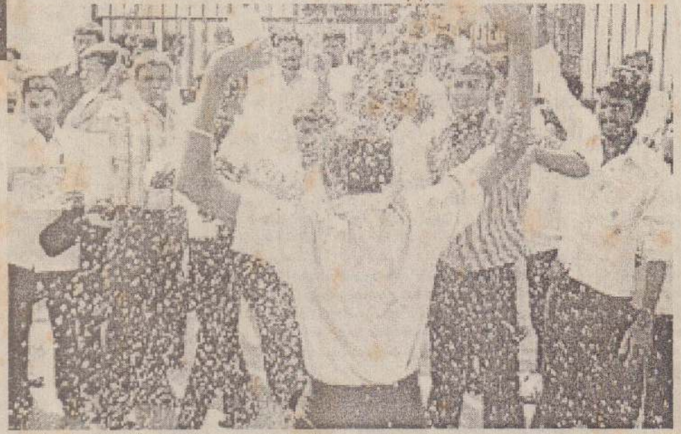
இதனால் சட்டக்கல்லூரி முன்பு பதற்றம் ஏற்பட்டது. தொடர்ந்து மாணவர்கள் கல்லூரி முன்பு தரையில் அமர்ந்து போராட்டத்தில் ஈடுபட்டனர். அதைத்தொடர்ந்து அங்கு துப்பாக்கி ஏந்திய துணை இராணுவ வீரர்கள் குவிக்கப்பட்டனர். தொடர்ந்து பொலிஸார் பாதுகாப்பு பணியில் ஈடுபட்டு வருகிறார்கள் எனக் கூறப்படுகிறது.

அப்போது பொலிஸாருக்கும், மாணவர்களுக்கும் இடையே கடும்கொண்டுவாதமும் தள்ளு-முள்ளும் ஏற்பட்டன.