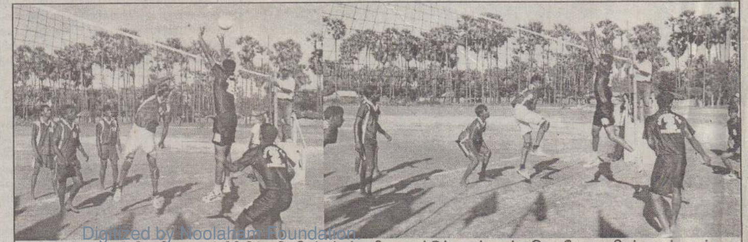
தெல்லிப்பழை பிரதேச செயலகம் அமைப்பில் பதிவுசெய்யப்பட்ட விளையாட்டுக் கழகங்களுக்கு இடையே நடைபெற்ற ஆண்களுக்கான கரப்பந்தாட்டப் போட்டியில் பன்னாலை கணேசன் விளையாட்டுக் கழகம் சம்பியனாகியது. இறுதிப்போட்டியில் பன்னாலை கணேசன் விளையாட்டுக் கழகமும் காவகச்சேரி அருணோதயாக் கழகமும் மோதிக்கொள்வதைப் படங்களில் காணலாம்.

தட்டெறிதல் கு.சுகனா (தெல்லிப்பழை மகாஜனக்