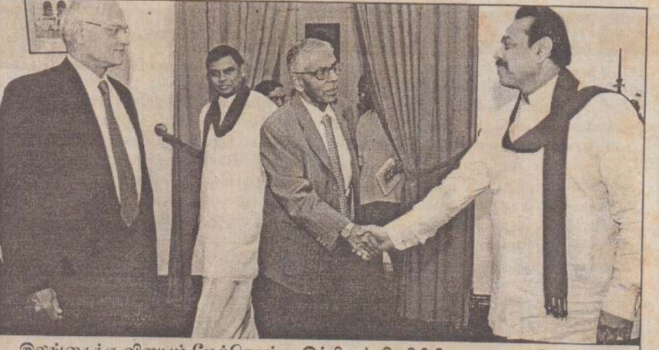
இலங்கைக்கு விஜயம் மேற்கொண்ட இந்தியப் பிரதிநிதிகளை ஜனாதிபதி மஹிந்த ராஜபக்ச அவரிடமிருந்து சந்தித்தபோது....

வேண்டும் எனவும் வலியுறுத்தினார். அத்துடன் அர்த்தமுள்ள ஒரு சரியான அரசியல் தீர்வை முன்வைப்பதற்கு இந்திய அரசு முழுமையான அழுத்தங்களைக் கொடுக்க வேண்டும் என்றும் கேட்டுக் கொண்டனர். நலன்புரி நிலையங்களில் தங்கியிருக்கின்ற ஐந்து வயதுக்குட்பட்ட குழந்தைகளுக்குத் தடுப்பூசிகள் வழங்கப்படவில்லை. அவர்களுக்கான தடுப்பூசிகள், கர்ப்பிணித் தாய்மார் மற்றும் பாலூட்டும் தாய்மார்களுக்கான சத்துணவுகூட்டு உடனடியாக வழங்கப்பட வேண்டும். மற்றும் சத்தமான குடிதண்ணீர் வழங்கப்பட வேண்டுமென்றும் வலியுறுத்தினர். இடம்பெயர்ந்த மக்களை 180 நாட்களுக்குள் அவர்களது சொந்த வீடுகளில் குடியமர்த்துவதற்கான முழுமையான நடவடிக்கைகளை எடுப்பதாக இலங்கை அரசு தங்களுக்கு உறுதி அளித்துள்ளதாகவும், அவ்வாறான சந்தர்ப்பத்தில் அப்பிரதேசங்களுக்கான பாடசாலை வீதிகள் உட்பட அனைத்து உட்கட்டுமானங்களையும் ஏற்படுத்தித் தருவதற்கான உதவிகளை வழங்க இந்திய அரசு உறுதியளிப்பதாகவும் கொழும்பு வந்த இந்திய அதிகாரிகள் தெரிவித்தனர். அரசியல் தீர்வு தொடர்பான அக்கறை இந்தியா ஏற்கனவே ஆரம்பித்ததாக இந்தியத் தரப்பினர் சுட்டிக்காட்டினர். அத்துடன் வன்னியில் இருந்து இடம்பெயர்ந்து நலன்புரி முகாம்களில் தங்கியுள்ள இளைஞர், யுவதிகள் மத்தியில் உயர்கல்விக்குத் தகுதியானவர்களுக்கு இந்தியாவில் உயர்கல்வி கற்க விசேட அடிப்படையில் புலமைப்பரிசில் பெற்றுக்கொடுக்கப்பட வேண்டுமென விடுத்த வேண்டுகோளை இந்தியத் தரப்பு ஏற்றுக்கொண்டு அதற்கான நடவடிக்கைகளை விரைவில் எடுப்பதாகவும் உறுதியளித்துள்ளது - என்று தெரிவிக்கப்பட்டுள்ளது. (அ-1-சி)