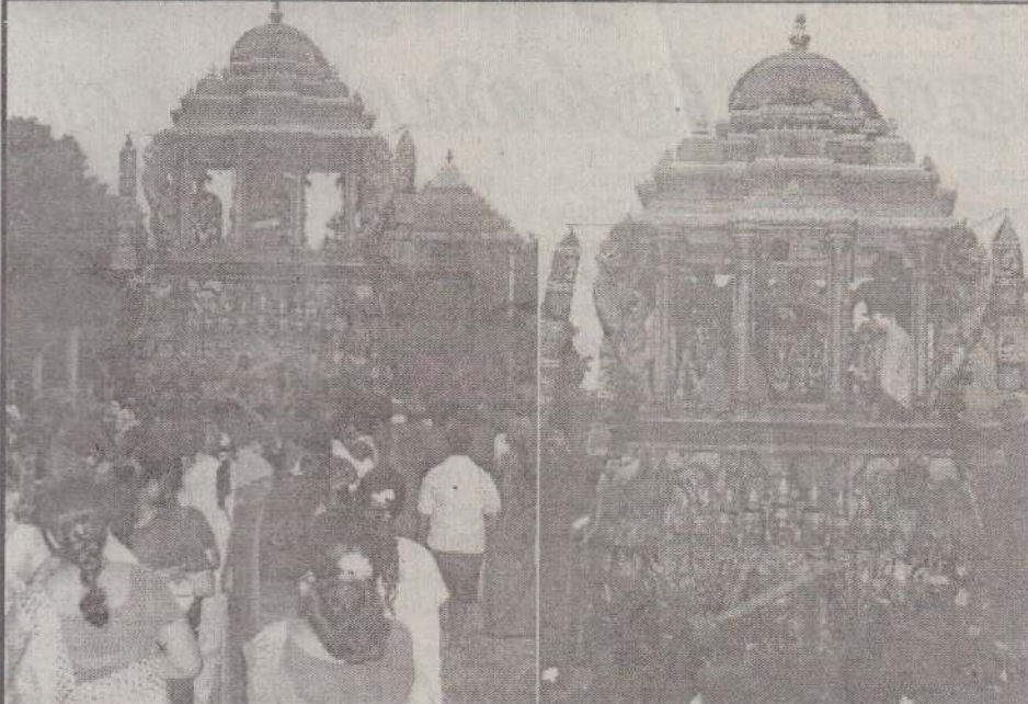
திருநெல்வேலி அருள்மிகு ஸ்ரீ நீலாயதாவி சமேத ஸ்ரீ காயாரோகண சுவாமிக்கள் கோயில் கைலாச வாகன உற்சவத்தின்போது எடுத்த படங்கள்.