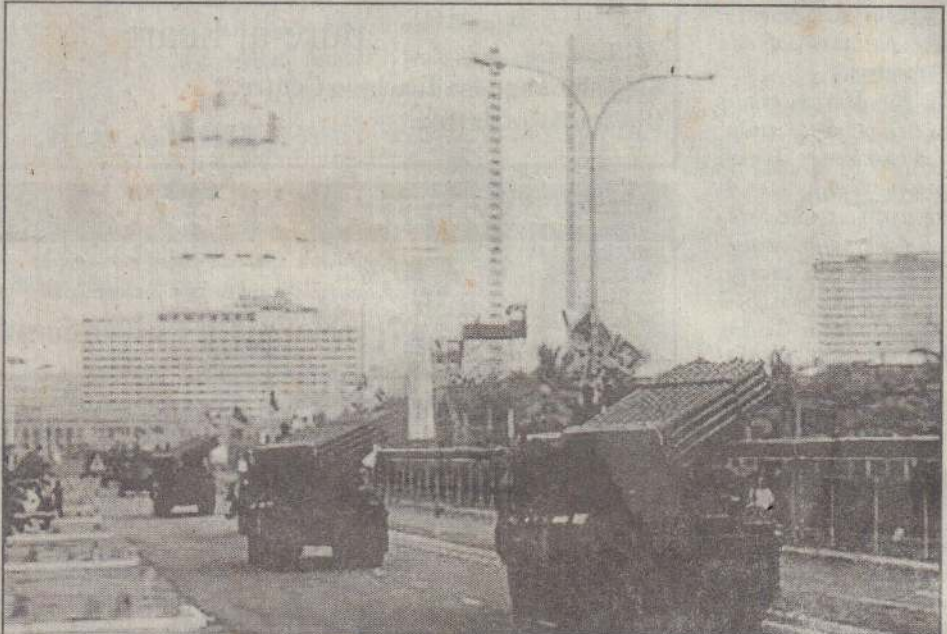
தேசிய வெற்றித் தின நிகழ்வுகளுக்கான ஒத்திசைவு நேற்று காலி முகத்திடலில் இடம்பெற்றபோது பல்குழல் ஏவுகணைகளுடன் அணிவகுத்துச் செல்லும் படையினர்.

மீண்டும் பயங்கரவாதம் ஏற்படாதிருக்க வேண்டும் என்றால் தமிழ்த் தேசியக் கூட்டமைப்பு எழுந்து இந்தக் கோரிக்கையை ஏற்றுச் செயற்பட வேண்டும்.