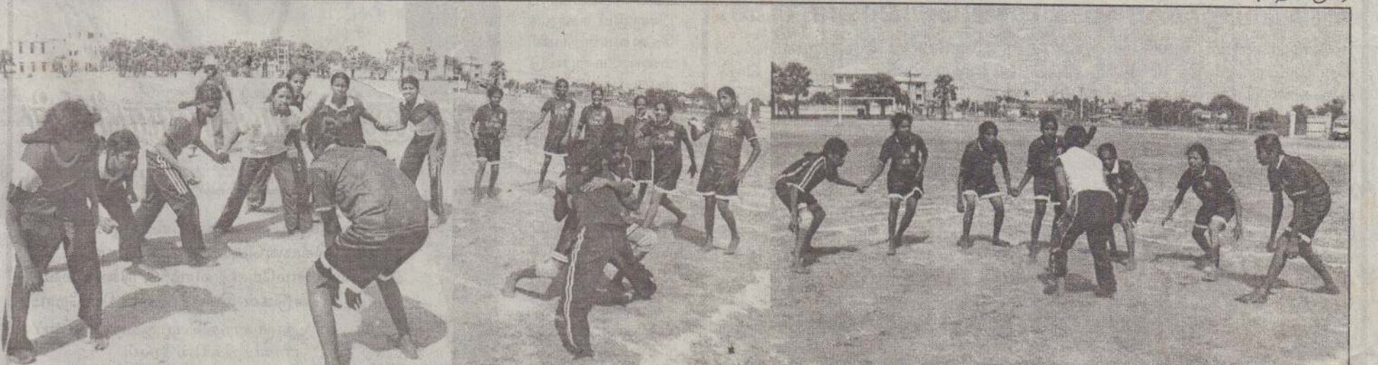
யாழ்.மாவட்டச் செயலக விளையாட்டுப் பிரிவு வடமாகாண விளையாட்டுத் திணைக்களத்தின் ஆதரவுடன் யாழ்.மாவட்டப் பிரதேச செயலகங்கள், உதவி அரசாங்க அதிபர் பிரிவுகளுக்கிடையே நடைபெற்ற பெண்களுக்கான இறுதிப்போட்டியில் நல்லூர் பிரதேச செயலக அணி மாவட்டச் சம்பியனாகத் தெரிவுசெய்யப்பட்டுள்ளது.

எனினும் ஆட்ட நிறைவில் நல்லூர் பிரதேச செயலக அணி 26:23 புள்ளிகள் என்ற அடிப்படையில் தெல்லிப்பழை பிரதேச செயலக அணியை வெற்றி பெற்று யாழ்.மாவட்டச் சம்பியனாகத் தெரிவுசெய்யப்பட்டது. (4-86)