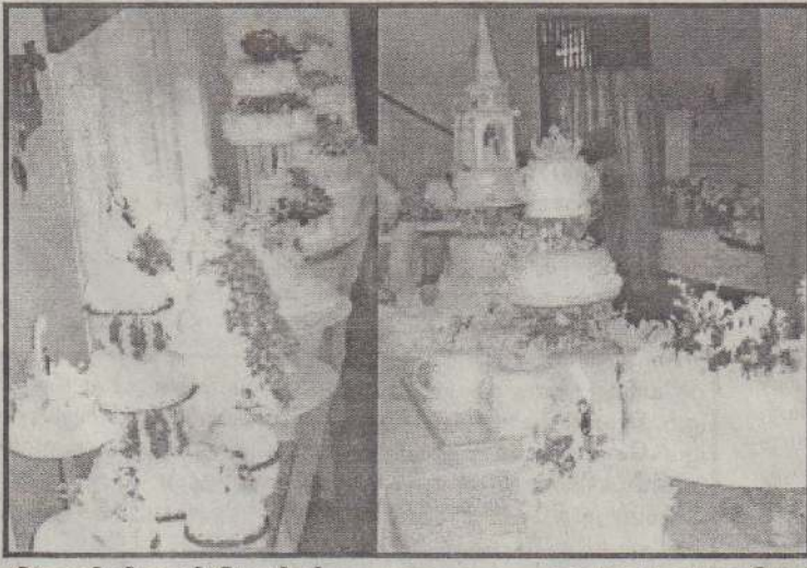
என்னிடம் அழகுக்கலை, 'கேக்' ஐசிங் போன்ற பயிற்சிகளைப் பெற்ற மாணவிகள் புலம்பெயர்