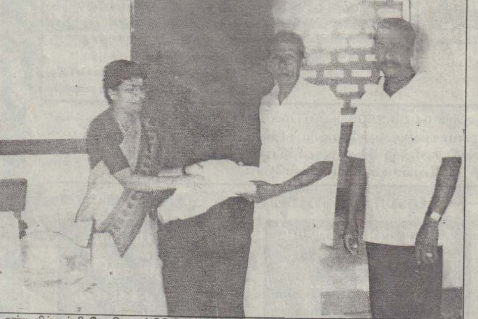
சண்டிலிப்பாய் பிரதேச செயலர் பிரிவில் வறுமைக் கோட்டின்கீழ் உள்ள மாணவர்களுக்கு கிறிஸ்தவ சிறுவர் நிதியத்தால் உதவிப் பொருள் வழங்கப்பட்டது. உதவிப் பொருள்களை முன்னாள் பிரதேச செயலரும் தற்போதைய மேலதிக அரசு அதிபருமான திருமதி ரூபினி வரதலிங்கம் பயனாளி ஒருவருக்கு வழங்குவதைப் படத்தில் காணலாம். (112)