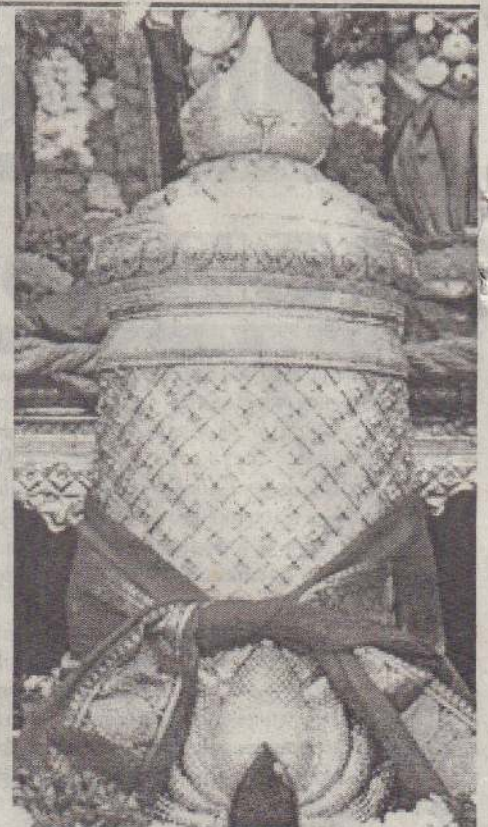
திருப்பதி ஏழுமலையானுக்கு செய்யப்பட்ட 45 கோடி ரூபா மதிப்புள்ள வைரக் கிரீடம்....

இது இந்தியாவிற்கு குறிப்பாக தமிழகத்திற்கும் தமிழக மீனவர்களின் வாழ்வுரிமைக்கும் மிகுந்த பாதிப்பை ஏற்படுத்தக் கூடியதாகும். எனவே, கச்சதீவில் இலங்கையின் அத்துமீறலை உடனடியாகத் தடுத்து நிறுத்த வேண்டும் - என்றுள்ளது.