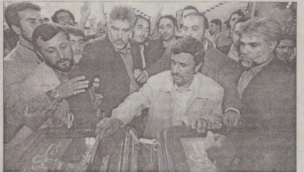
நேற்று வெள்ளிக்கிழமை ஆரம்பமான ஈரானிய ஜனாதிபதித் தேர்தலில் ஈரானிய ஜனாதிபதியும், வேட்பாளர்களில் ஒருவருமான மஹ்மூத் அஹ்மதிநிஜாத், தலைநகரான தெஹ்ரானில் தமது வாக்கை அளிக்கும் போது....

பிறப் பித்தது. இதனால் ஆத்திரமடைந்த பஷீர் மார்ச்சில் 13 வெளிநாட்டு மனிதநேய உதவி நிறுவனங்களை நாட்டைவிட்டு வெளியேறுமாறு உத்தரவிட்டார். சர்வதேச குற்றவியல் நீதிமன்றத்துக்கு தம்மைப் பற்றிய இரகசிய தகவல்களை இந்தநிறுவனங்களை அளித்து வந்துள்ளன என்றும் இவற்றிலுள்ளவர்கள் அனைவரும் உளவாளிகள் என்றும் இவர் பகிரங்கமாகக் குற்றஞ்சாட்டி வந்தார். இவரின் உத்தரவை அடுத்து, இந்தநிறுவனங்கள் வெளியேறிவிட்டன. தற்போது இவற்றில் நான்கு நிறுவனங்களுக்கு ஜனாதிபதி பஷீர் அழைப்பு விடுத்ததுள்ளார். டாபூர் பிராந்தியத்தில் இடம்பெற்ற வந்த மோதல்களில், 3 இலட்சம் பேர் கொல்லப்பட்டுள்ளனர். 2 கோடியே 70 இலட்சம் மக்கள் வெளியேறியும், பல வந்தமாக வெளியேற்றப்பட்டுமுள்ளனர் என ஜ.நா.கனிப்பீடு செய்துள்ளது.