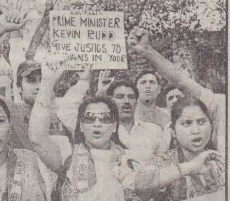
ஆஸ்திரேலியாவில் இந்திய மாணவர்கள் தாக்கப்பட்டமையைக் கண்டித்து டில்லியில் இளைஞர் காங்கிரஸ் சார்பில் நேற்றுமுன்தினம் ஆர்ப்பாட்டம் நடந்தது. அதில் கலந்துகொண்டவர்கள் ஆஸ்திரேலிய அரசைக் கண்டித்து கோஷமிட்டபோது.....

என் மீது முட்டை வீசிய சட்டத்தரணிகளை பார் கவுன்ஸிலில் இருந்து நீக்க வேண்டும் என்றும், அந்தச் சம்பவத்தில் ஈடுபட்ட சட்டக் கல்லூரி மாணவர்களை கல்லூரியில் இருந்து நீக்க வேண்டும் என்றும் தனியாக ஒரு மனுத் தாக்கல் செய்ய வுள்ளேன். பொதுமக்களுக்கு சேவை செய்யவே சட்டத்தரணிகள் உள்ளனர். ஆனால் அவர்கள் முட்டை வீசுக போன்ற சம்பவங்களில் ஈடுபட்டு தங்களை அமாமாணப்படுத்துகின்றனர்.