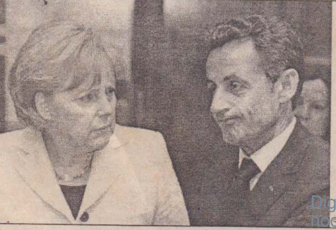
பிரசல்ஸில் நேற்று வெள்ளிக்கிழமை ஆரம்பமான ஐரோப்பிய ஒன்றியத் தலைவர்களின் இரண்டு நாள் உச்சிமன்றத்தில் ஜேர்மன் ஜனாதிபதி ஏக்ஸ்சலா மேர்கெலும், பிரான்ஸ் ஜனாதிபதி நிக்கோலஸ் சர்கூஸும் காணப்பட்டனர்.

1990 ஆம் ஆண்டு அல்ஜீரியாவில் தலைநகராக சிவில் யுத்தத்தில் சம்பந்தப்பட்ட பலரும் இந்த இஸ்லாமிய தீவிரவாத அமைப்பில் இணைந்துள்ளார்கள். இந்த அமைப்பு ஓசாமா பின்லேடின் அல்-குவைதா அமைப்புடன் தொடர்புடையது.